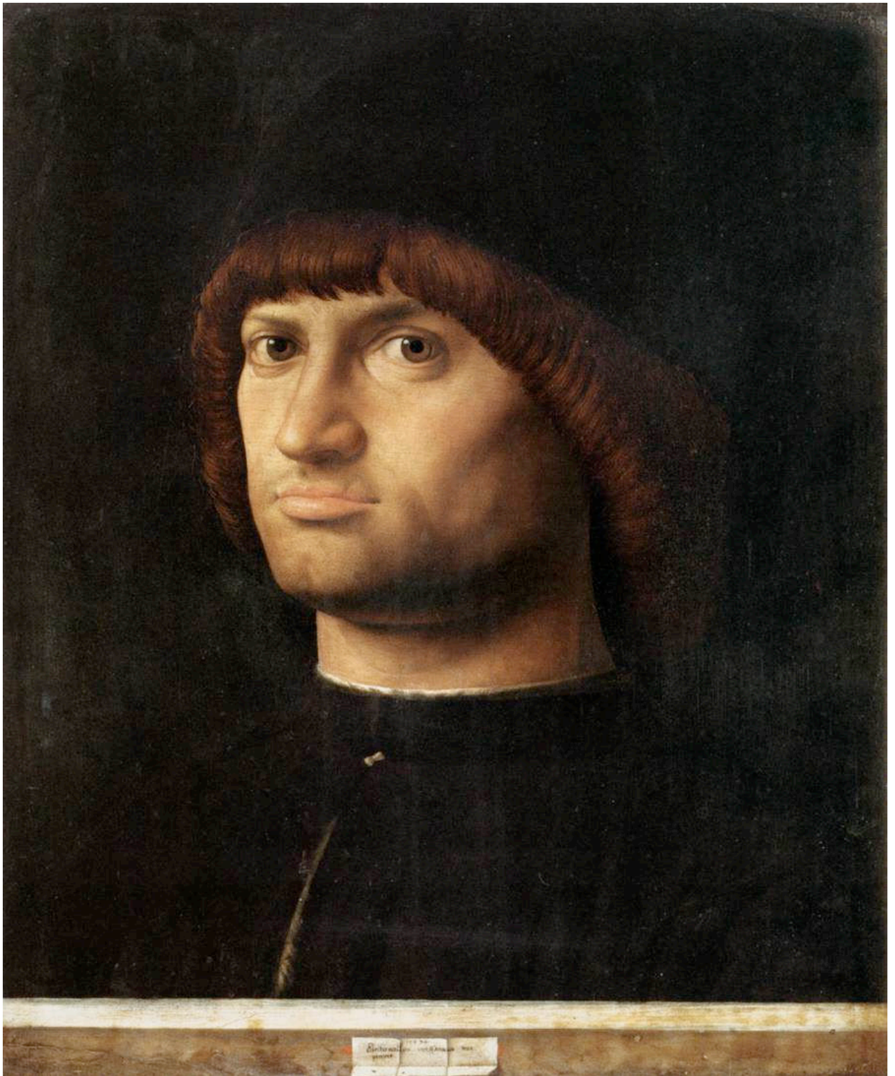
Le Condottière – 1475 - Antonello de Messine

Peinture à l'huile sur bois – 36 cm x 30 cm – Musée du Louvre Paris