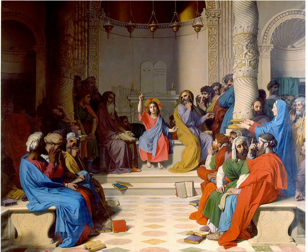
Jésus au milieu des docteurs – 1842/1862 – Jean Auguste Dominique Ingres

Huile sur bois – 265 cm x 320 cm – Musée Ingres Montauban