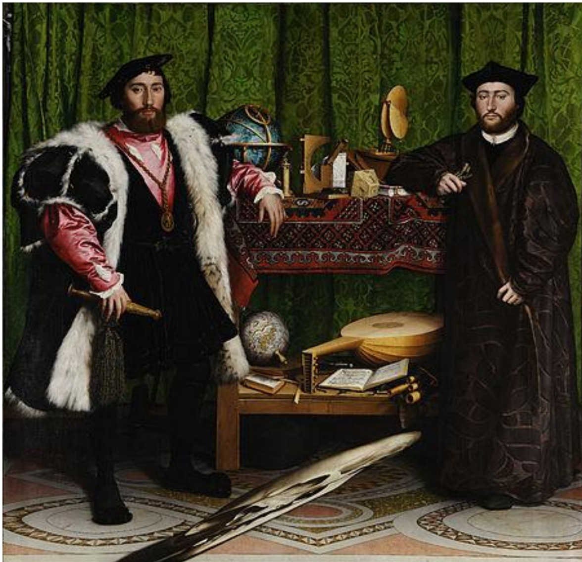
Image 1. Hans Holbein le jeune, Les ambassadeurs , 1533, huile sur bois, 208x209 cm, National Gallery, London.

Plusieurs objets sont disposés autour des personnages et servent à les caractériser de façon symbolique. Toutefois, une aberration occupe la partie inférieure du tableau : une tache blanche difforme qui semble être un défaut de peinture. Pourtant, la personne qui observe a la possibilité de déchiffrer la composition anamorphotique en prenant en compte le dispositif spécifique de visualisation contenu dans ce tableau. Celui-ci est décrit de la façon suivante par Baltrušaitis :