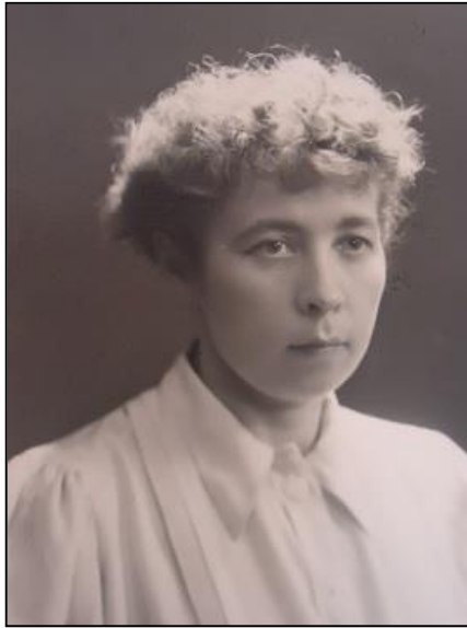
Ilse Losa en 1949, année de publication de son premier ouvrage, O Mundo em que vivi .

- Certains critiques disent que l'écriture intimiste et existentialiste de Ilse Losa est due à ses origines juives et à sa condition d'immigrée. Est-ce que vous croyez que ces expériences ont influencé l'écriture de votre mère, l'imprégnant d'une autre perception du monde ?