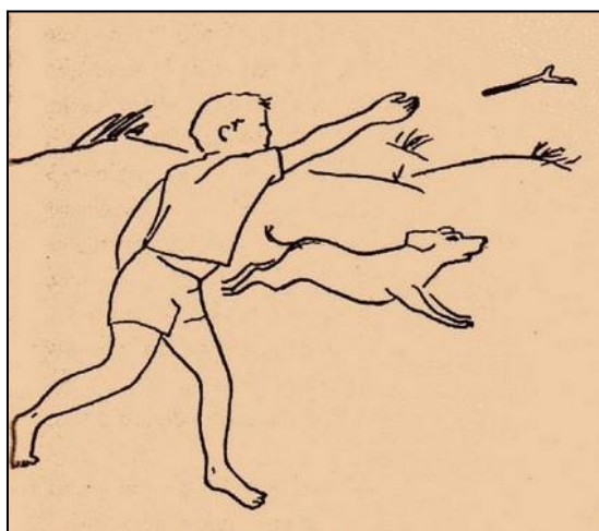
Illustration de Alexandra Losa pour l'édition de poche de l'ouvrage de sa mère : Um Artista chamado Duque (1966). Illustration de la couverture de Sebastião Rodrigues.