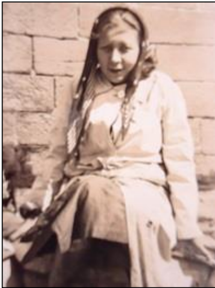
Ilse Losa à Esposende, 1938, habillée avec des vêtements typiques de la campagne.

parle pas de ses romans, de ses contes et de ses chroniques, cela lui faisait beaucoup de peine.