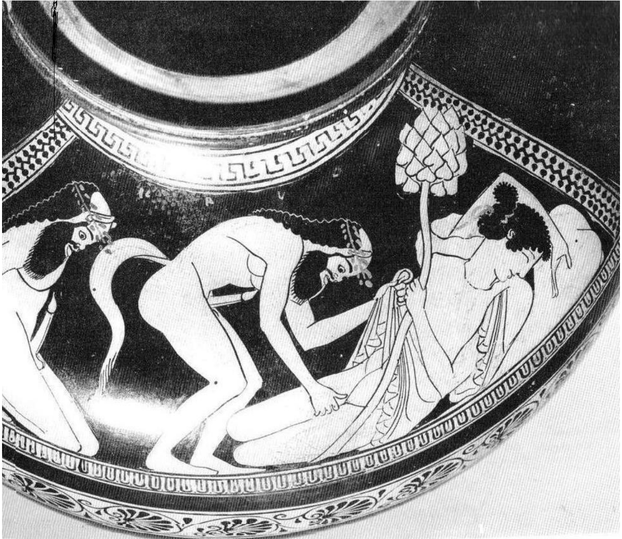
Annexe 3 : Hydrie attique, ca 500 av. J.-C., Ménade endormie