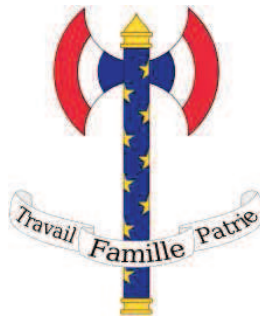
Figure 5 1 : La Francisque stylisée, qui emprunte autant à l'arme des Francs qu'aux faisceaux des lecteurs

également dans ces mots les protestations de Maurice Barrès face aux théories des intellectuels dreyfusards à propos de la nationalité, auxquelles il préférait la réalité matérielle représentée par la terre et les morts. La Révolution nationale remonte jusqu'aux premiers Francs pour définir un temps et un espace qui lui paraissent à même de réellement structurer l'âme française. L'adoption de la francisque, à la fois comme emblème de l'Etat français et comme décoration officielle du Régime de Vichy, témoigne de ce regard tourné vers le passé.