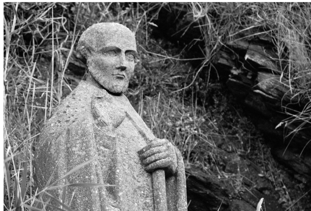
Statue représentant le 'Sage' Gildas en Armorique 37 .

Si l'on doit croire l'histoire racontée indirectement par Gildas, dans son De Excidio et conquestu Britanniae (De la ruine et la conquête de Bretagne) écrit avant 550, les Bretons furent abandonnés par les forces militaires, et laissés seuls pour affronter les attaques de leurs voisins pictes ; ils auraient alors demandé de l'aide aux Saxons, des mercenaires enrôlés dans les légions romaines depuis longtemps déjà : ils leur seraient venus en aide, puis trouvant la place libre, ils les auraient occupés à leur tour (Saul, 27-28). Ce schéma est banal dans l'histoire mondiale, et les prédicateurs chrétiens ont pu donner de la mésaventure une leçon moralisatrice ; les Gaëls d'Écosse catholiques ont reçu la même leçon de pasteurs presbytériens lors de la longue période des évictions tout au long du XIX e siècle.