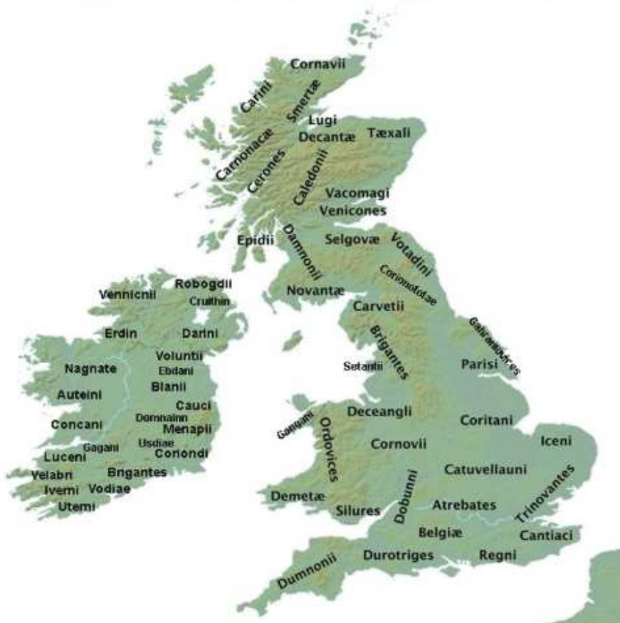
Exemple de cartes ethnologiques héritées de la période romaine 20 .