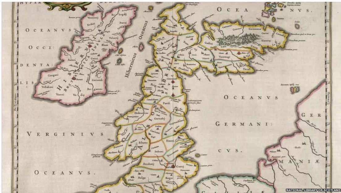
Copie de la carte de Ptolémée produite au II e siècle, alors que les Romains avaient colonisé Britannia et en exploitaient les ressources 21 .

dont le géographe grec Claude Ptolémée devait donner, au II e siècle, une énumération pour nous assez vide de sens (...) – dix-sept au total. (Duchemin, 39).