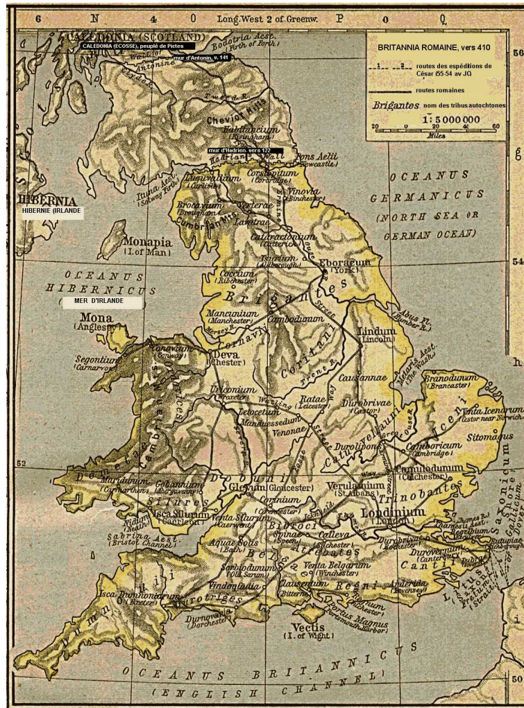
Britannia sur les cartes illustrant les cours d'histoire 30 .