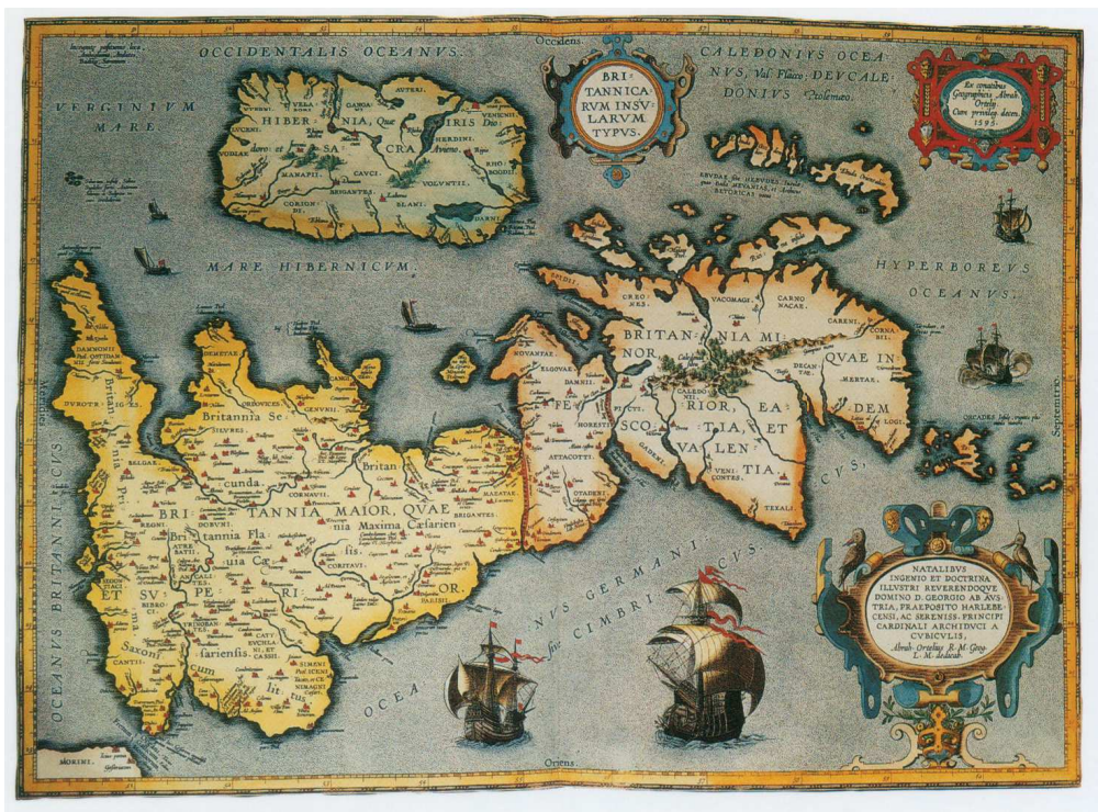
Carte de l'archipel britannique tel que le connaissaient les Romains 25 .

La conquête romaine s'était provisoirement arrêtée au seuil des collines des Cheviots, frontière naturelle entre l'actuelle Angleterre et l'Écosse, quand Rome traversa de graves crises politiques (de 54 à 81). (Duchemin, 46).