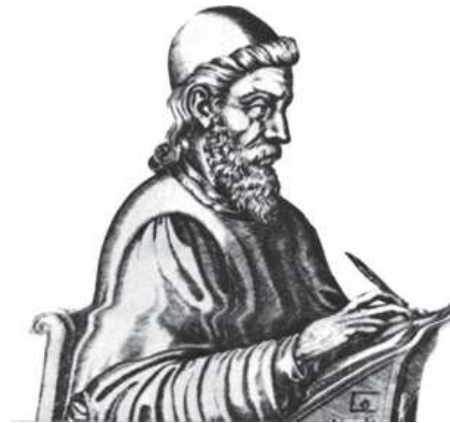
Représentation iconique du Vénérable Bède 38

historiens qui ont pu confirmer ou moduler les dires du moine lettré.