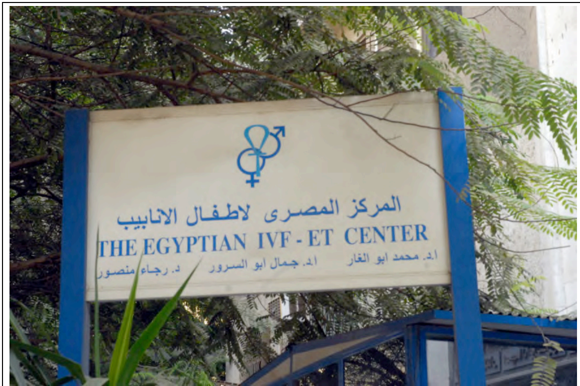
L'entrée du Centre FIV

Ci-dessous, quelques photos du Centre FIV, des fondateurs et de l'équipe médicale.