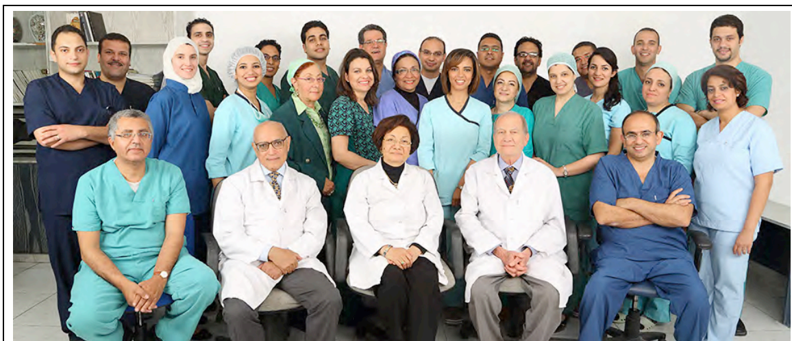
L'équipe médicale (2013)