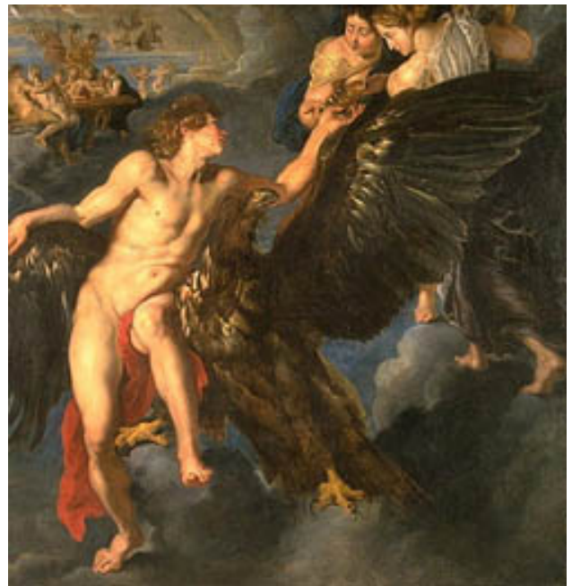
24. Rubens, Rapt de Ganymède , 1611-1612