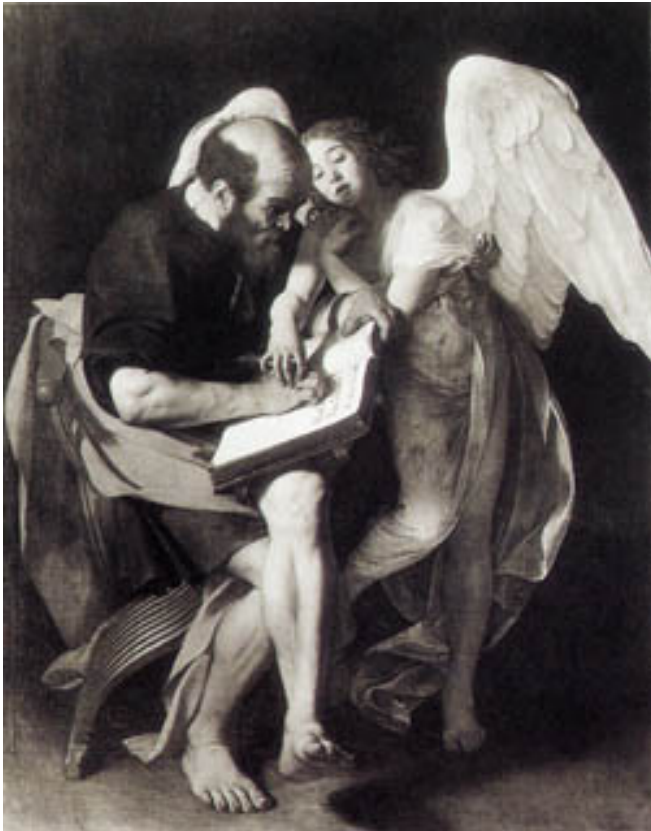
21. Caravaggio, Saint Mathieu et l'ange , 1598, (détruit)