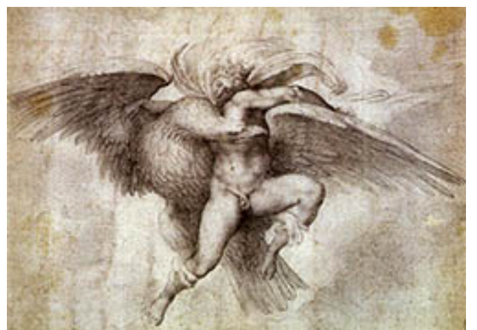
16. Michelangelo, Zeus et Ganymède , copie d'après l'original, 1532, Pencil Royal Collection, Windsor Castle