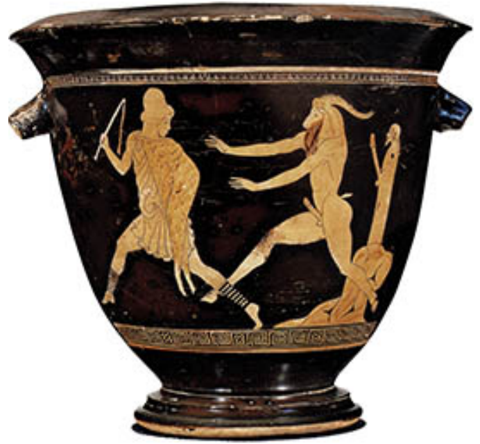
06. Pan poursuivant un jeune pâtre , vers 470 AEC