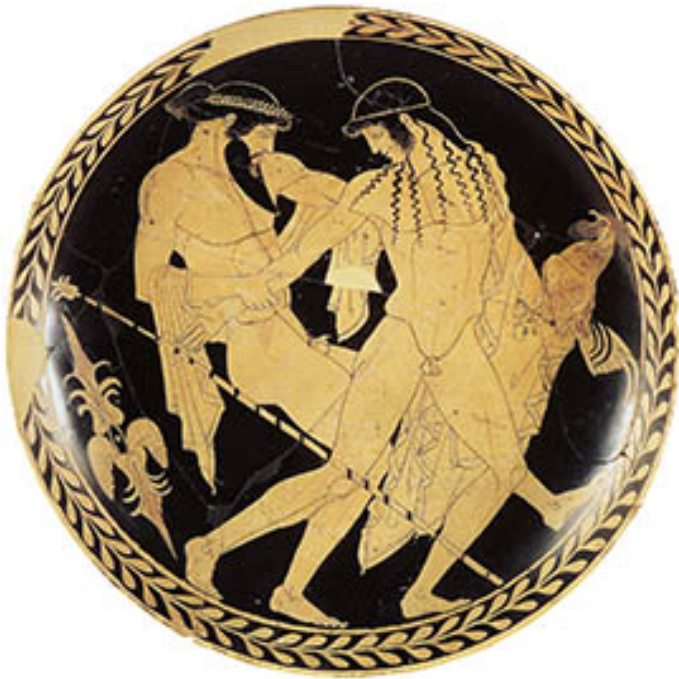
05. Le rapt de Ganymède , vers 530-430 AEC