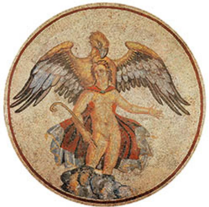
12. Jupiter enlève Ganymède, mosaïque, 1 er siècle AE