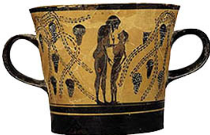
03. Éraste courtisant un éphèbe , vers 250 AEC