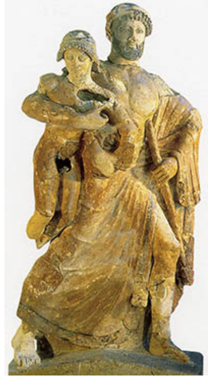
02. Zeus et Ganymède , vers 470 AEC, terre cuite peinte