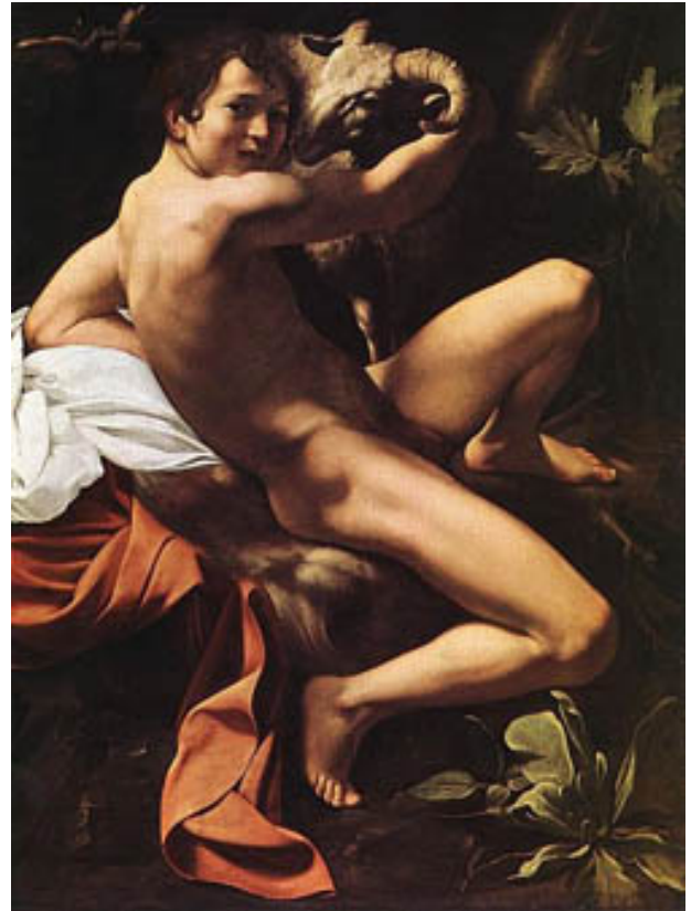
22. Caravaggio, Saint Jean Baptiste , 1602