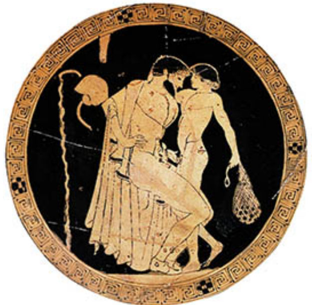
04. Peintre de Brygos, Éraste en action avec un éphèbe , vers 480 AEC