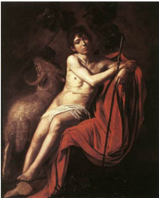
23. Caravaggio, Saint Jean Baptiste , Galleria Borghese, Rome