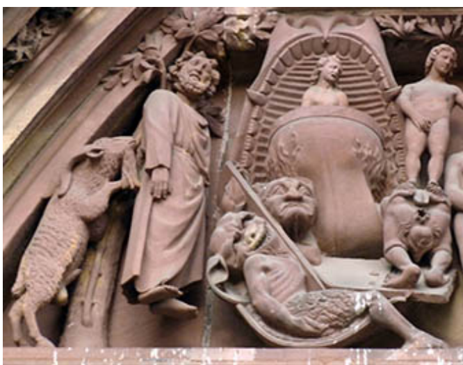
15. Tympan du portail central de la Cathédrale de Strasbourg « de la Vierge et des prophètes », détail : l'image de l'enfer et Gamil Blosarch