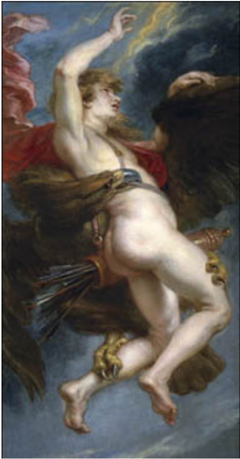
25. Rubens, Rapt de Ganymède , 1636-1637