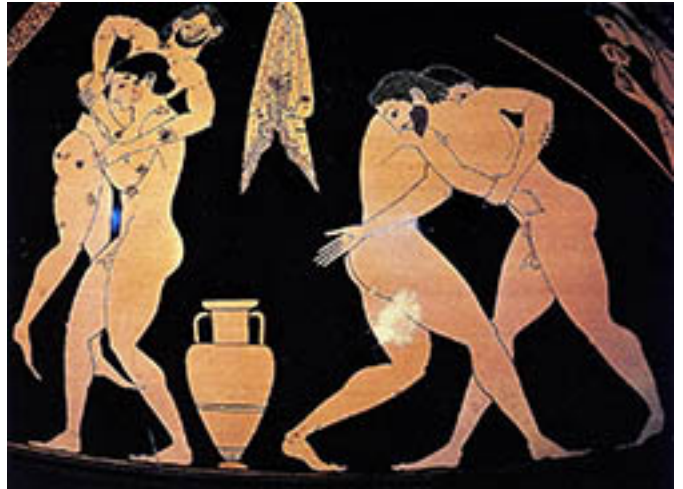
10. Attribué à Andokides, Lutteurs , amphore attique, vers 525 AEC