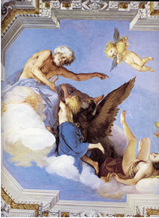
01. San Giovanni, Giovanni da, Zeus chasse Hébé , 1631