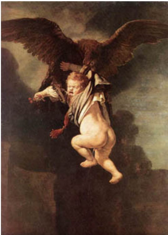
19. Rembrandt, Harmenszoon van Rijn, Enlèvement de Ganymède , 1635, Gemäldegalerie alte Meister, Dresden