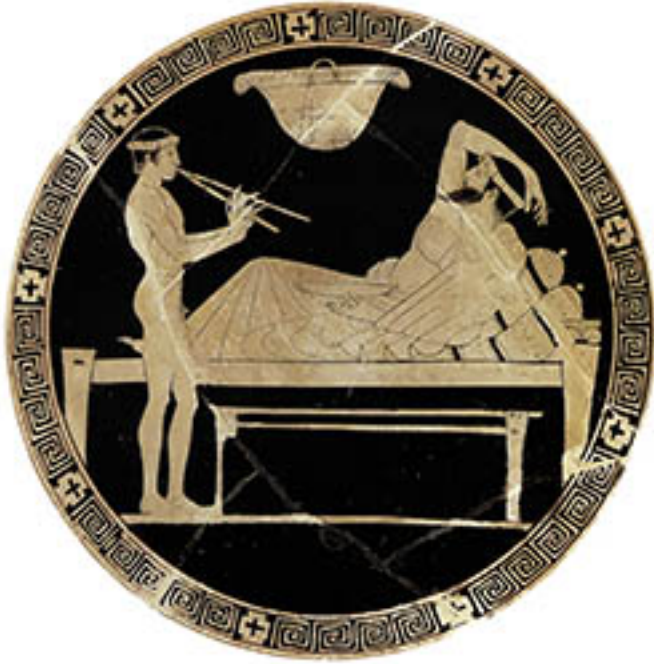
09. Attribué à Euaion, Érasme et jeune musicien , vers 460 AEC