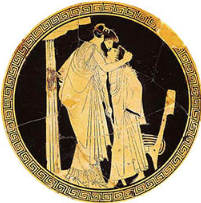
07. Peintre de Briseis (attribué au), Éraste embrassant son éromène , médaillon d'une coupe attique à figures rouges, vers 480 AEC