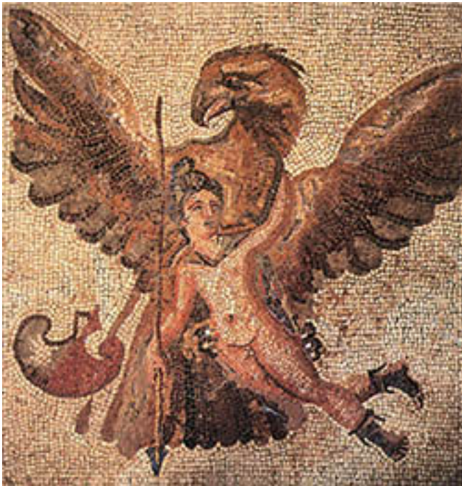
11. Zeus et Ganymède, mosaïque, 3e siècle AEC