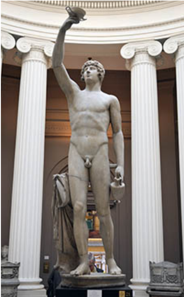
13. Antinoüs , vers 130-138 AEC (avec des ajouts au 18 e siècle)