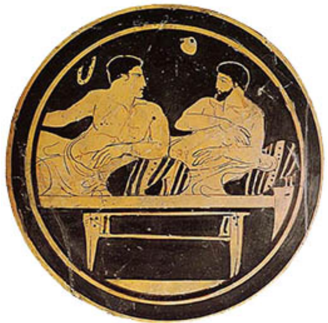
08. Homme et éphèbe conversant , coupe attique à figures rouges, vers 420 AEC