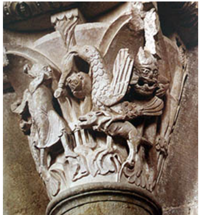
14. Anonyme, Enlèvement de Ganymède , 1096-1137, Église Sainte-Madeleine, Vézelay, France