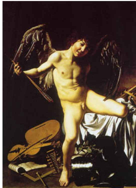
20. Caravaggio, L'amour vainqueur , 1598-1599, huile sur toile