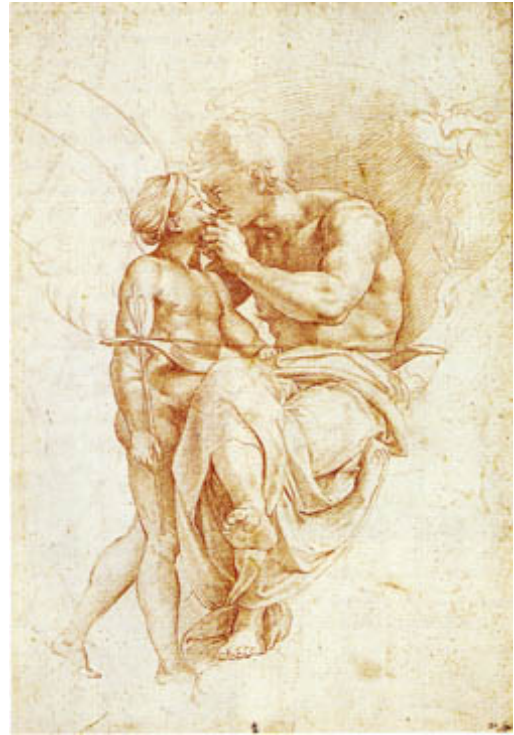
18. Atelier de Raphaël, Jupiter embrassant Ganymède , 1541, sanguine