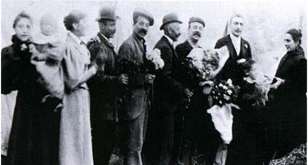
Photo prise lors du baptême de Louis Destouches