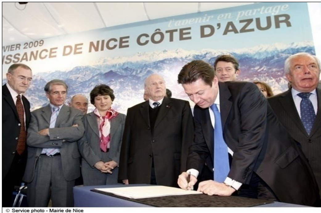
Signature de la « Charte de fonctionnement » de la nouvelle communauté urbaine par Christian ESTROSI, maire de Nice et président de la communauté d'agglomération Nice Côte d'Azur, 9 janvier 2009.

Cette mise en scène presque théâtrale participe d'une stratégie d'afficher aux yeux du public une entente qui règnerait entre les maires. Il s'agit d'entériner devant la presse les décisions prises bien avant par les maires. La charte intercommunale incarnerait « la joie d'être ensemble » et viendrait conforter l'entre soi en vigueur dans les conseils communautaires. En publicisant la signature de la charte intercommunale, les maires-conseillers communautaires veulent montrer à leurs administrés qu'il existe des liens forts entre eux et l'institution qu'ils « habitent ». Face aux opposants à la nouvelle institution, ils veulent démontrer publiquement son bien-fondé. Une forme de religiosité entoure la signature de la charte car il faut susciter « la croyance dans la légitimité de l'institution ». 266 Il s'agit pour chaque acteur politique de montrer qu'il veut appartenir à l'institution, qu'il veut « s'inscrire dans la chorégraphie que propose l'institution, qu'il puisse faire corps avec le corps collectif » 267 . Mais il serait imprudent de se cantonner à cette seule publicisation de la charte. Cette dernière est en réalité le résultat des rapports de force entre maires :