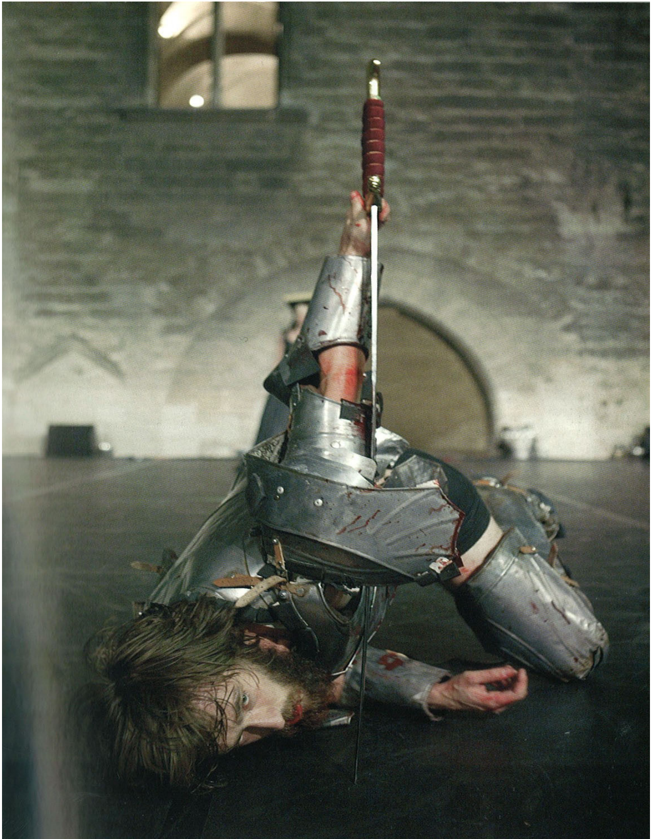
Un chevalier dans Je suis sang , Avignon 2005