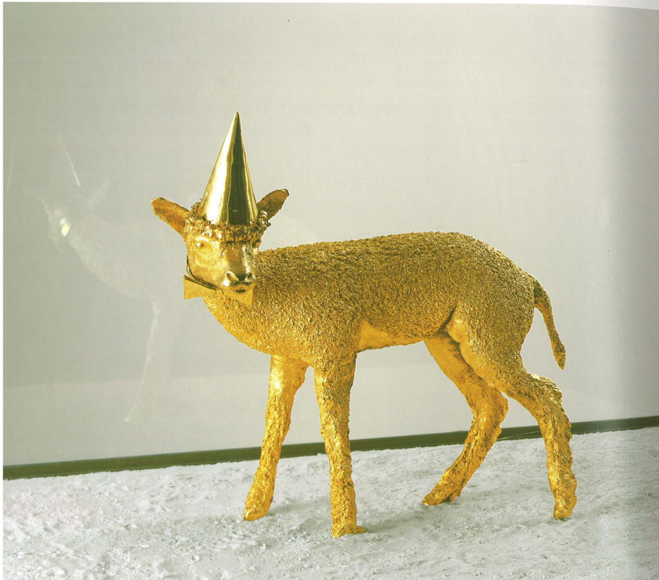
Sanguis sum , 2001

Les œuvres de Jan Fabre illustrant une esthétique christologique Sanguis Sum – L'Ange de la métamorphose, Musée du Louvre, 2008