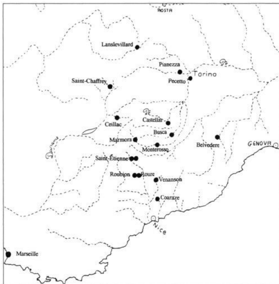
Carte des cycles narratifs conservés (par lieu de provenance)