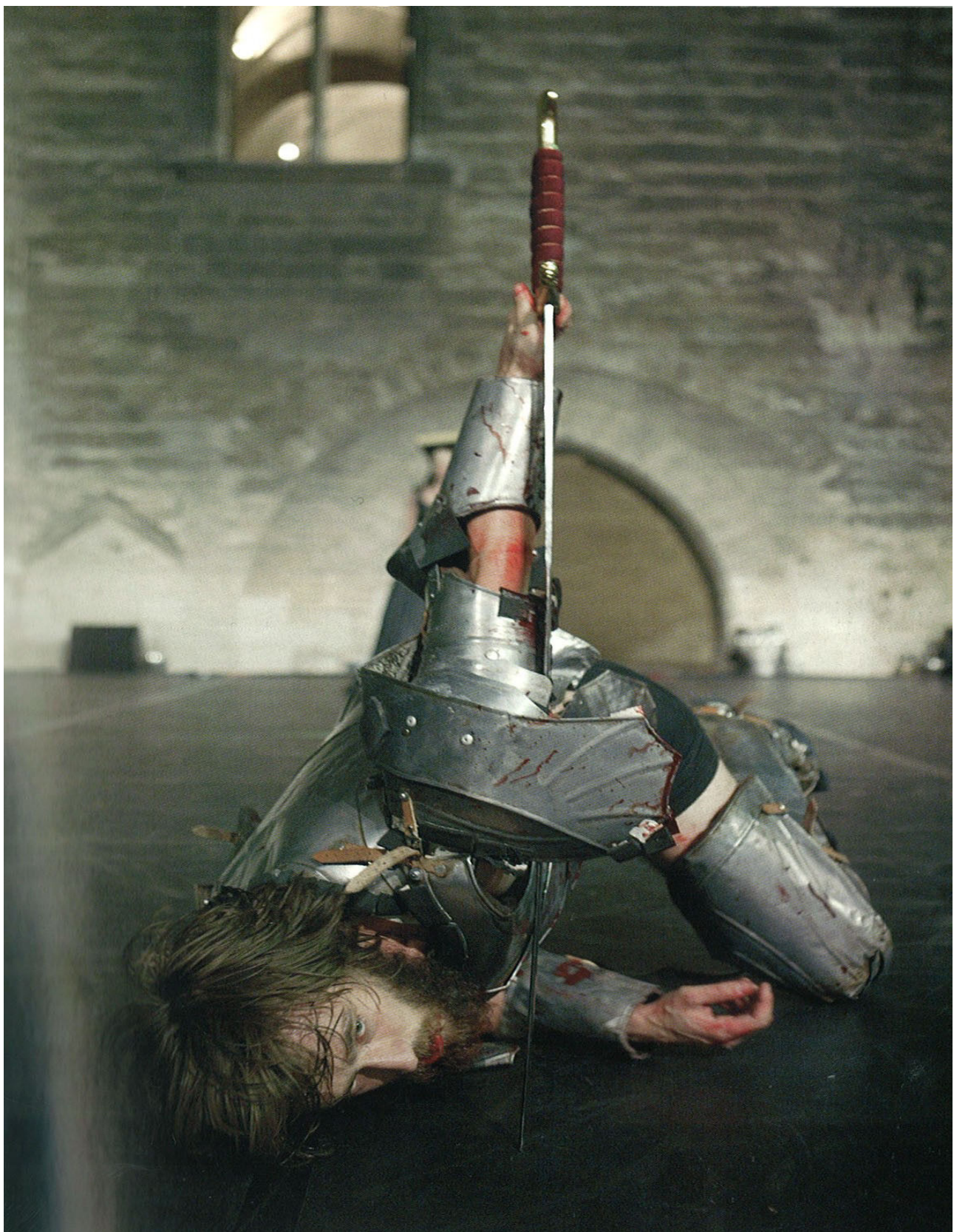
Un chevalier dans Je suis sang , Avignon 2005