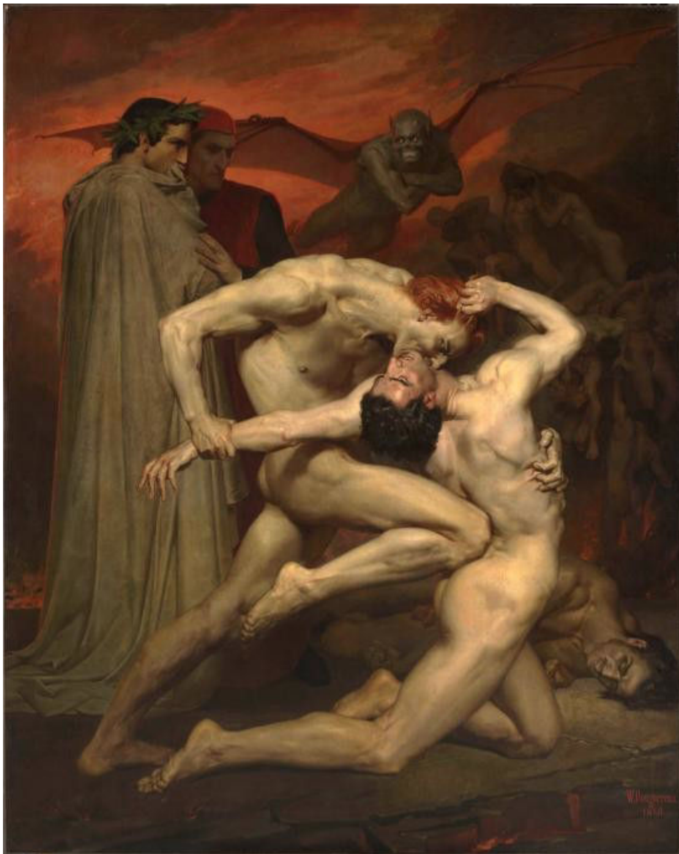
Illustration 6 : Dante et Virgile de Bougereau