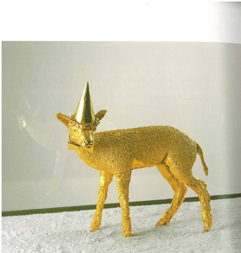
Sanguis sum , 2001

Les œuvres de Jan Fabre illustrant une esthétique christologique Sanguis Sum – L'Ange de la métamorphose, Musée du Louvre, 2008