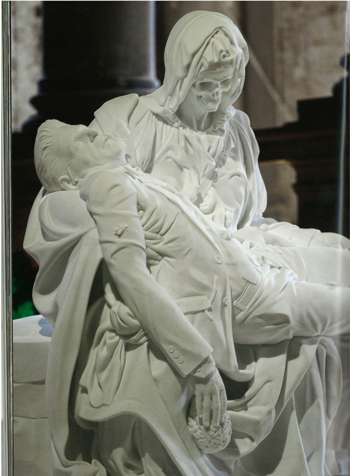
Pietas V , l'une des 5 pièces composant l'installation Pietas , Biennale de Venise 2007