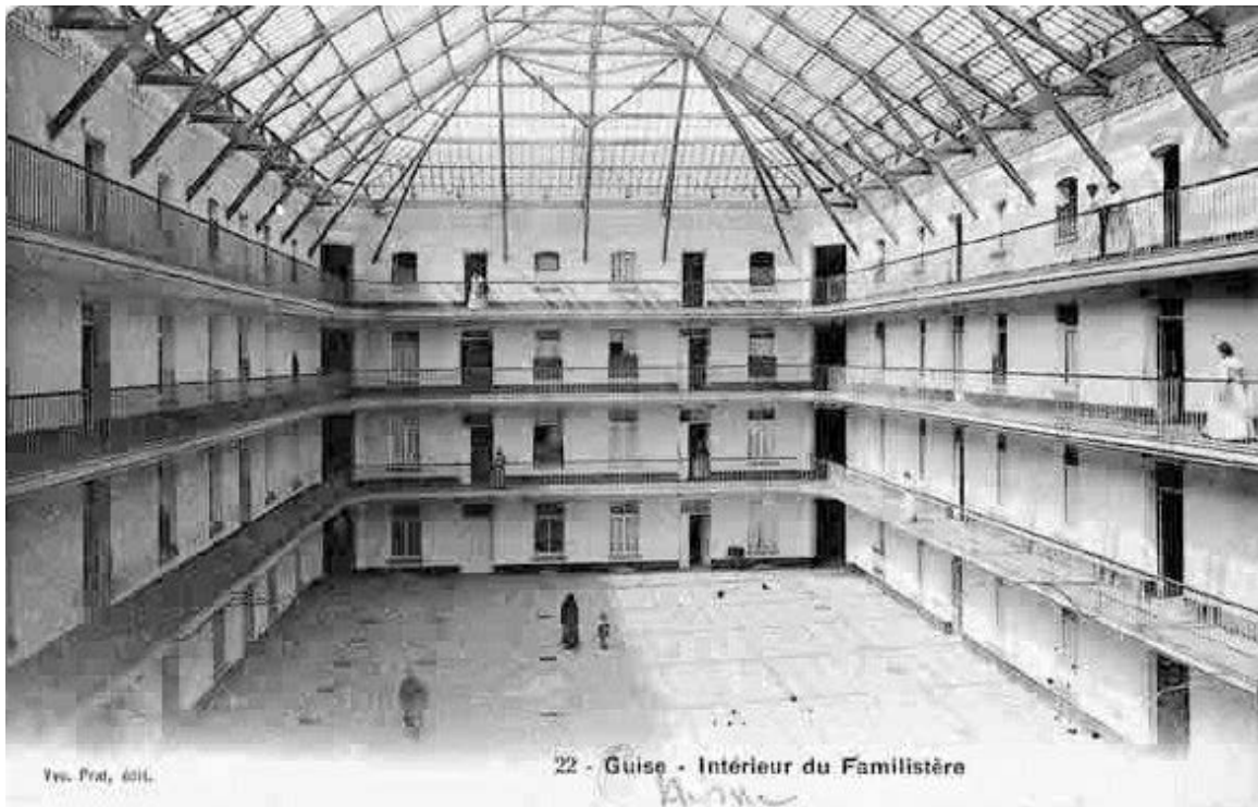
* Familistère de Guise (Jean-Baptiste Godin)