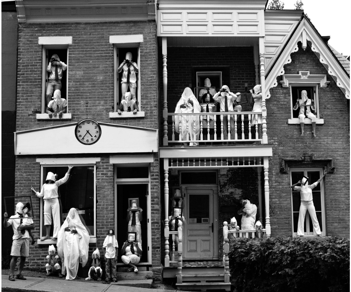
Rue Saint-Urbain, Montréal, juillet 2010. Par Marie-Ange Cossette-Trudel.

Projet photo « Utopie : critique et conceptualisation »