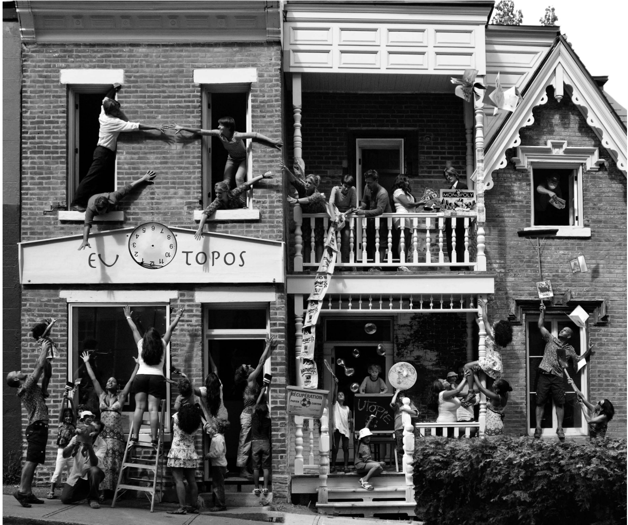
Rue Saint-Urbain, Montréal, juillet 2010. Par Marie-Ange Cossette-Trudel.

Projet photo « Utopie : critique et conceptualisation »