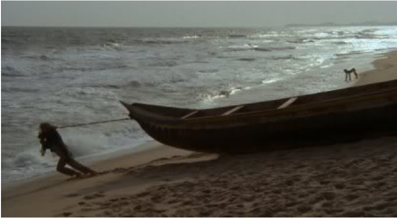
Werner Herzog, Cobra Verde 317

Un retour vers la question de l'affect s'impose, cette fois-ci non pas du côté des Érinyes 318 mais d'Oreste lui-même. C'est la direction à suivre étant non seulement ce qui, chez Oreste, est posé à l'extérieur mais ce qui a « à dire » sur la haine et sur la décharge possible par le crime.