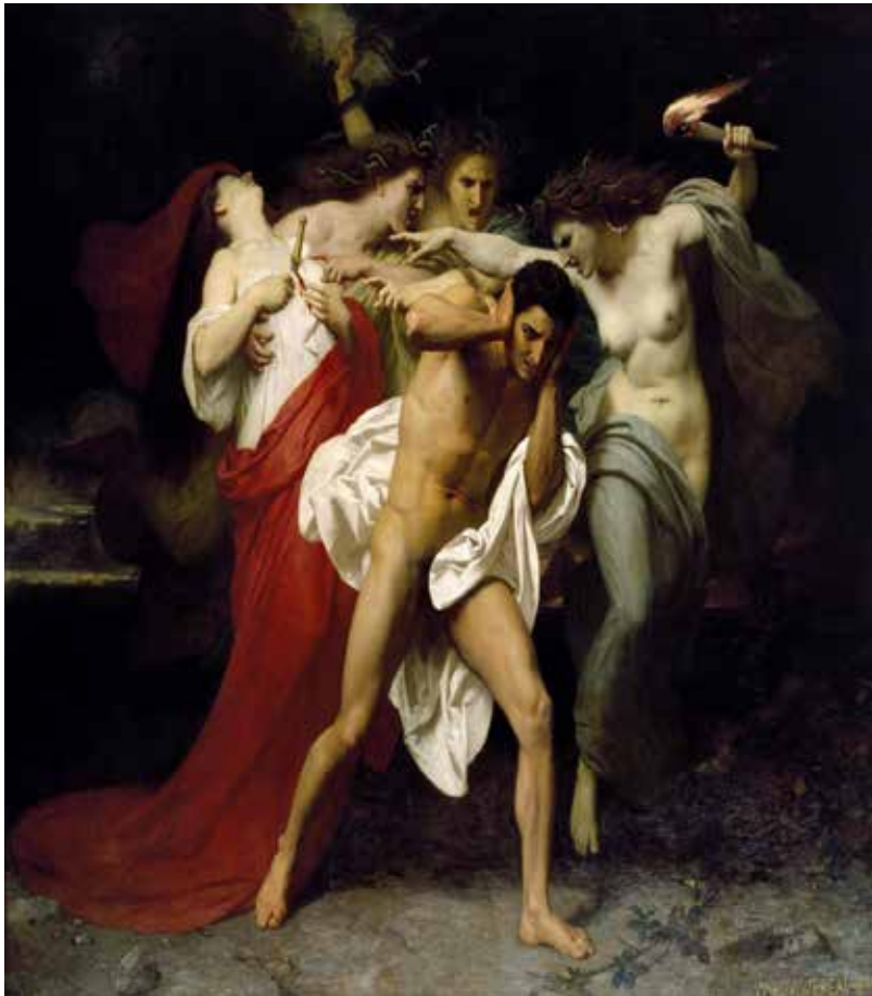
Les remords d'Oreste (1862) 158 , William-Adolphe Bouguereau.