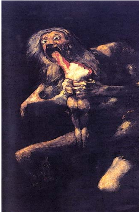
« Pinturas negras. Saturno devorando a un hijo » 193 . Francisco de Goya (1746-1828).