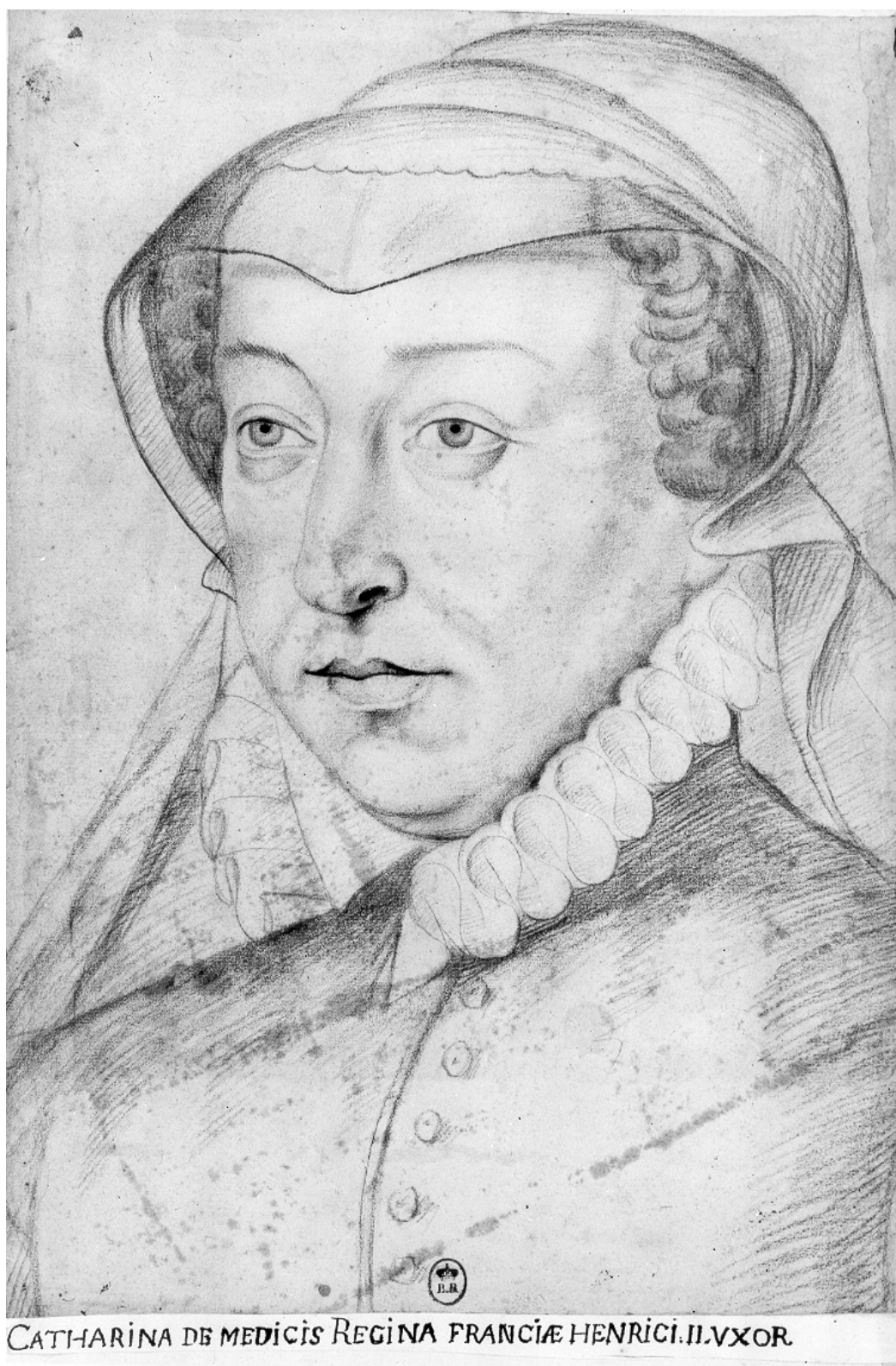
Catherine de Médicis : Dessin (XVI e s.), Bibliothèque nationale de France