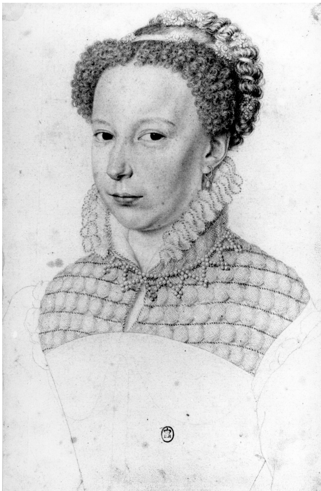
Marguerite de Valois : Dessin (vers 1571), Bibliothèque nationale de France