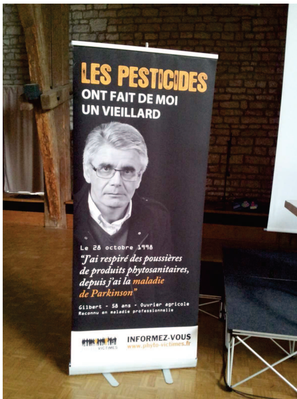
Assemblée générale de « Phyto-victimes », mai 2014, Dôle.