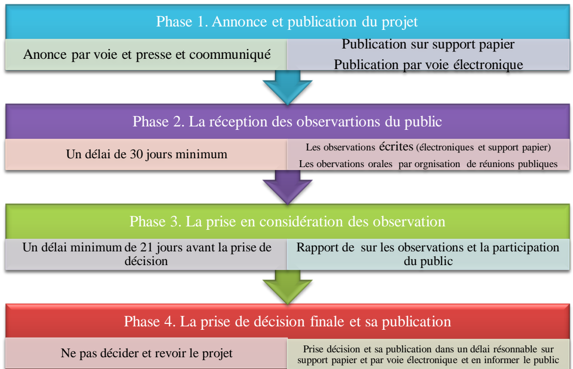
Tableau récapitulatif des différentes phases de la participation