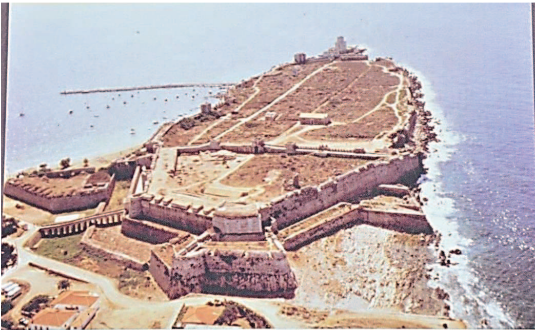
Γενική άποψη του κάστρου. General view of the castle.

V – Vue générale de la forteresse de Modon (Méthoni), affichée à l'entrée du site.