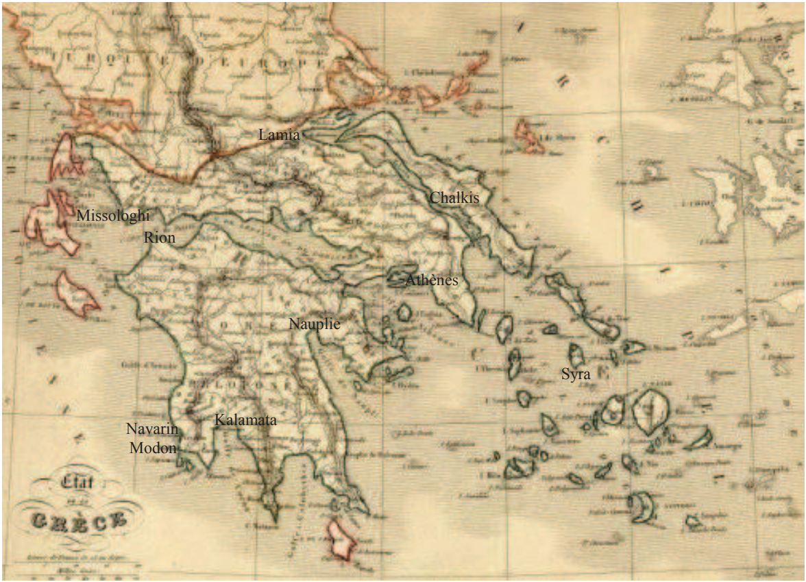
II – Le royaume de Grèce en 1843. Carte d’Alexandre Vuillemin.