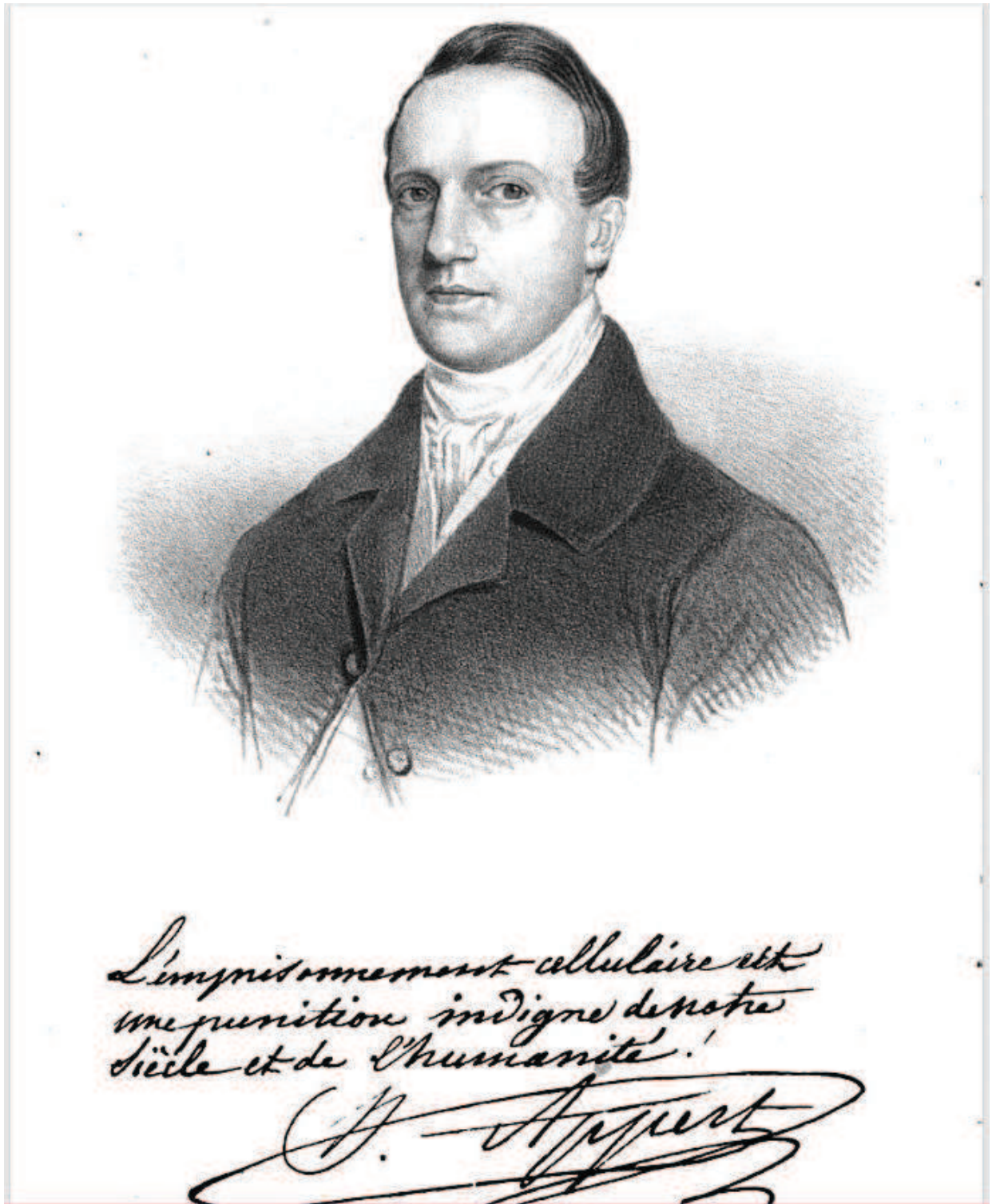
I – Portrait de Benjamin Appert. Voyage en Belgique , 1848.