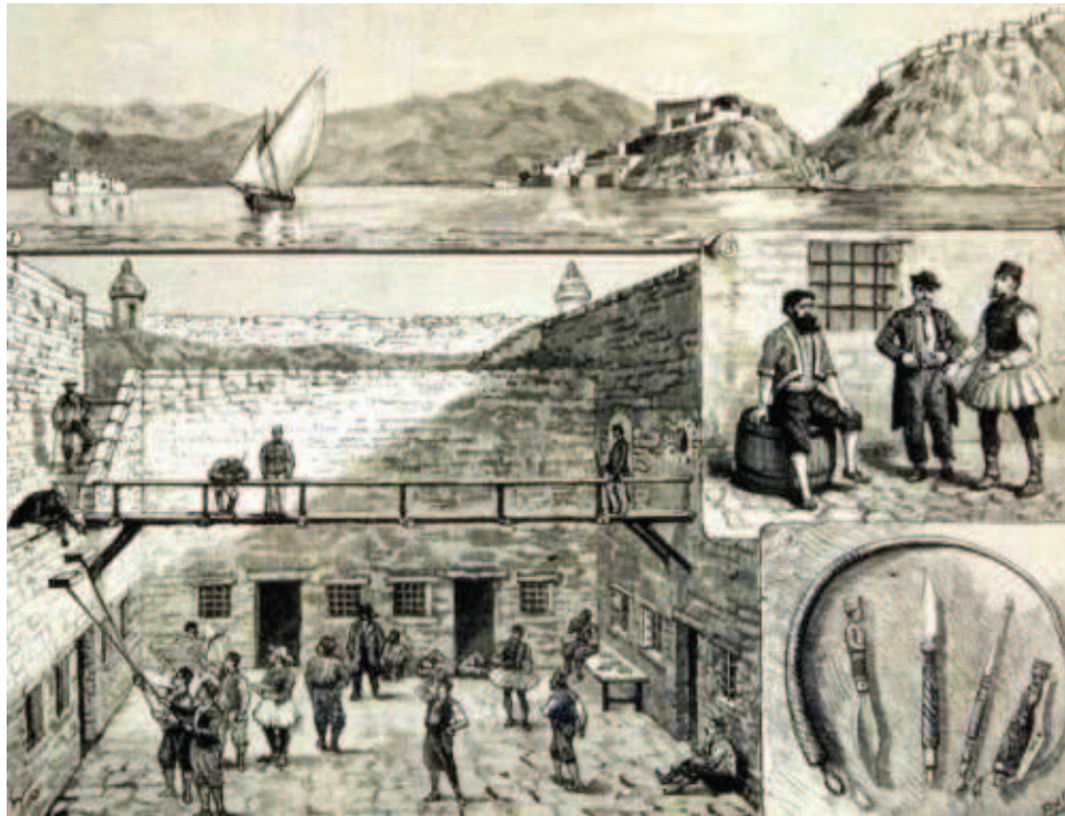
III – Le Palamède et le fort Miltiade. Gravure anonyme du XIX e siècle. (ΚΟΥΡΙΑ Αφροδίτη [KOURIA Aphroditi], Το Ναύπλιο των περιηγητών , Εμπορική Τράπεζα Ελλάδος)