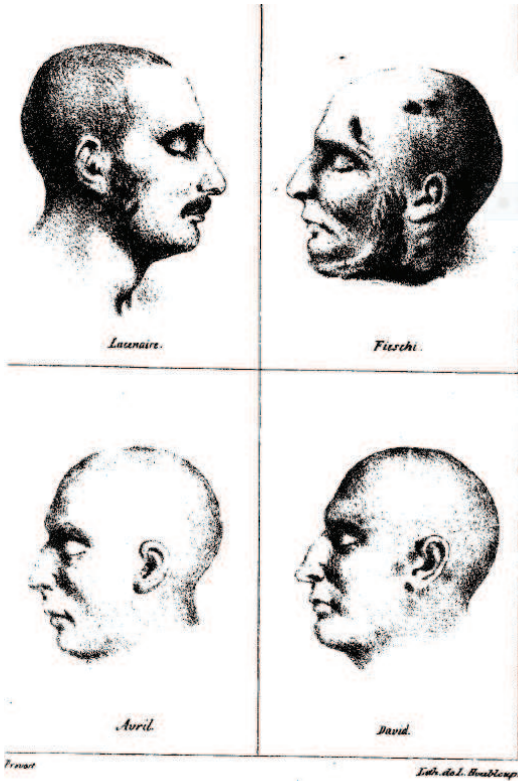
VII – Figures de criminels guillotines, lithographie, frontispice de Bagnes, prisons et criminels , vol. IV.