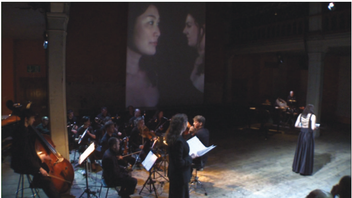
Illustration 34: LLA (Huggler), 52'20