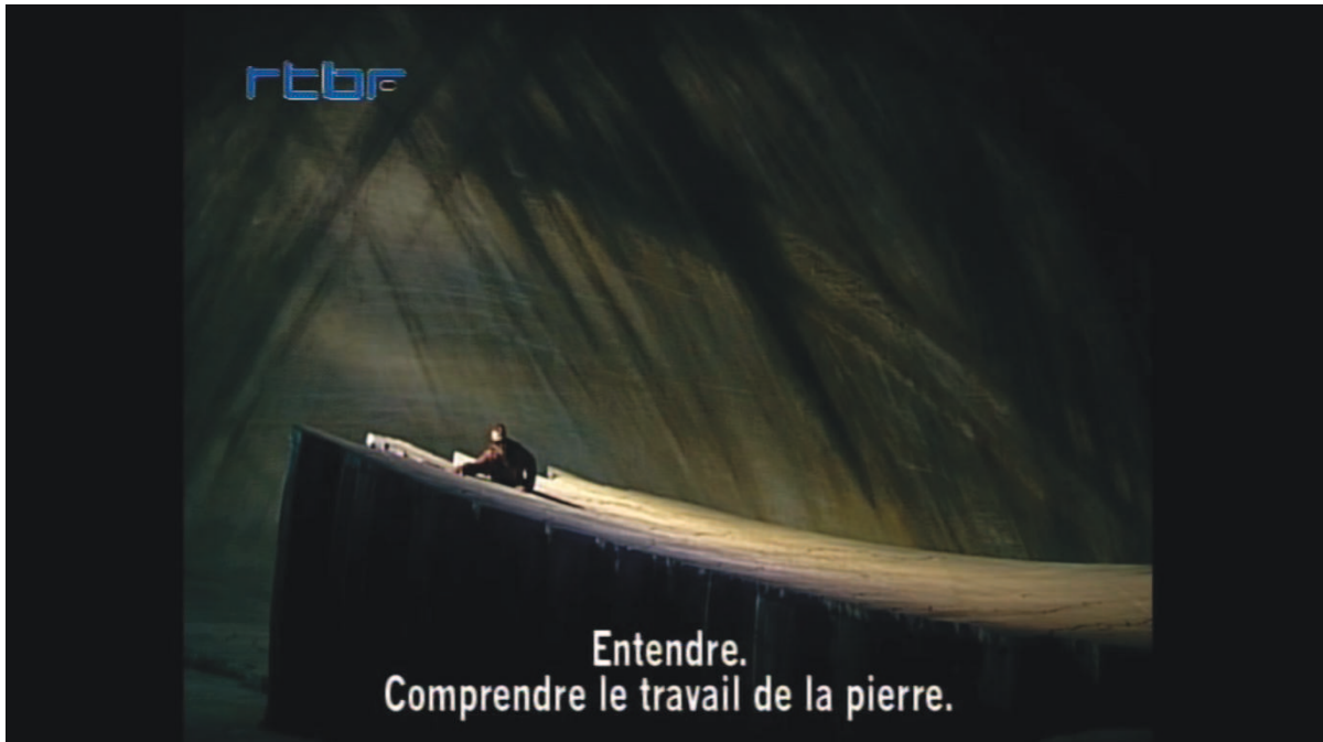
Illustration 12: ŒSR, DVD 1, 1'09'14

Les personnages reparaissent lors d'une deuxième séquence. À plusieurs reprises et à la faveur des intermèdes instrumentaux, le rideau masque le plateau comme autant de jours qui passent. Quand il se relève, les personnages, équipés de harnais, doivent escalader la falaise. Ils paraissent tout petits et fragiles en comparaison de l'ouvrage à accomplir. Enfin, après un dernier intermède, la sculpture de la vague est achevée [cf. illustration n° 13]. Cette fois, afin de suggérer l'acharnement et l'ampleur du travail – par sa taille mais aussi et surtout par l'importance symbolique du dépassement de soi qu'il permet – le faible éclairage campe une atmosphère nocturne.