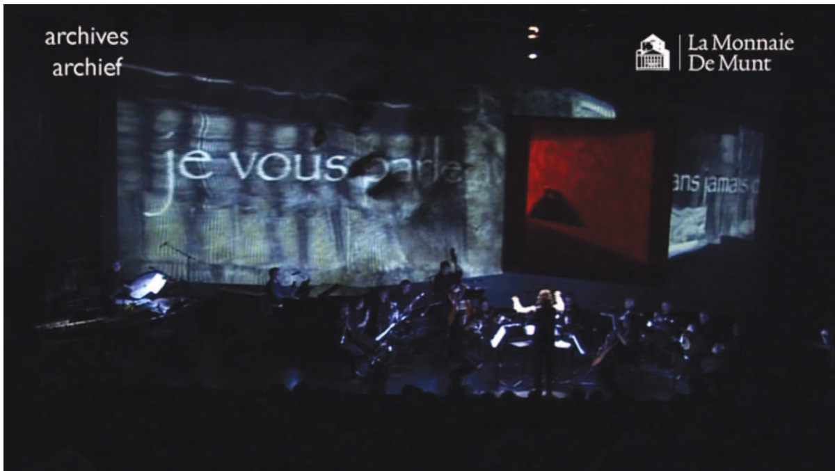
Illustration 29: LLA (Sireuil), 29'15