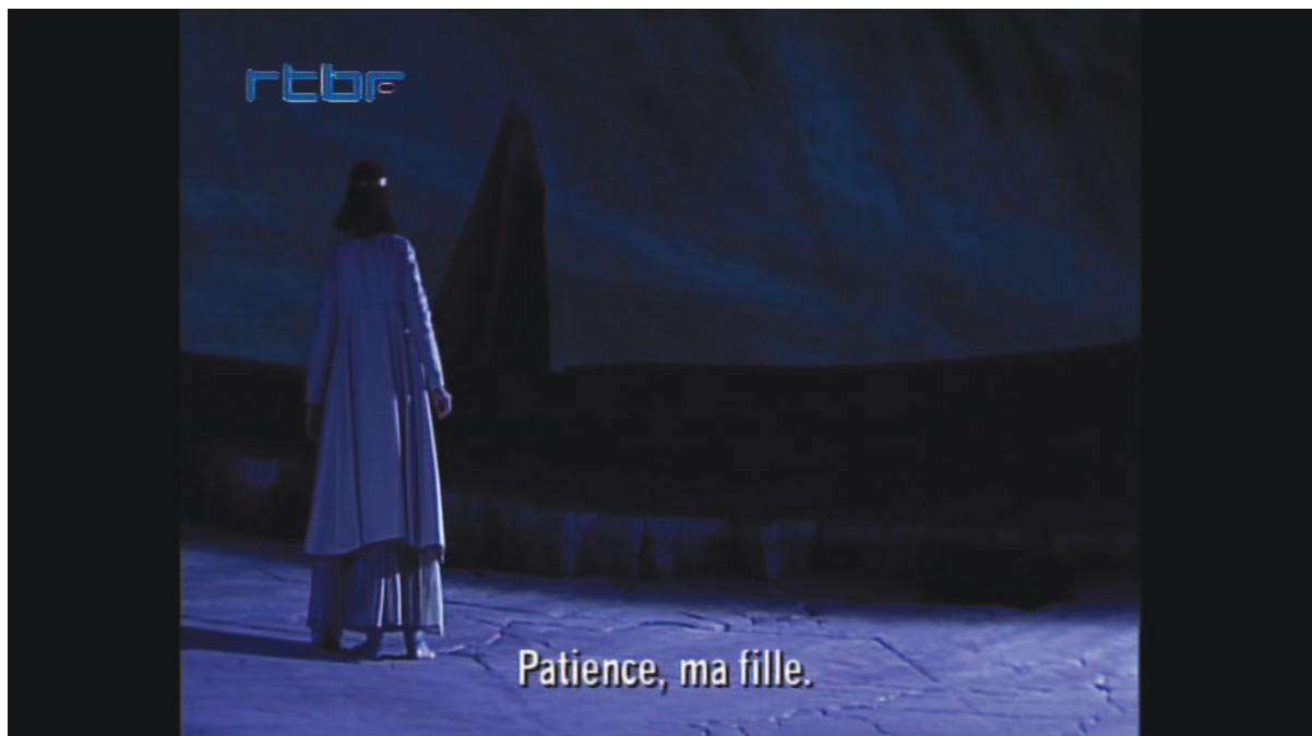
Illustration 23: ŒSR, DVD 1, 14'41

L'absence d'Œdipe pendant toute la deuxième moitié du deuxième l'acte crée, plus qu'un sentiment de solitude, une image de la force du personnage face à la dureté de la matière écrasante de la falaise. Par contraste, le remplissage final a valeur d'accomplissement, d'apaisement dans une image de complétude.