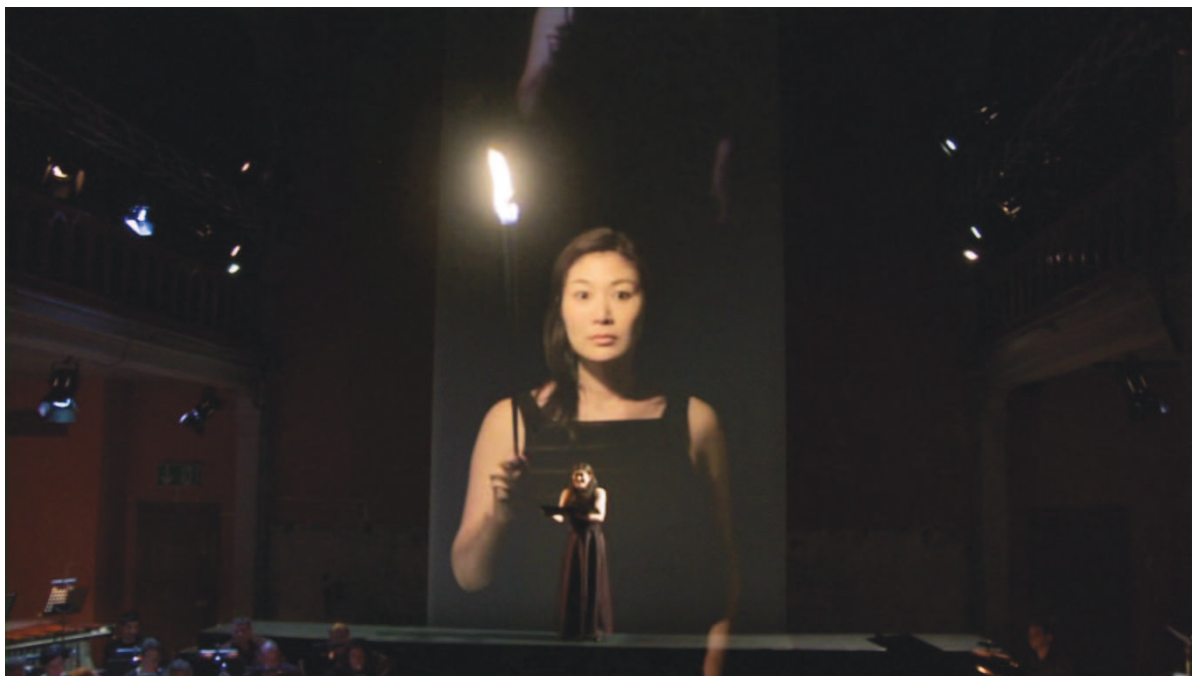
Illustration 37: LLA (Huggler), 1'18'44

Ensuite elles permettent d'affirmer péremptoirement l'inscription de la représentation, c'est-à-dire concrètement la soirée du concert, dans un flux historique manifestement unidirectionnel – le recours à l'ordre chronologique suggéré par le livret est strictement respecté – de haranguer l'auditeur-spectateur. La poésie du texte et son aura musicale sont en quelque sorte suspendue, mise à distance, afin que soit entendue pour elle-même la parole d'Antigone. Les images filmées s'adressent directement à la conscience du spectateur ou son imaginaire. Leur disposition en arrière plan, en particulier quand les chanteuses se trouvent sur le podium [cf. illustration n° 37], en fait des produits de l'imaginaire des personnages. Cela permet à la « lumière » d'Antigone de véritablement briller dans l'esprit du public qui n'aurait consenti qu'à venir entendre une partition de musique contemporaine et perturbe durablement l'acquiescement du même public devant la division sexuée du monde.