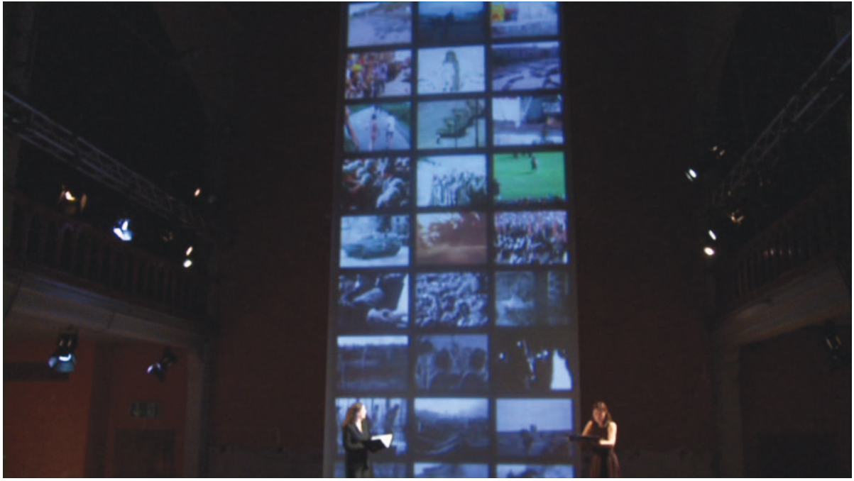
Illustration 35: LLA (Huggler), 1'15'28