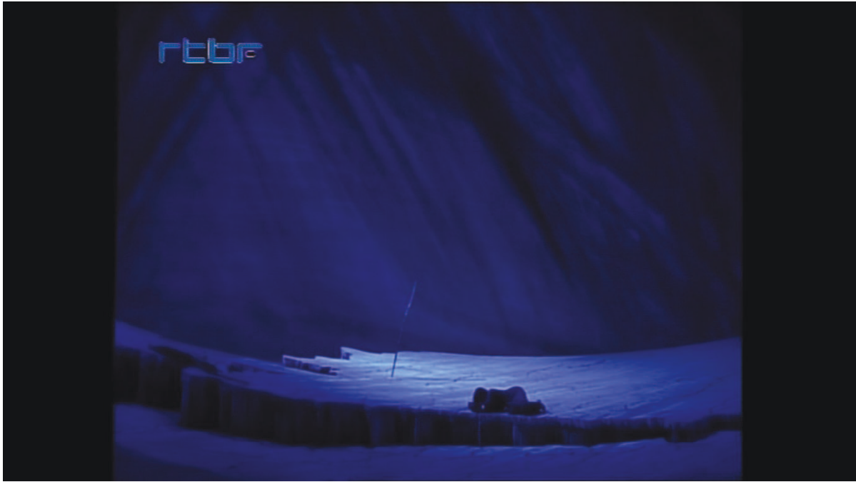
Illustration 17: ŒSR, DVD 2, 53'31

Œdipe part devant, Antigone le suit de loin, séparée de lui par le rideau qui la coince, comme au premier acte, à l'avant-scène. Ce retour de motifs liminaires et l'effet de circularité qu'il produit signale la résolution finale. Il agit aussi comme l'hallucination d'un déjà-vu, conséquence de l'obstination épuisante de la route. Antigone plante des piquets dans le sol [cf. illustration n° 18] qui, le rideau relevé, s'allument comme des torches – faut-il y voir une anticipation tragique de son funeste destin ? – et strient le plateau à la manière d'un petit bois.