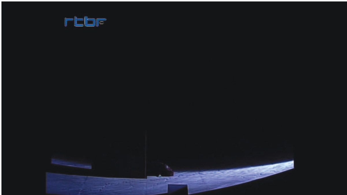
Illustration 1: ŒSR, DVD 1, 7'55

Œdipe est à Thèbes [cf. illustration n° 1]. Combien de temps s'est écoulé depuis la découverte du parricide et de la reconnaissance de Jocaste ? Rien ne permet de le déterminer. Seul, isolé même, Œdipe rêve qu'il lutte contre un aigle. Cette scène n'est pas sans rappeler la lutte de Jacob avec l'ange, une scène fondatrice pour Henry Bauchau 159 . Ce cauchemar suscite la décision du départ. Il part, suivi par Antigone qui mendiera pour lui [cf. illustration n° 2].