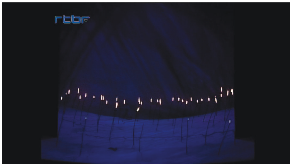
Illustration 21: ŒSR, DVD 2, 1'03'12

que sur ce que l'on sait déjà du personnage. Aucun repère précis ne renseigne sur le lieu de la scène – les remparts de Thèbes – et les mouvements saccadés des deux êtres qui s'affrontent accentuent l'aspect chaotique et cauchemardesque – la lumière ne permettant pas d'en dire davantage sur le cadre temporel – de cette scène d'ouverture qui renvoie à « l'errance de l'être dans un monde dont il ne perçoit plus ni les lois ni la structure disparue 416 ». Une observation que l'étude de la scénographie de Sireuil autorise à formuler, à l'aune de l'évolution ultérieure du plateau. Du premier au quatrième acte, la scène s'organise. Du chaos on s'achemine vers l'harmonisation.