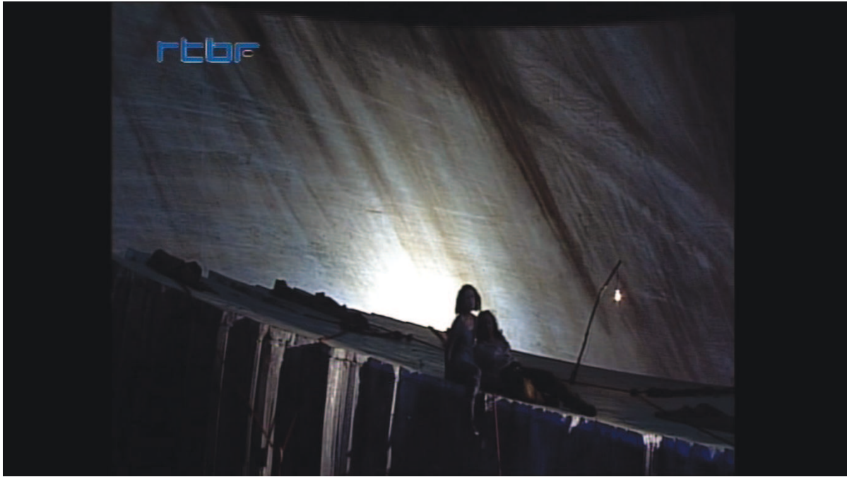
Illustration 13: ŒSR, DVD 1, 1'25'42

Contrairement aux deux précédents, le troisième acte est serein. Il s'ouvre dans une lumière rosée. L'élément imposant qui figurait auparavant la falaise a été abaissé à mi-hauteur. La victoire d'Œdipe sur la pierre a permis de résorber une partie de la violence que le personnage retient en lui. Mais le chemin vers la réconciliation intérieure n'est pas encore terminé. La scène se vide et la lumière se fait plus flamboyante [cf. illustration n° 14].