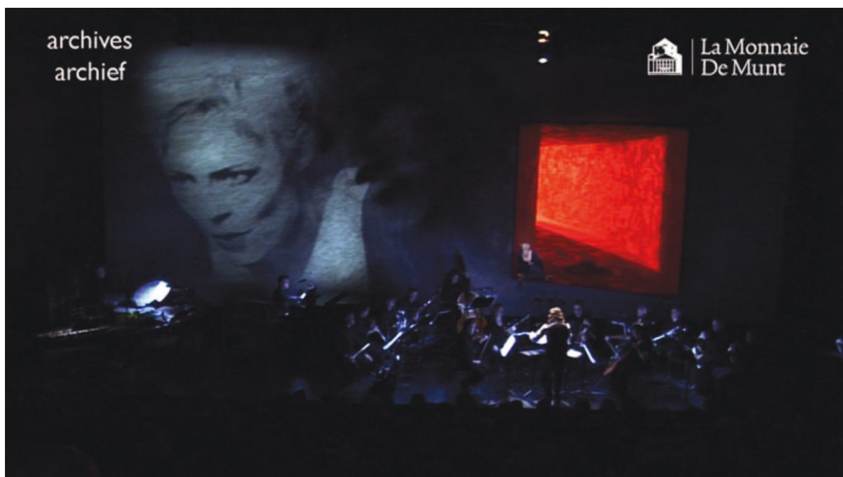
Illustration 25: LLA (Sireuil) , 21'12

Le caractère fantomatique de cette figure convient très bien au sujet de l'opéra. On peut en effet penser qu'il s'agit, par un procédé de mise en abyme, du personnage mythique d'Antigone que la voix permet de convoquer, de faire revenir – Antigone est une revenante – parmi nous. On a donc du figé et du mouvant, de la couleur et du noir et blanc : tout un ensemble d'oppositions distinctives qui fabriquent une écriture, une « archi-écriture » de l'espace – par les couleurs, les mouvements des corps – et du temps – par l'usage des images et les effets miroitants de la lumière qui forment autant de scansions, d'oscillations. De plus, parce que le sens ne se donne pas comme présence mais au contraire comme absence dans la mesure où, transporté d'un émetteur à un destinataire, il supplée à leur utopique rencontre. Ces oscillations de langage sont à la fois l'expression structurelle du thème de la revenance d'Antigone et la résultante nécessaire de la reconnaissance que l'unique possibilité d'advenue du sens se fait sur le mode de ce qui échappe.