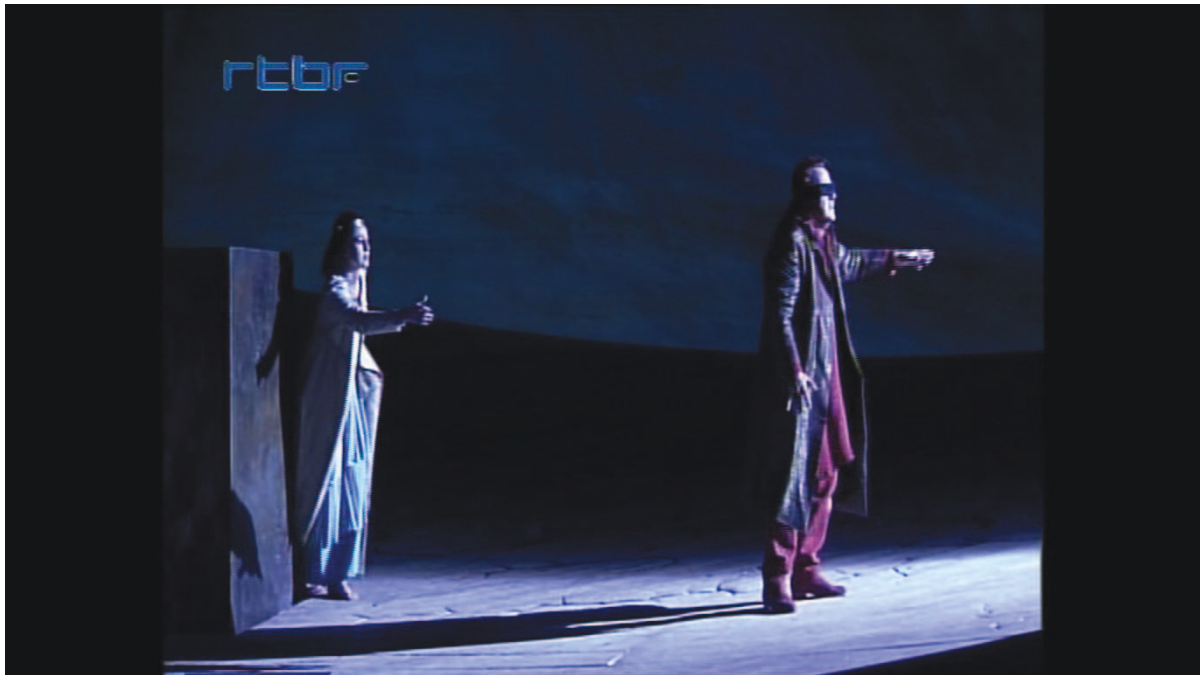
Illustration 2: ŒSR, DVD 1, 10'24

Épuisé par la route, Œdipe est secouru par Ilyssa qui lui donne de l'eau. Antigone arrive avec des raisins qu'un vigneron l'accuse d'avoir volés. Mais comme Ilyssa, le vigneron prend pitié de l'aveugle. Alors il le reconnaît :