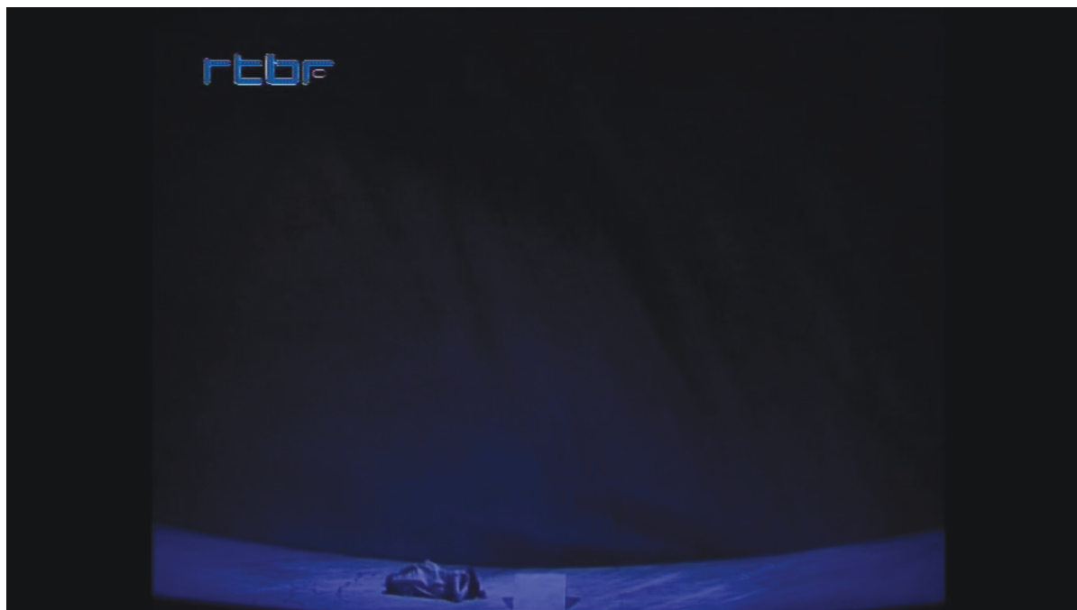
Illustration 10: ŒSR, DVD 1, 14'19

Le décor suit lui aussi le découpage narratif du livret. Le lever de rideau découvre d'abord un plateau quasi nu dont la surface est incurvée. Au milieu, un bloc fait office de pan de muraille. Le rideau s'abaisse de nouveau et vient cacher le changement de décor. Antigone se trouve alors isolée à l'avant-scène, coincée entre le rideau et la fosse, pour son monologue de colère. Le caractère contraint du départ d'Antigone est souligné par le resserrement de l'espace et l'absence consécutive de tout décor [cf. illustration n° 10].