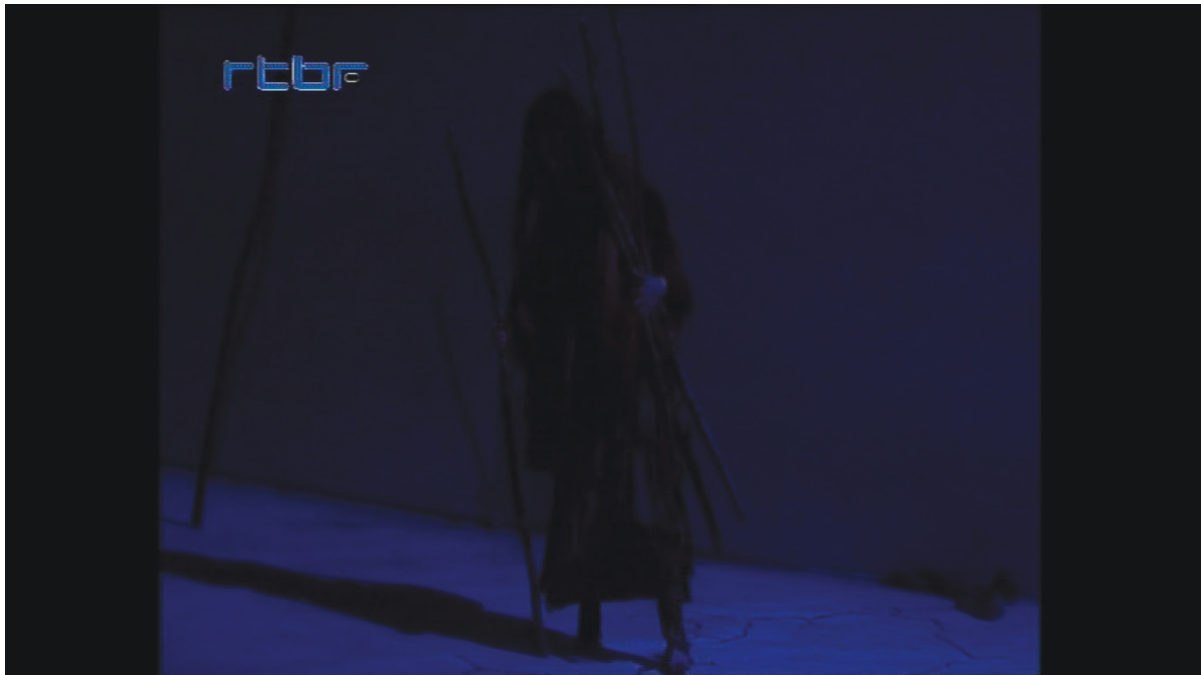
Illustration 18: ŒSR, DVD 2, 1'02'32