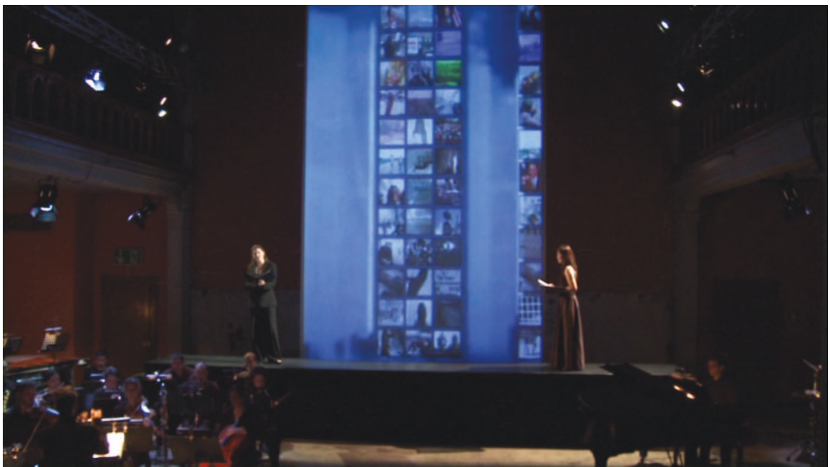
Illustration 36: LLA (Huggler), 1'17'04