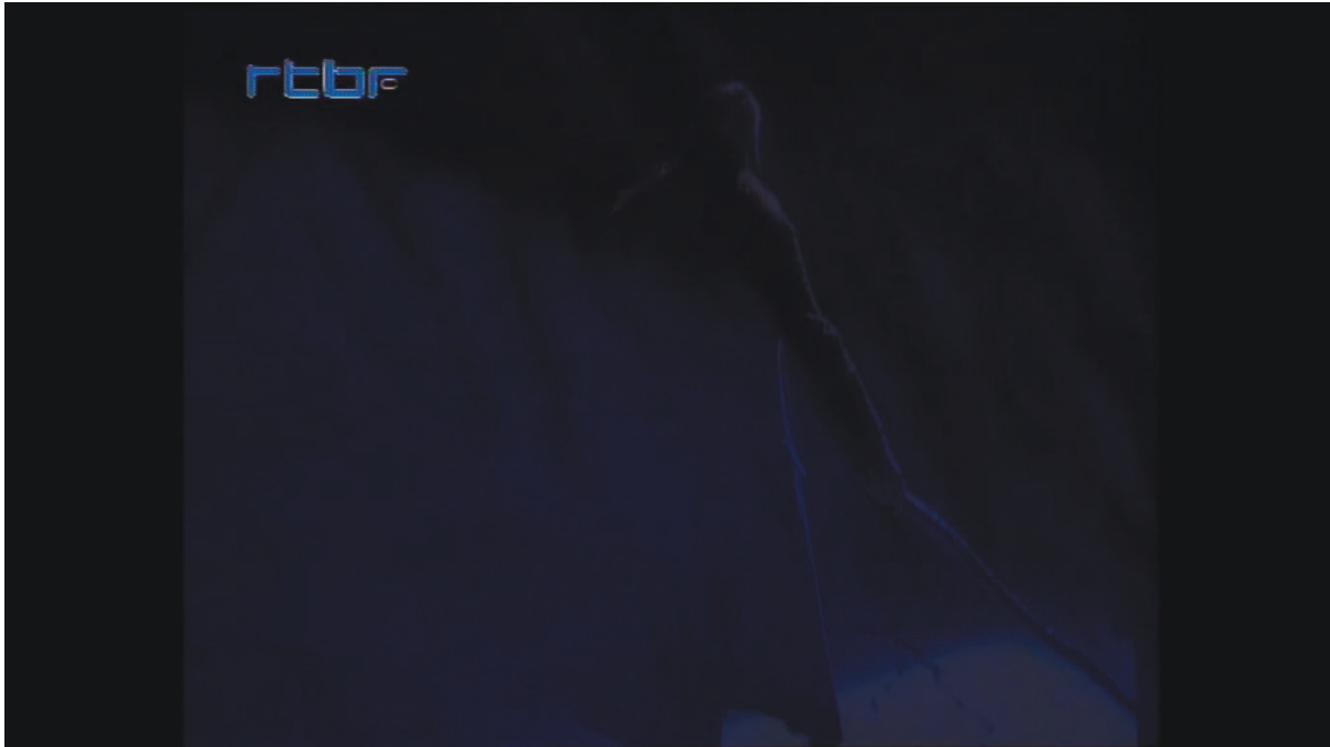
Illustration 11: ŒSR, DVD 1, 56'36

La scène du deuxième acte, à la fin de la transition orchestrale, montre un cap élané qui n'est autre que la découpe surélevée de l'acte précédent [cf. illustration n° 12]. L'aménagement du plateau a construit l'image d'une force dont la tension a grandi tout au long du premier acte – déchirant progressivement davantage le sol – pour éclater dans le suivant. Le rideau s'est levé sur une faible lumière blanche, conformément à l'alternance du jour et de la nuit. Œdipe, prostré dans sa folie, veut se perdre dans la mer pour retourner à l'unité primordiale. Il est peu à peu ramené à la conscience par Clios et Antigone et son délire se canalise dans le travail de sculpture de la falaise. Alors tous les personnages disparaissent de scène : Œdipe, descendu le long de la paroi, est caché par le décor ; Clios et Antigone, partis chercher les outils, sont en coulisse. On n'entend plus que le chœur et l'orchestre, cachés eux aussi. Le « vide » du plateau nourrit une ambiance de mystère, de magie : quelque chose se trame qu'on ne saurait nommer et qui ne peut pas être représenté.