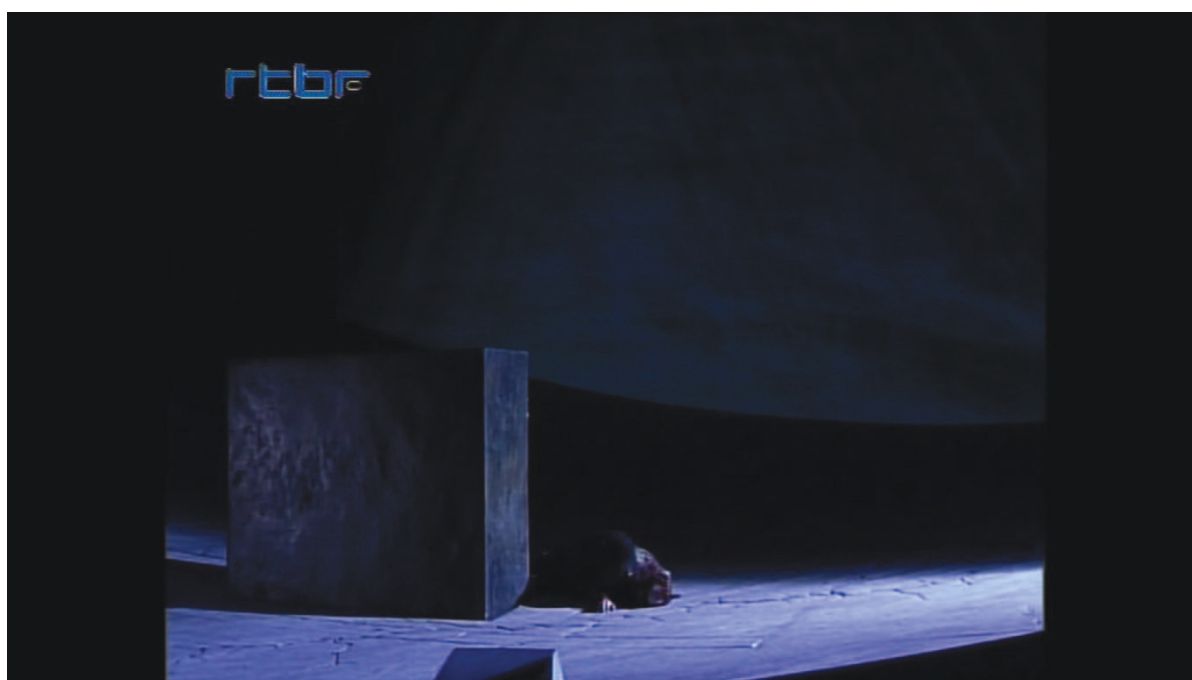
Illustration 20: ŒSR , DVD 1, 9'18

À défaut d'être unique, chaque acte déployant un décor propre, on dira plutôt que l'espace est unifié – par la symétrie circulaire des dispositifs et la progressivité des changements. Cette donnée n'est pas sans rappeler l'unité de temps du théâtre classique français transposée à l'univers merveilleux de la tragédie en musique. Catherine Kintzler rappelle à cet égard la faculté de l'indétermination du cadre spatio-temporel de la fable à produire de l'universel 413 . Plus généralement et spécifiquement à cet opéra, l'économie vaut comme principe directeur dans la scénographie de Philippe Sireuil. Elle est un ferment de poétisation, d'irréalisation de la gestique sommaire et naturaliste des chanteurs. N'avoue-t-il pas lui-même qu'il ne peut « y avoir de théâtralité qu'à la condition qu'il y ait transcription poétique du réel 414 » ?