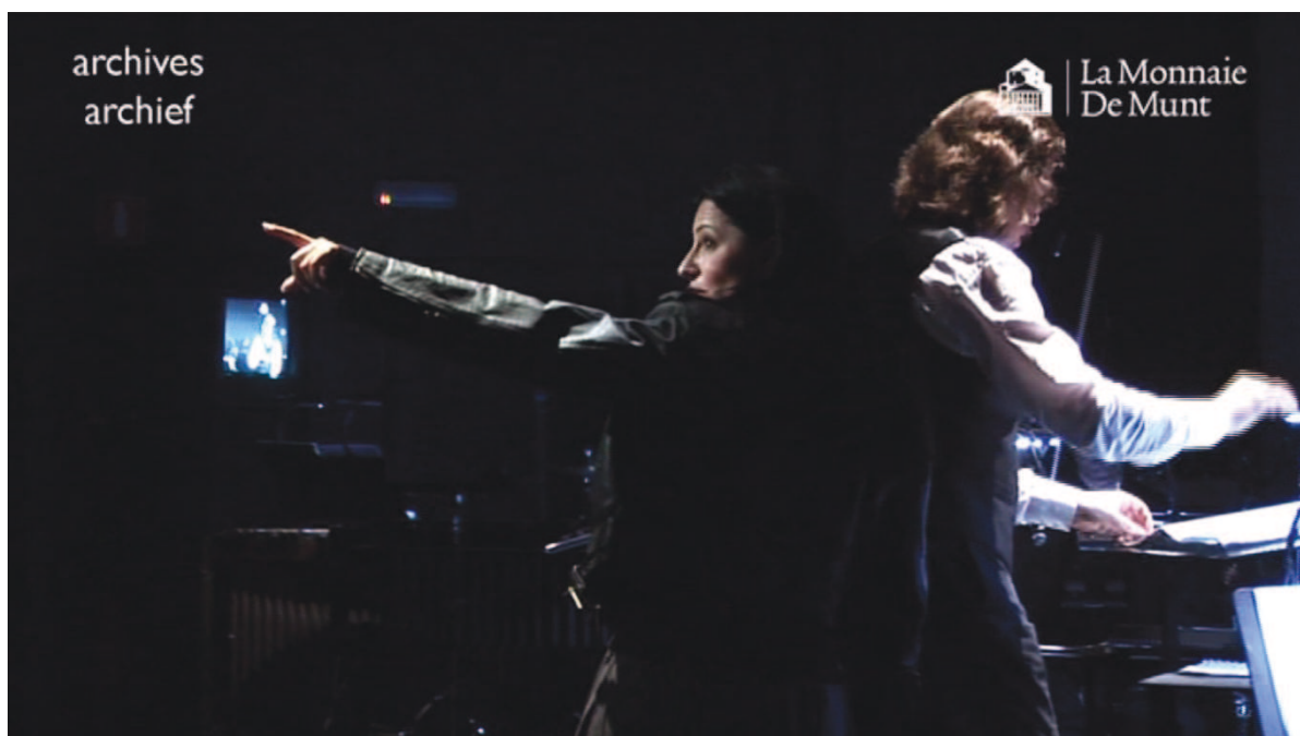
Illustration 27: LLA (Sireuil), 39'06