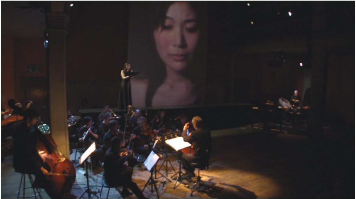
Illustration 31: LLA (Huggler), 14'14