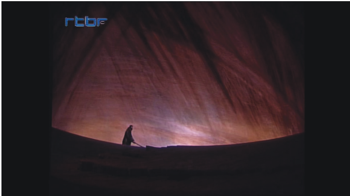
Illustration 22: ŒSR, DVD 1, 15'30

L'absence d'Œdipe pendant toute la deuxième moitié du deuxième l'acte crée, plus qu'un sentiment de solitude, une image de la force du personnage face à la dureté de la matière écrasante de la falaise. Par contraste, le remplissage final a valeur d'accomplissement, d'apaisement dans une image de complétude.