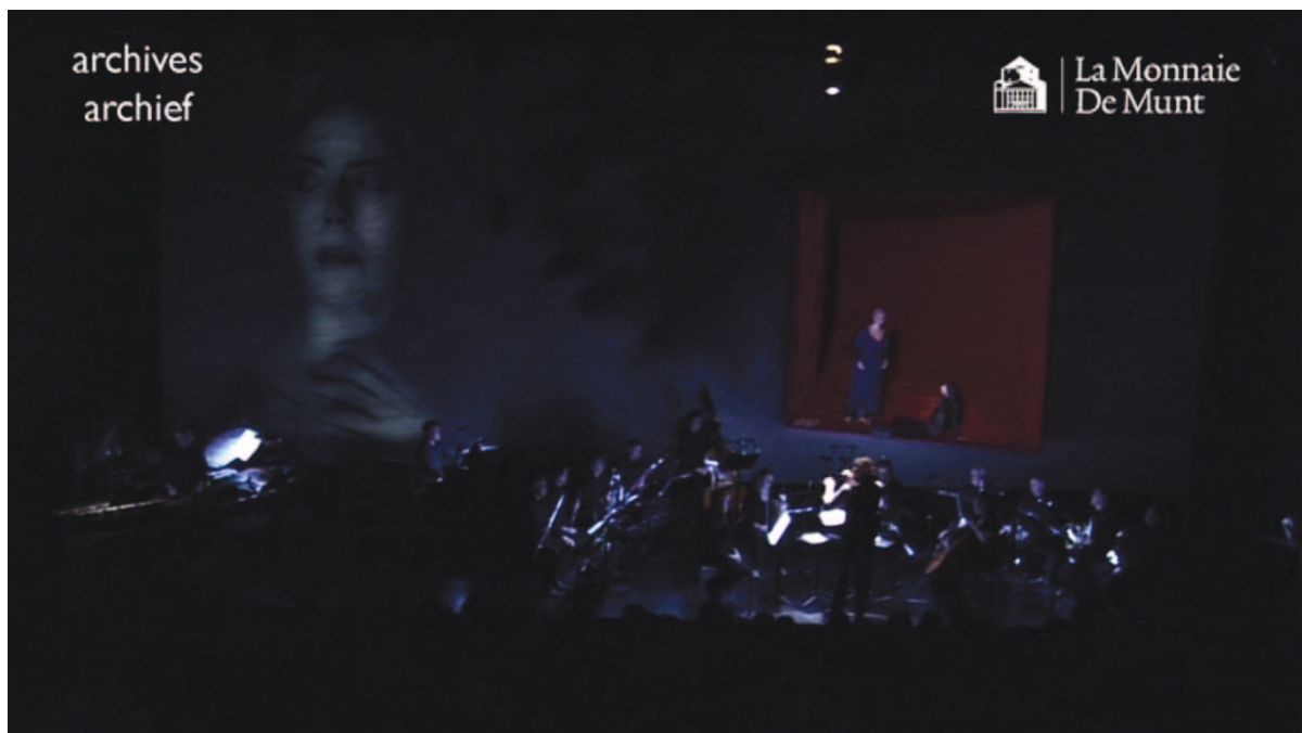
Illustration 26: LLA (Sireuil) , 50'46

Hannah n'a, quant à elle, rien d'un fantôme. Ses gestes et ses postures sont plus désinvoltes – elle s'assied par terre, balance ses jambes – l'ancrent dans une image de la jeunesse qui renvoie au présent immédiat [cf. illustration n° 26].