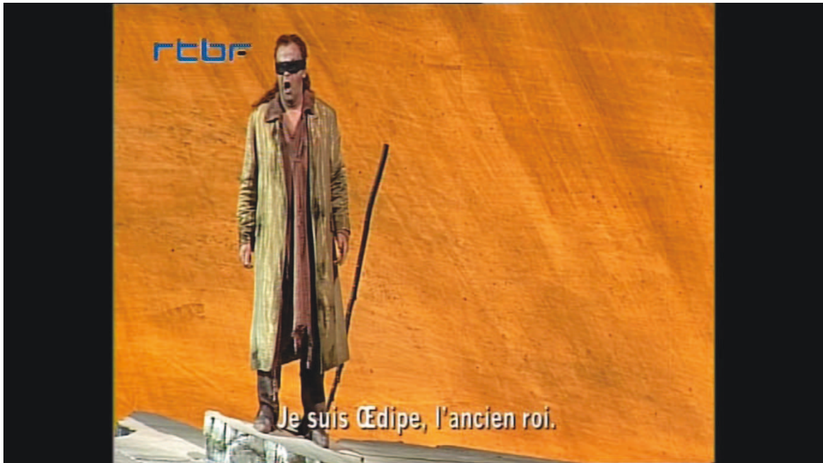
Illustration 4: ŒSR, DVD 2, 26'12

Œdipe se rend vers l'orient puis l'occident pour proclamer qu'il se délie du jugement qu'il a prononcé contre sa propre vie [cf. illustration n° 4]. Il est de nouveau accepté dans la communauté humaine :