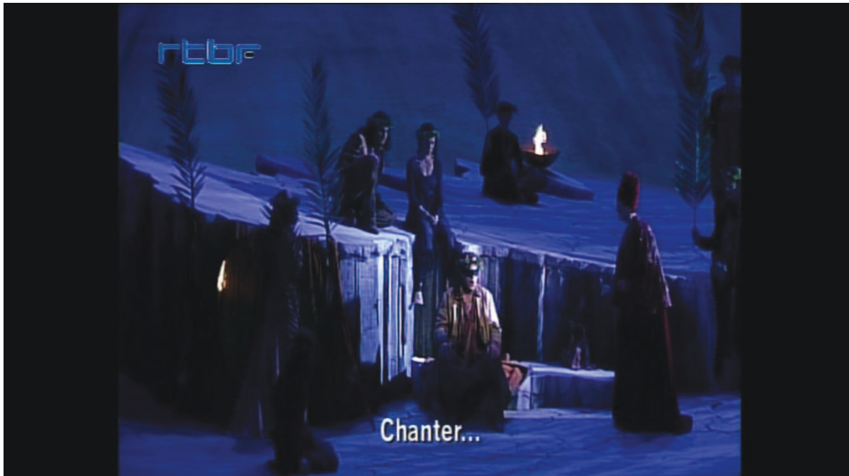
Illustration 5: ŒSR, DVD 2, 31'07

Le chef du village apporte de mauvaises nouvelles : la peste décime la population. Œdipe promet de soigner les malades. Touché lui-même par l'épidémie, il délire. Diotime envoie Calliope auprès du malade :