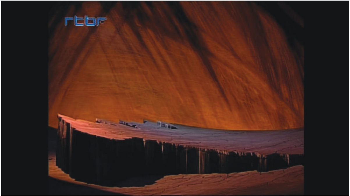
Illustration 14: ŒSR, DVD 2, 25'34