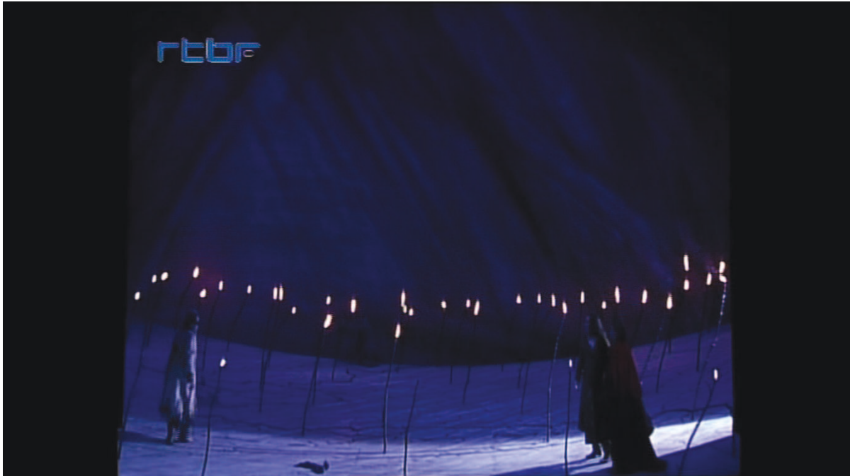
Illustration 7: ŒSR, DVD 2, 1'08'11

Puis il se dirige vers la fresque peinte par Clios :