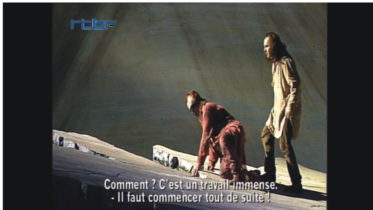
Illustration 3: ŒSR, DVD 1, 1'08'59

C'est alors que surgit l'image de la vague dans la pierre. Œdipe veut se mettre à la sculpture immédiatement [cf. illustration n° 3]. Tous trois travaillent mais c'est seul qu'Œdipe pourra faire plier la vague. Suspendu à la falaise, il sculpte. Hors de lui, « il creuse la pierre avec une force incroyable 166 ».