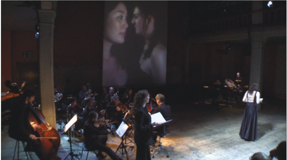
Illustration 33: LLA (Huggler), 52'06

À l'alternance de longues plages de monologue et de dialogue et au lyrisme de la langue vient s'ajouter une lente chorégraphie des deux chanteuses et un dispositif vidéo enregistré faisant la part belle à la lenteur des variations expressives de leurs visages [cf. illustrations n° 33 et 34].