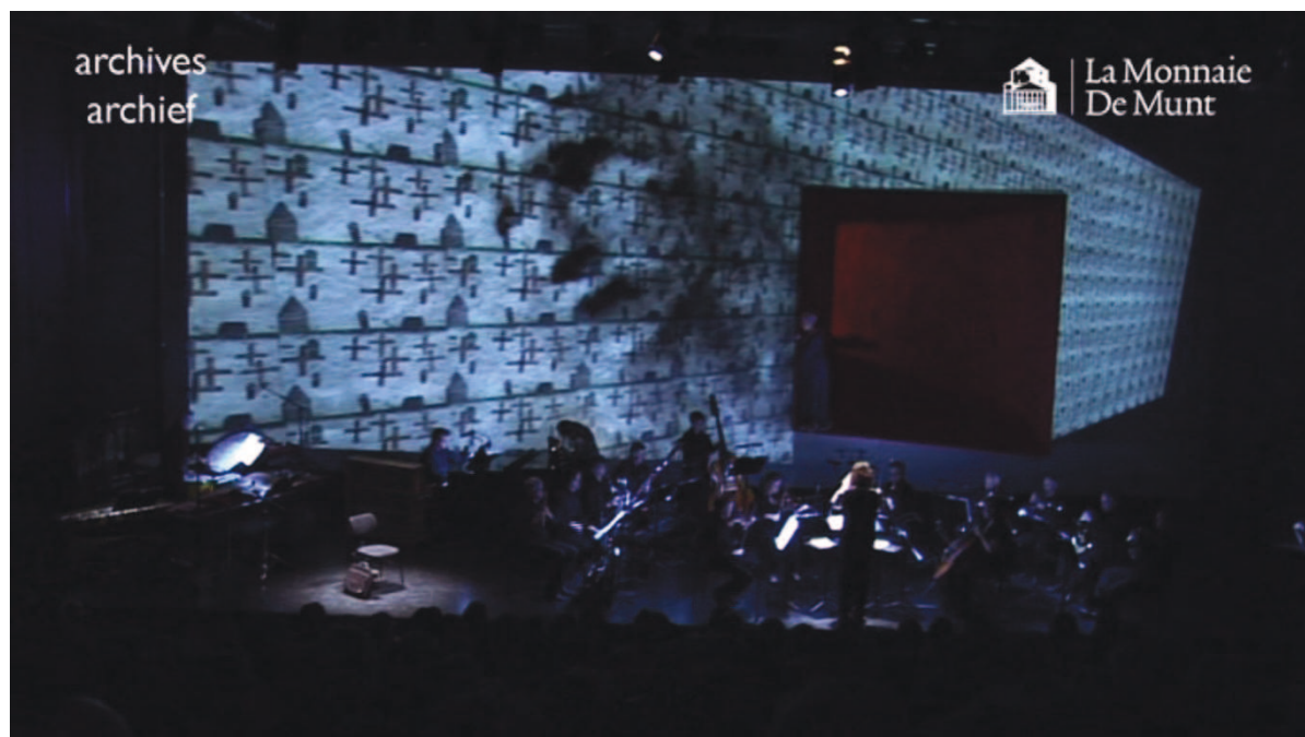
Illustration 28: LLA (Sireuil), 1'09'14

de péplums ou d'archives montrant des armes, des nuages de fumée causés par des impacts de bombes, des avions [cf. illustration n° 28].