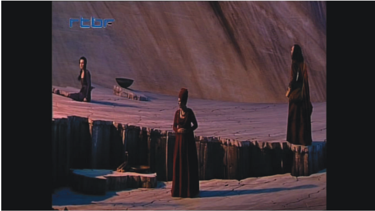
Illustration 16: ŒSR, DVD 2, 50'09

L'ellipse temporelle comblée par l'interlude conduisant du troisième au dernier acte n'est pas précisément appréciable. Comme précédemment, des images des personnages sont projetées, souvenirs accompagnant Œdipe et Antigone.