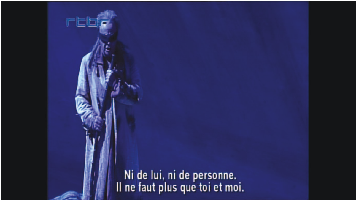
Illustration 6: ŒSR , DVD 2, 54'48

À l'approche de Colone, Œdipe raconte son rêve. Un homme, Sophocle, l'appelait. Clios et Diotime attendent l'arrivée des marcheurs qui paraissent enfin :