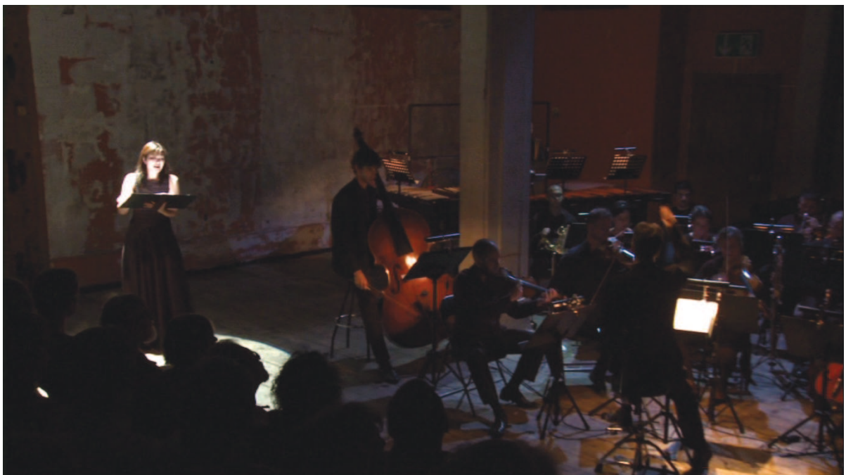
Illustration 32: LLA (Huggler), 30'20