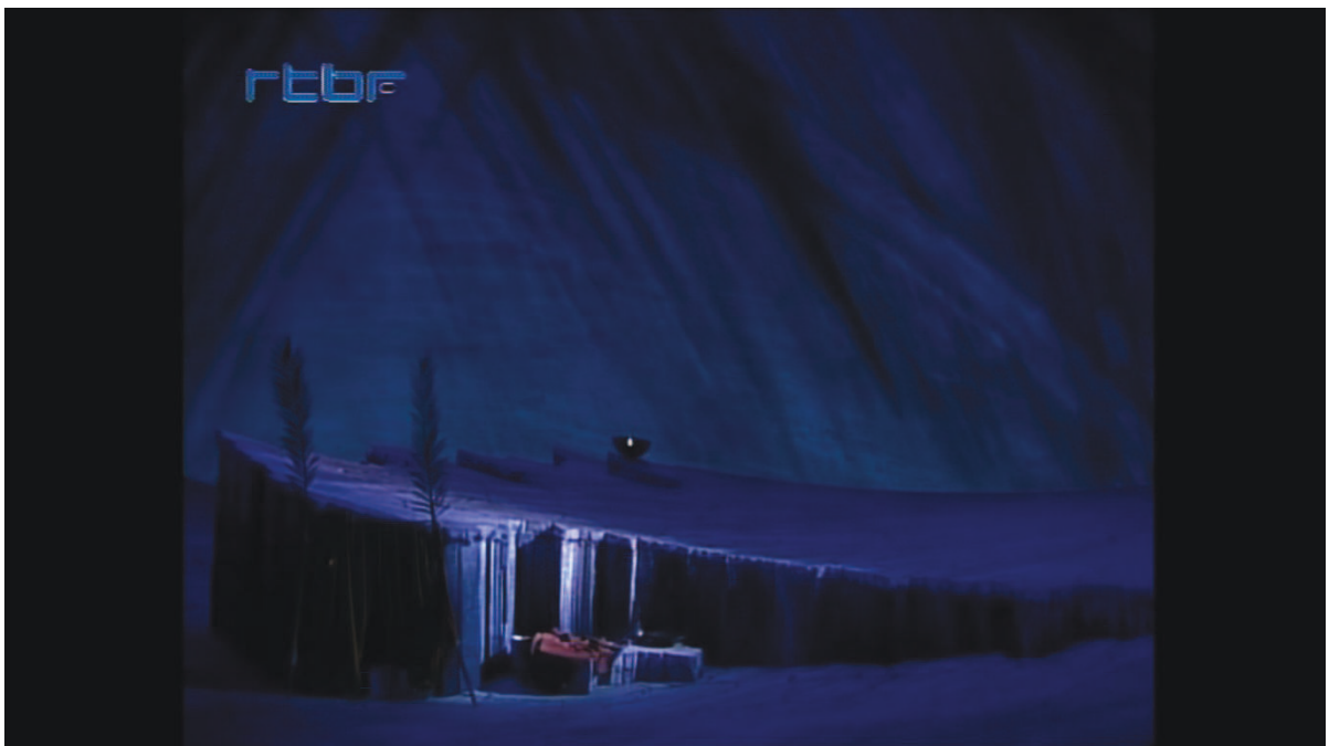
Illustration 15: ŒSR, DVD 2, 43'51