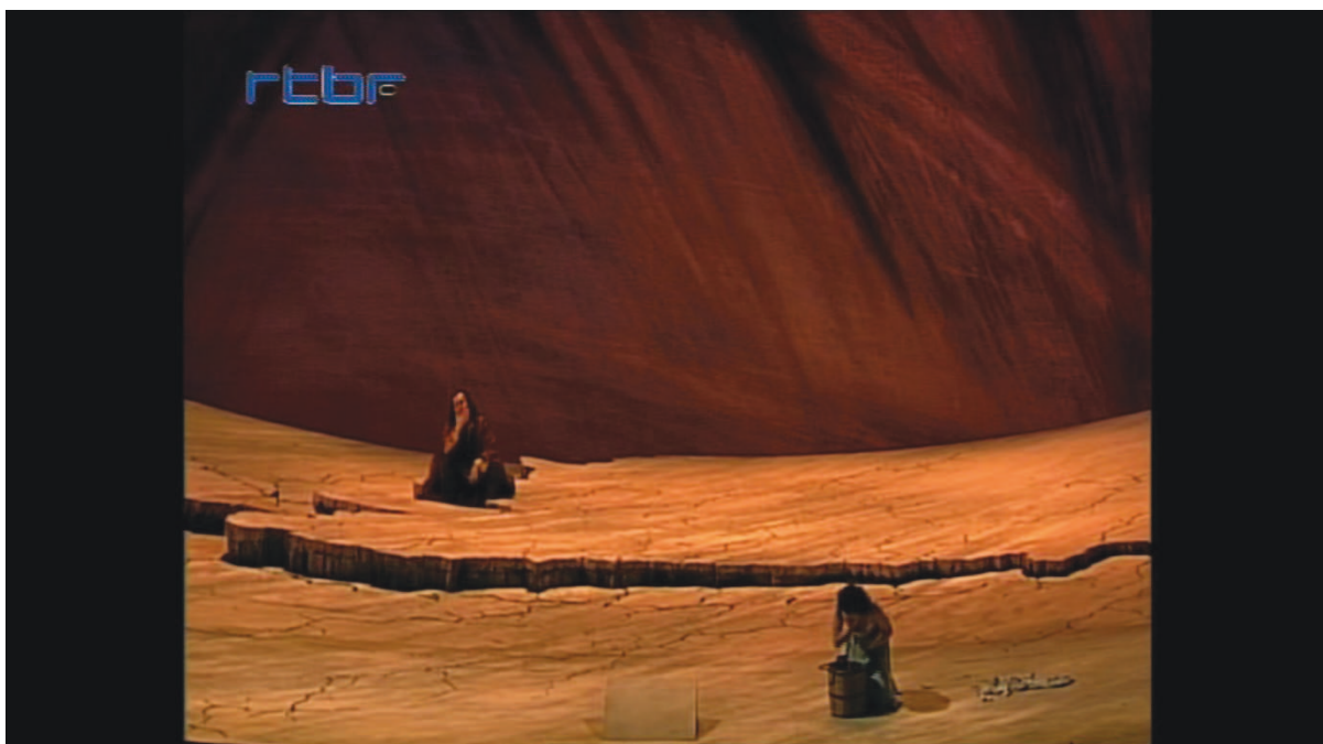
Illustration 9: ŒSR, DVD 1, 26'39