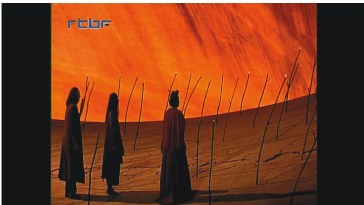
Illustration 19: ŒSR, DVD 2, 1'16'43