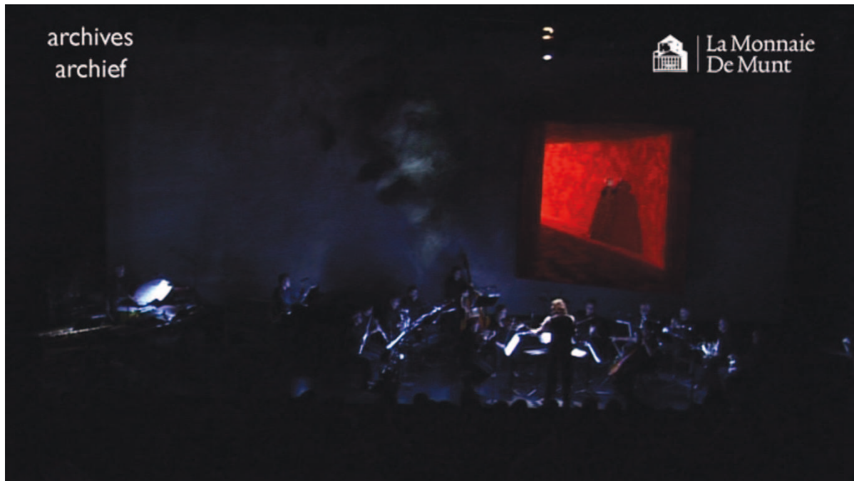
Illustration 24: LLA (Sireuil), 6'15

Antigone est dans une niche carrée un peu suspendue et profonde ressemblant à une galerie formant un coude qui empêche de distinguer l'autre issue. Les parois rouges gommant la perception du sol et des murs [cf. illustration n° 24]. Donc quelque chose d'insituable, un lieu imaginaire. Le rouge évoque la colère, le sang, la lumière du feu des torches. Il rappelle aussi le chemin et la fresque du « temple rouge » qui prend feu à la fin d' Œdipe sur la route et qui donne son nom au premier chapitre de l' Antigone de Bauchau.