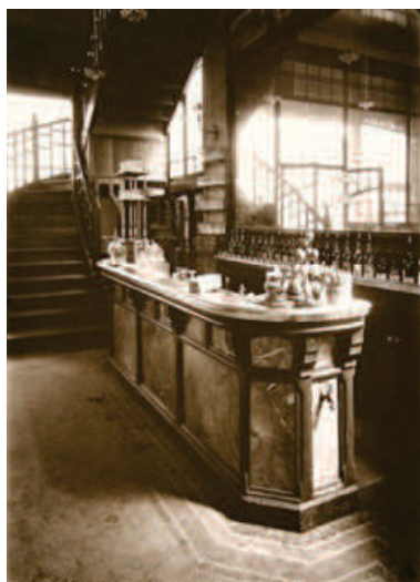
Photographie 34 – Eugène Atget, Paris