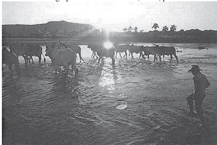
Photographie 42 – BISILLIAT, 1979, p.29