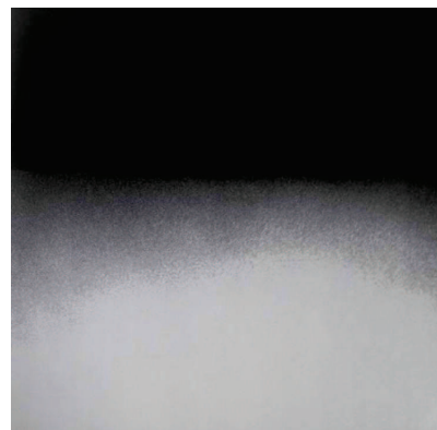
Photographie 54 – BISILLIAT, 1979, p.59