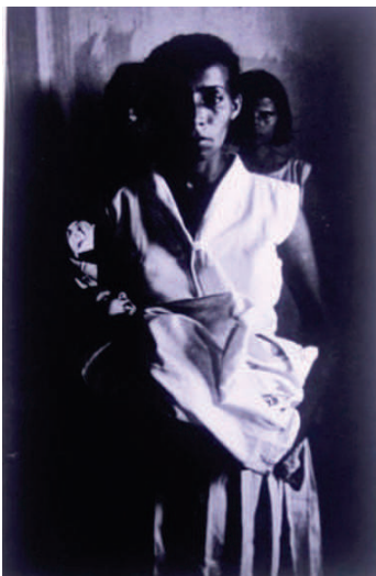
Photographie 32 – BISILLIAT, 1979, p.14