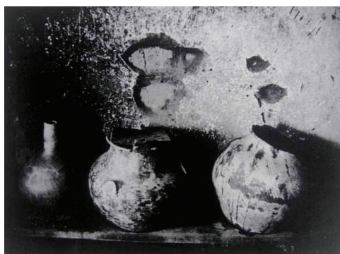
Photographie 39 – BISILLIAT, 1979, p.24

« O perfume do nome da Virgem perdura muito; às vezes dá saldos para uma vida inteira »