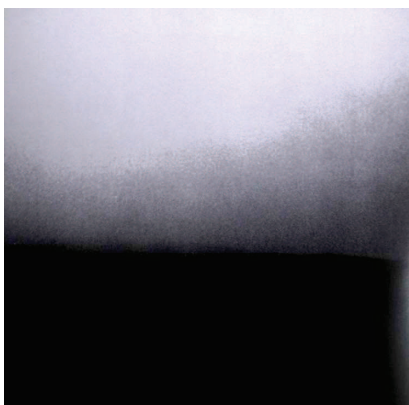
Photographie 53 – BISILLIAT, 1979, p.58