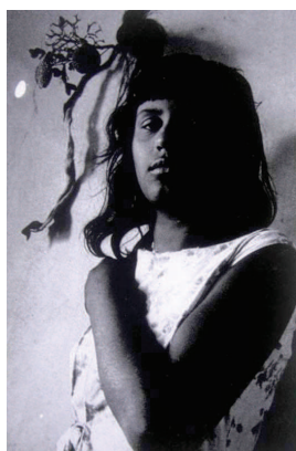
Photographie 43 – BISILLIAT, 1979, p.31

“ Bela é a lua, lualã, que torna a se sair das nuvens, mais redondada recortada ” (ROSA apud BISILLIAT, 1979, p. 31).