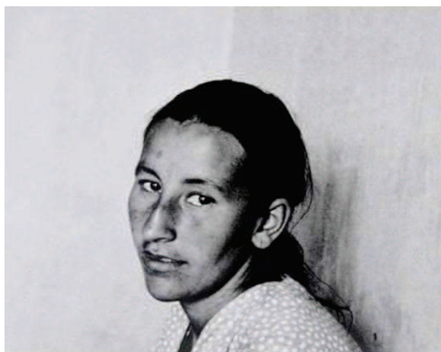
Photographie 29 – BISILLIAT, 1979, p.7