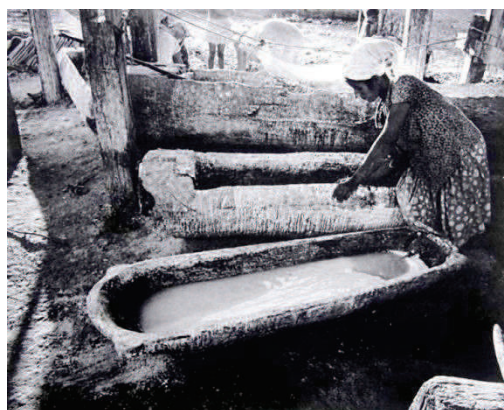
Photographie 40 – BISILLIAT, 1979, p.24

Ces trois dernières images (Photographies 38, 39 et 40) renvoient symboliquement à la coupe. Erich Neumann souligne :