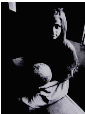
Photographie 36 – BISILLIAT, 1979, p.18

« Eu quero ver essas águas, a lume de lua... águas para fazerem minha sede . De tristeza, tristes. águas, coração posto na beira.... »