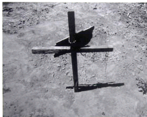
Photographie 41 – BISILLIAT, 1979, p.26

« Chapadão. Morreu o mar, que foi » (ROSA apud BISILLIAT, 1979, p. 26).