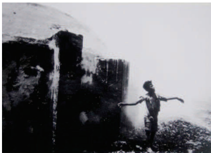
Photographie 55 – BISILLIAT, 1979, p.60