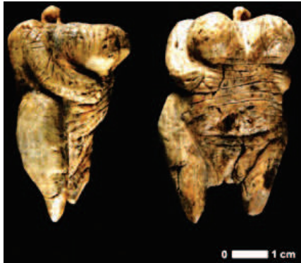
Photographie 27 – Vénus de Hohle Fels