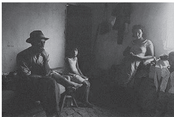
Photographie 30 – BISILLIAT, 1979, p.10

« Tem horas em que penso que a gente carecia, de repente, de acordar de alguma espécie de encanto »