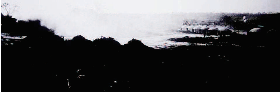
Photographie 52 – BISILLIAT, 1979, p.57

« Olhe : muito além, vi lugares de terra queimada e chão que dá som – um estranho. Mundo esquisito » (ROSA apud BISILLIAT, 1979, p. 57).