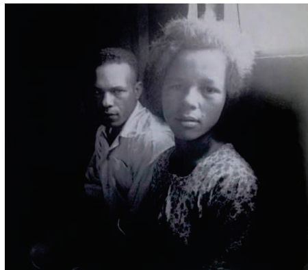
Photographie 31 – BISILLIAT, 1979, p.13

« ..a gente sabe que esses silêncios estão cheios de outra música »