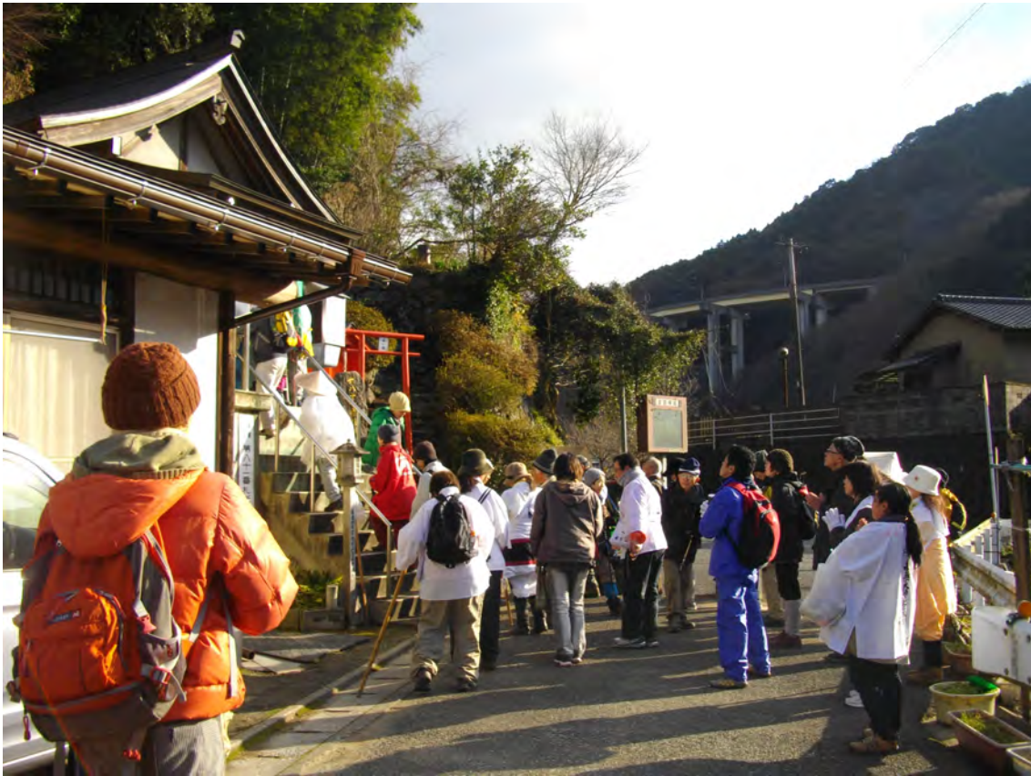
Photo 30 – Pèlerins en blanc et pèlerins en tenue de randonnée lors de la récitation de sūtra donnée par les sendatsu du Nanzō-in pendant le pèlerinage du « grand froid » (janvier 2014)