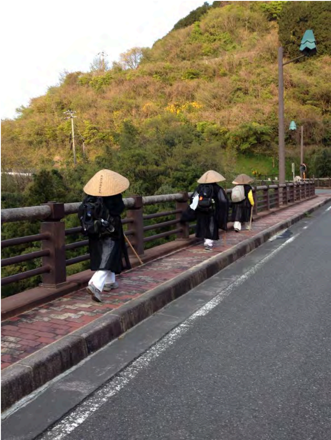
Photo 14 – Fidèles du Daikoku-ji en pèlerinage à Sasaguri, portant la tenue des moines en ascèse (janvier 2014)