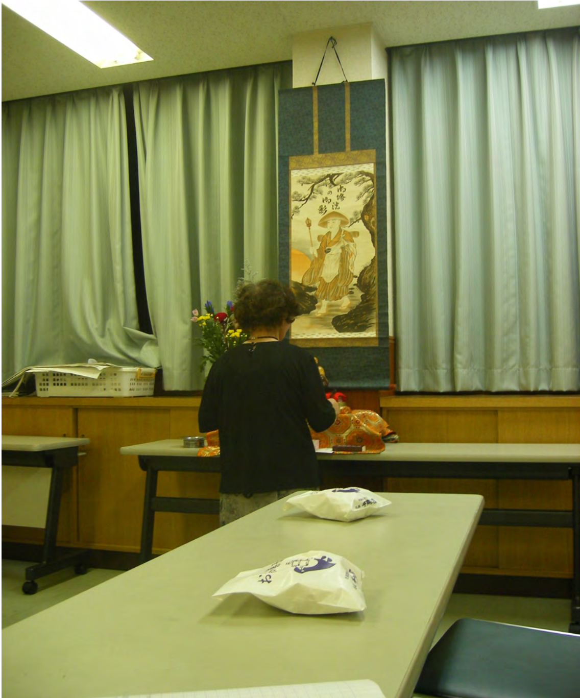
Photo 10 – Rouleau suspendu du Grand Maître Kōbō de la confrérie de Daishi

La différence majeure entre cette confrérie et les autres du même genre est son temps fort, en avril. A la haute saison de pèlerinage, toutes les confréries de Daishi organisent une journée de dons aux pèlerins dans un lieu de passage au centre de leur quartier. Après avoir installé une petite table sur laquelle on met la statue de Daishi qui