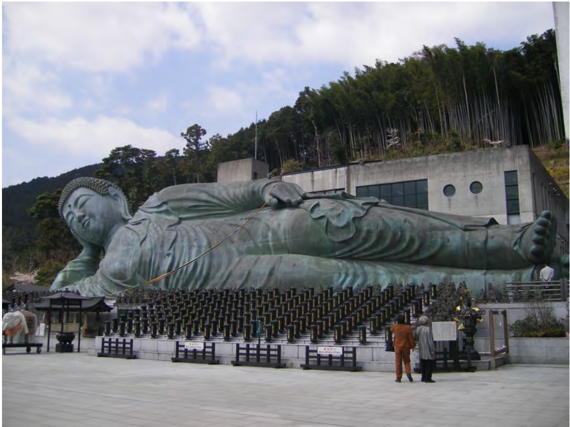
Photo 2 – Le bouddha couché du temple Nanzō-in, temple de pèlerinage numéro 1

Qu'elles soient en pierre, en bois, situées au bord des routes, aux carrefours, ou dans l'enceinte des temples, enchâssées dans de petits tabernacles ou en pleine nature, ces statues frappent l'observateur par leur multitude et leur diversité. Certaines impressionnent tout particulièrement par leur taille ou leurs appareils clinquants. C'est le cas de l'immense bouddha couché ( nehan-zō 涅槃像) du temple Nanzō-in 南蔵院 (Voir Photo 2), situé à Kido, petit hameau desservi par une gare installée là pour amener le flot de pèlerins venus de la ville à ce temple qui reste un haut lieu touristique de la région. Avec ses quarante et un mètres de long et onze mètres de haut, cette statue représentant le bouddha Shakamuni au moment de son nirvāṇa est considérée comme la plus grande statue de bronze du Japon. On peut la voir de la montagne d'en face, se détachant avec éclat sur le vert de la colline. On retrouve un grand nombre de statues qui rivalisent de hauteur et de couleur tout au long du circuit, ainsi que de nombreux