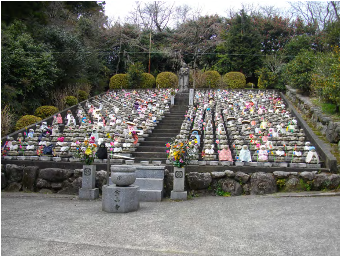
Photo 42 – Jizō des fœtus avortés au temple Nomiyama Kannon (numéro 36)

A l’instar de nombreux spécialistes des oracles, Shōzaki Ryōsei elle-même préconise des offrandes qui personnalisent encore plus les âmes de ces enfants morts-nés auprès de leur famille :