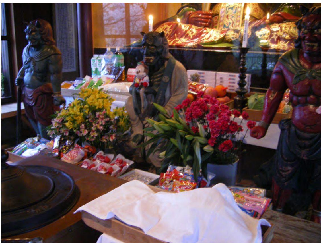
Photo 41 – Statue de la « vieille arracheuse de vêtements » vêtue d'un manteau au Dainichi-ji. En offrande devant l'autel, des jouets pour enfants, offerts aux âmes des fœtus avortés (avril 2008)

céleste et l'humain décrite par Marlène Albert-Llorca dans son travail sur les statues de la Vierge en Catalogne, où les fidèles se réjouissent d'avoir le privilège d'habiller leur statue avec leurs propres vêtements et de la rendre belle 298 . Ainsi, en rendant les puissants êtres de l'autre monde — ces êtres dont dépendront leur sort posthume — redevables par les attentions dont ils entourent leurs représentations, les dévots tentent de les rendre bienveillants à leur égard. Pour cela fonctionne, il faut que s'opère un échange symbolique et matériel, que j'ai déjà évoqué plus haut : l'échange offrandes matérielles (envoyés par les fidèles humains dans le monde autre) contre bénéfices immatériels (renvoyés en retour par les non-humains dans le monde humain). Cet échange suppose un système de projection des offrandes par le rite, que j'ai appelé ici « transfert des dons terrestres. »