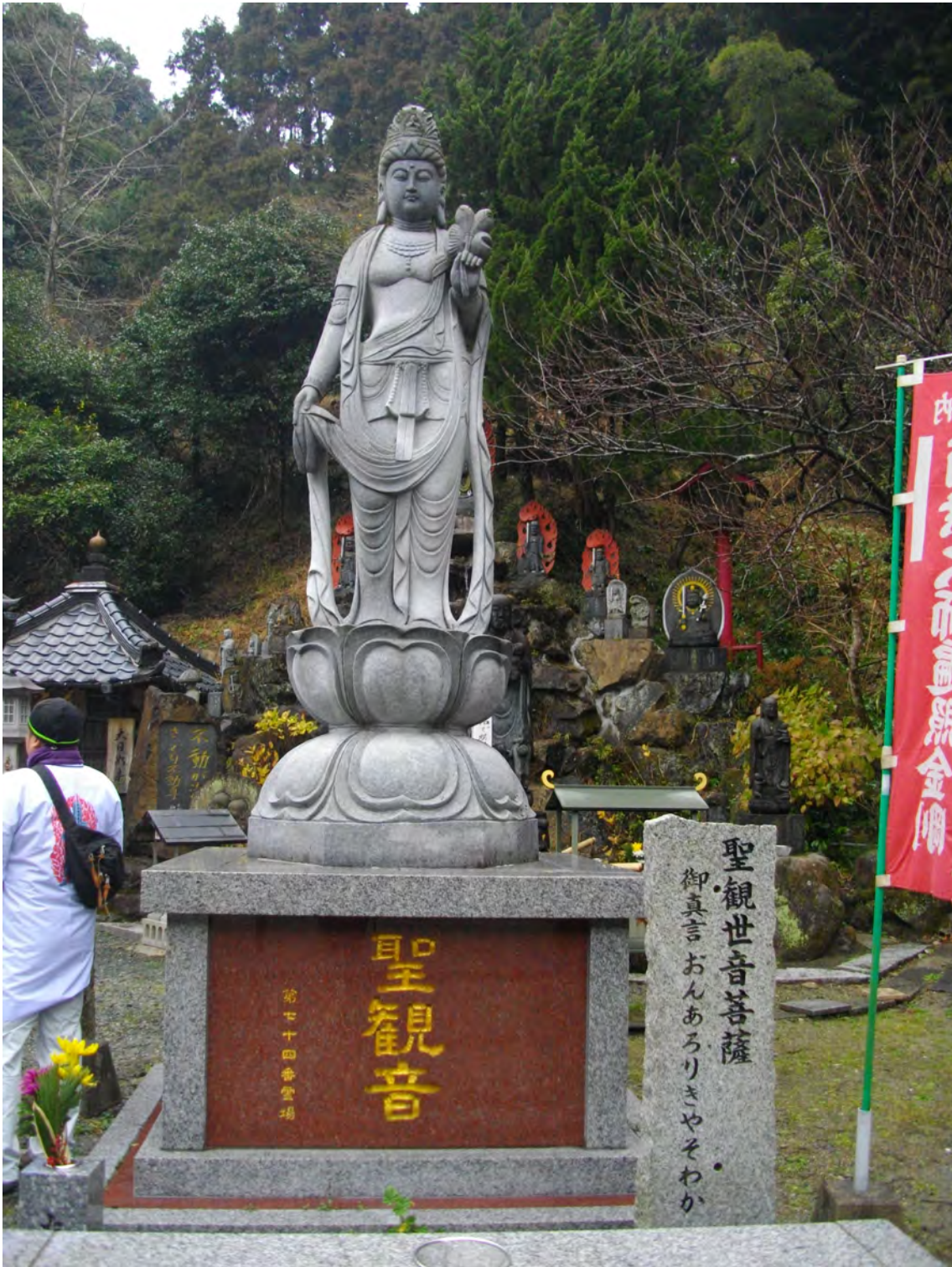
Photo 37 – Statue de Kannon à l'oratoire Kido Yakushi-dō (numéro 74) en janvier 2014