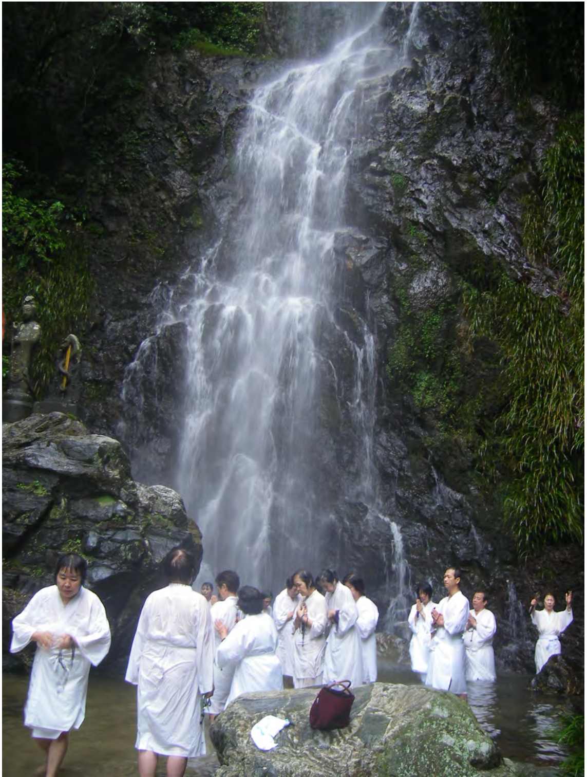
Photo 23 – Disciples et fidèles du Dainichi-ji pratiquant l'ascèse de la cascade à Ogi (août 2009)