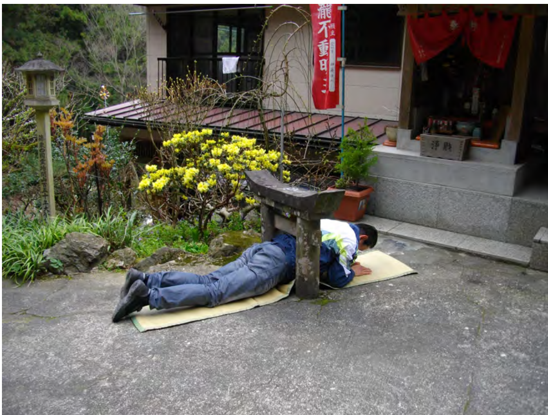
Photo 18 – Fidèle de Tokunaga Wasan sous le portique au Kongō-no-taki-ji, temple de pèlerinage numéro 8 (28 mars 2010)

prend. Dans l'eau de la cascade et les flammes du rite du feu ( goma 護摩), elle dit voir apparaître la forme des dieux et des bouddhas, ou même des visions de l'avenir et du passé. Régulièrement, des entités la renseignent sur la santé de sa famille, de ses fidèles ou sur les événements à venir.