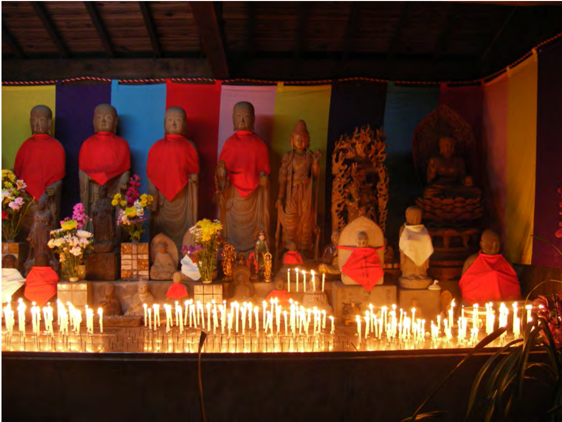
Photo 16 – Alignement de statues de Jizō au Dainichi-ji, temple de pèlerinage numéro 28, pendant le rite des « mille lumières » (7 avril 2008)