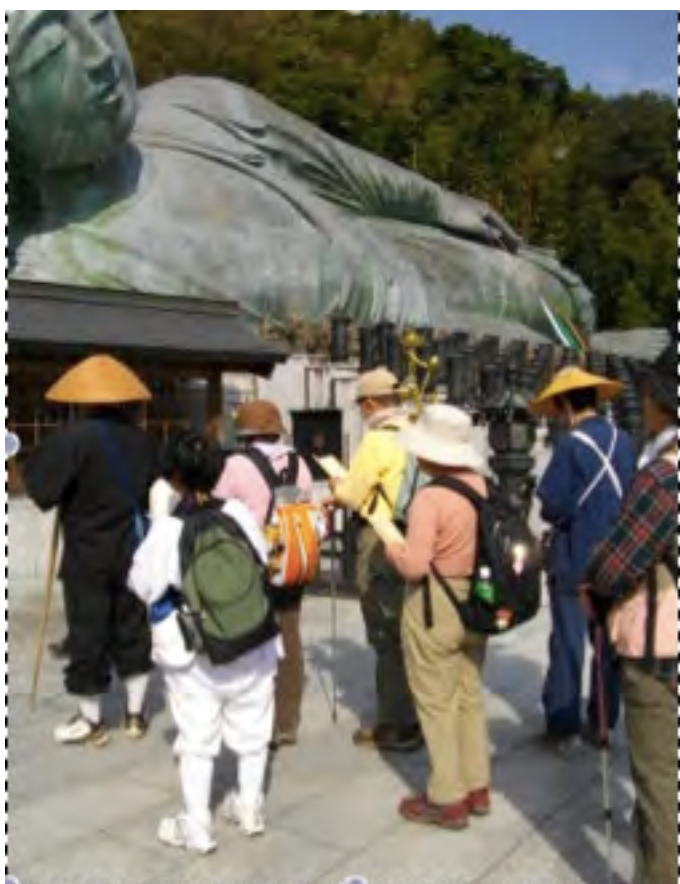
Photo 9 – Groupe de pèlerinage du temple Enmei-ji devant le bouddha couché du Nanzō-in (avril 2010)

mois de mars, avril et mai, à raison d'une journée par mois, à pied (Voir Photo 9). Le pèlerinage du Nanzō-in se déroule à pied, sur trois jours, environ une semaine après le nouvel an. Il s'agit du premier pèlerinage de l'année et il est considéré comme une ascèse ( kangyō 寒行 ou « ascèse du grand froid »), à cause des conditions climatiques. Comme tous les autres pèlerinages à Sasaguri organisés par les temples du Reijō-kai, il est fréquenté par des gens aux buts très différents, allant de l'ascèse au simple tourisme.