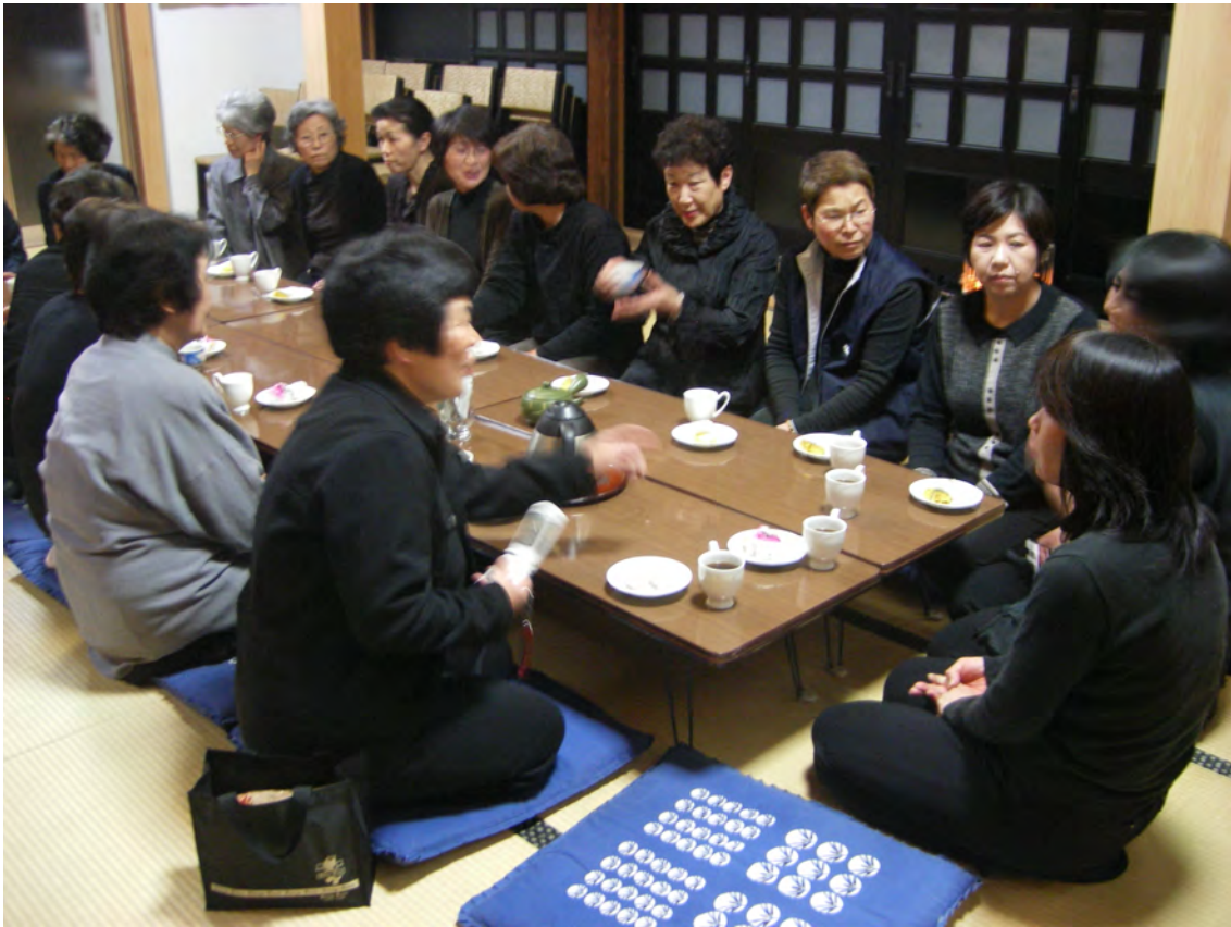
Photo 5 – Paroissiennes du Kenshō-ji après les rites de la fête des morts (août 2009)

Ces réunions qui étaient autrefois des veillées se passent le soir. Elles réunissent des femmes âgées, qui ont déjà une belle-fille. Les femmes mangent ensemble la nourriture qu'elles ont apportée et discutent devant un rouleau suspendu ( kakejiku 掛け軸) représentant le bodhisattva Kannon, gardé par la personne de « charge » ou de « tour » ( tōban 当番) chez qui le groupe se réunit. Une petite collecte d'argent, déposée dans une boîte devant l'image en tant qu'offrande, est faite à l'occasion de chaque réunion, pour faire office de caisse commune. Selon les quartiers, les femmes utilisent cet argent pour faire une activité ensemble, comme un pèlerinage ou un restaurant, ou pour financer les frais de nourriture de leurs réunions.