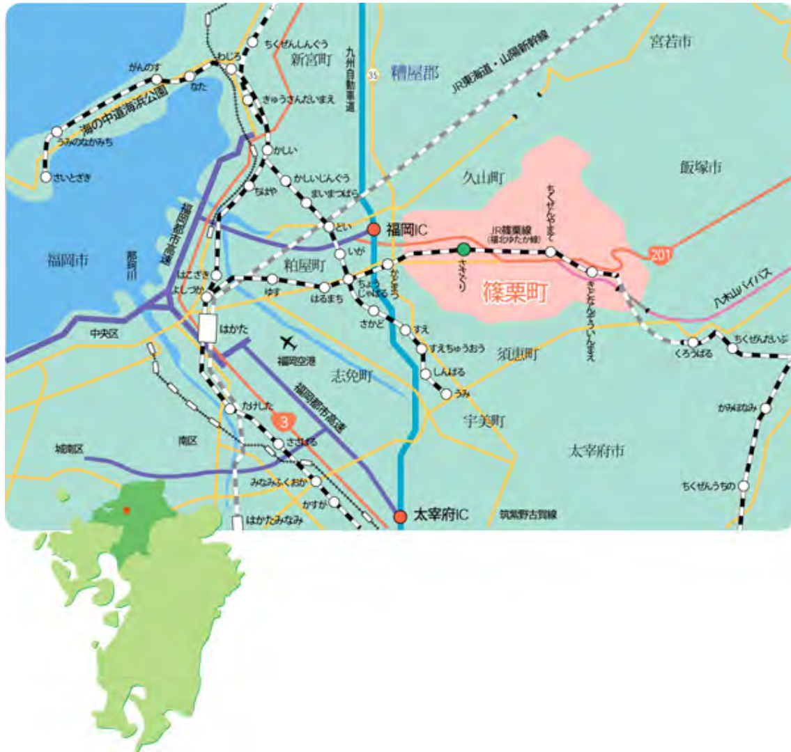
Carte 1 – Situation de Sasaguri dans l’île de Kyūshū (carte mairie de Sasaguri)