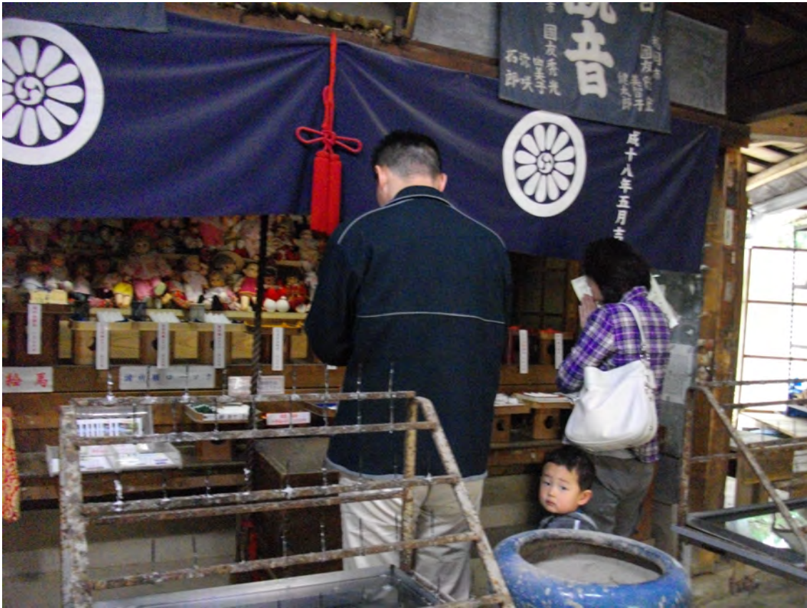
Photo 43 – Visite de remerciement ( o rei mairi ) d'une famille ayant obtenu un enfant, à l'oratoire Koyasu Kannon, dans l'enceinte du fudasho numéro 55 du circuit de pèlerinage de Sasaguri (mars 2011)

Avant d'aller plus loin, il paraît nécessaire d'analyser le processus par lequel ces poupées passent de simple objet utilitaire (jouet) à celui d'objet rituel. Les responsables du temple insistent sur le fait que ces poupées doivent être le plus neutre possible : ils refusent les poupées japonaises traditionnelles ou celles qui sont trop artistiques, ils ne veulent pas de peluches représentant des animaux non plus. Toutes les poupées doivent se ressembler, être achetées en remerciement par une famille qui a réussi à avoir des enfants par le biais de ce rite et offertes au temple, où elles seront mises sur l'autel, aux pieds de la statue de Kannon. Le refus de peluches en forme d'animaux paraît légitime, puisque les gens viennent pour avoir des enfants. Celui des poupées « japonaises » s'explique par la crainte diffuse qu'inspire ce type de poupées aujourd'hui à la plupart des gens, en raison de l'influence de la vague prolifique de films d'horreurs. Interrogés