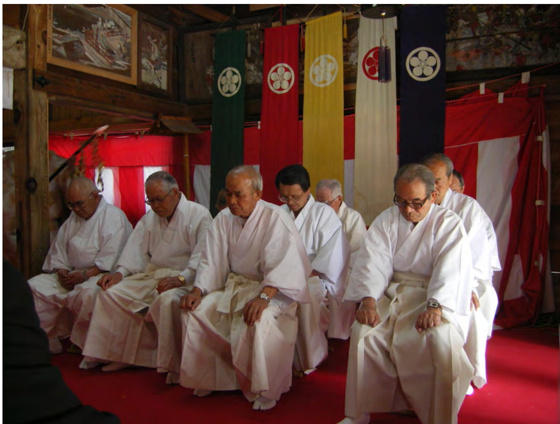
Photo 6 – Rassemblement des chefs de familles anciennes d’Onaka au sanctuaire Oimatsu d’Onaka (avril 2008)

Cependant, à cette religiosité minimale peut s’ajouter une participation plus active dans la vie du temple paroissial. Cet investissement peut passer notamment par la participation aux pèlerinages organisés par les confréries affiliées aux temples de paroisse et aux sanctuaires locaux. Par exemple, chaque année en avril, le supérieur du Kenshō-ji organise un pèlerinage dans les temples principaux du courant de la Terre Pure qui se déroule en trois ans. En 2010, l’un de ces cycles de pèlerinage prenait fin avec la visite du temple Chion-in 知恩院 à Kyōto, siège du bouddhisme de la Terre Pure. Le pèlerinage, organisé sur trois jours, comprenait des visites à des temples célèbres de ce courant, entrecoupées d’intermèdes gastronomiques et touristiques. Pour les participants, ce pèlerinage à Kyōto est un moment hautement ludique qui permet de