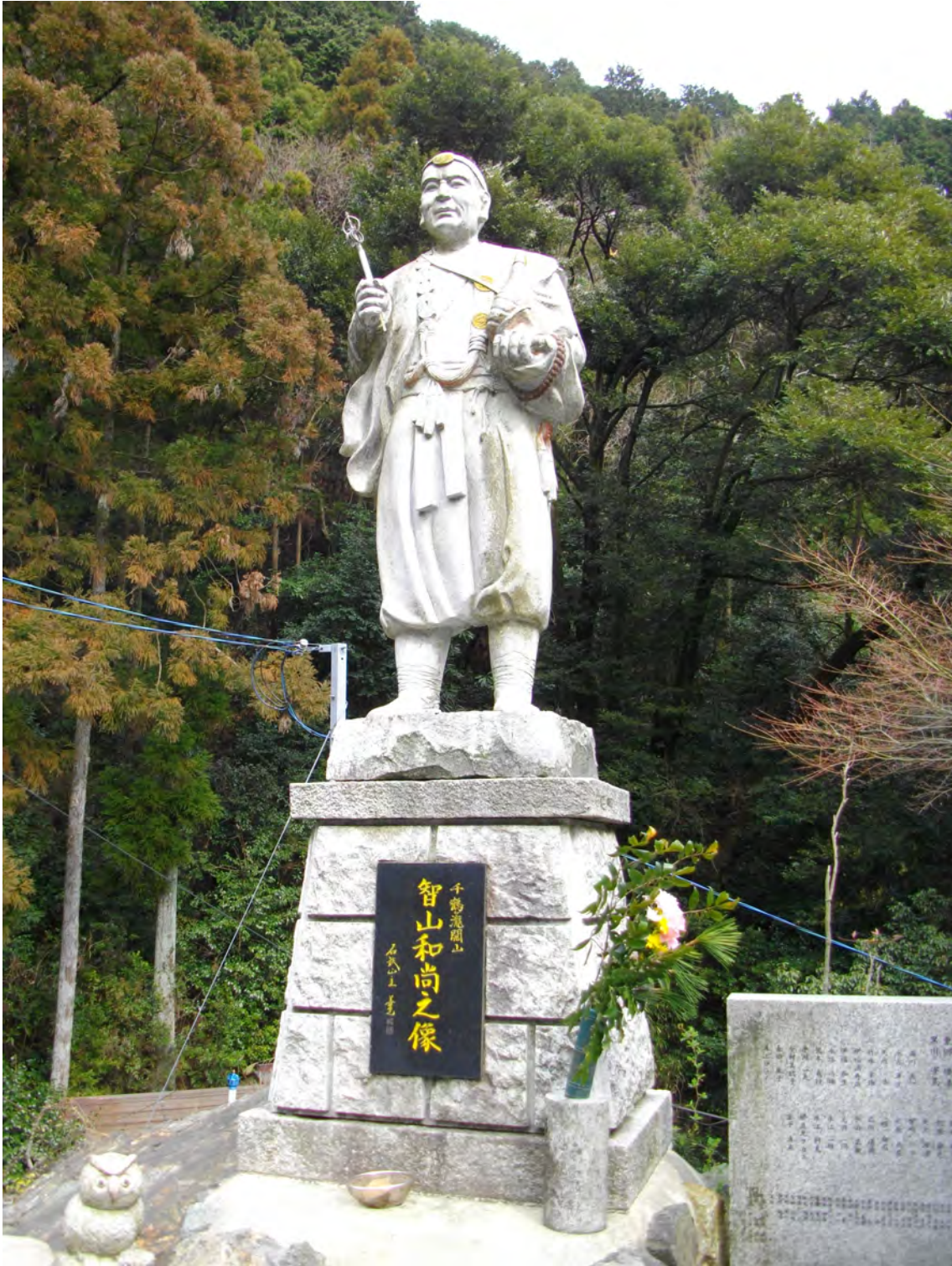
Photo 13 – Statue de Chizan, fondateur du Senkaku-ji (temple de pèlerinage numéro 12)