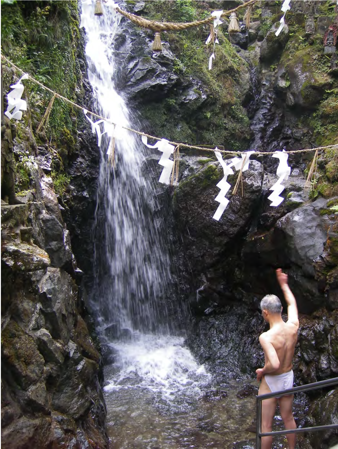
Photo 27 – Praticant vétéran de l'ascèse de la cascade « coupant » le kuji avant d'entrer sous la cascade de Yōrō (mars 2008)