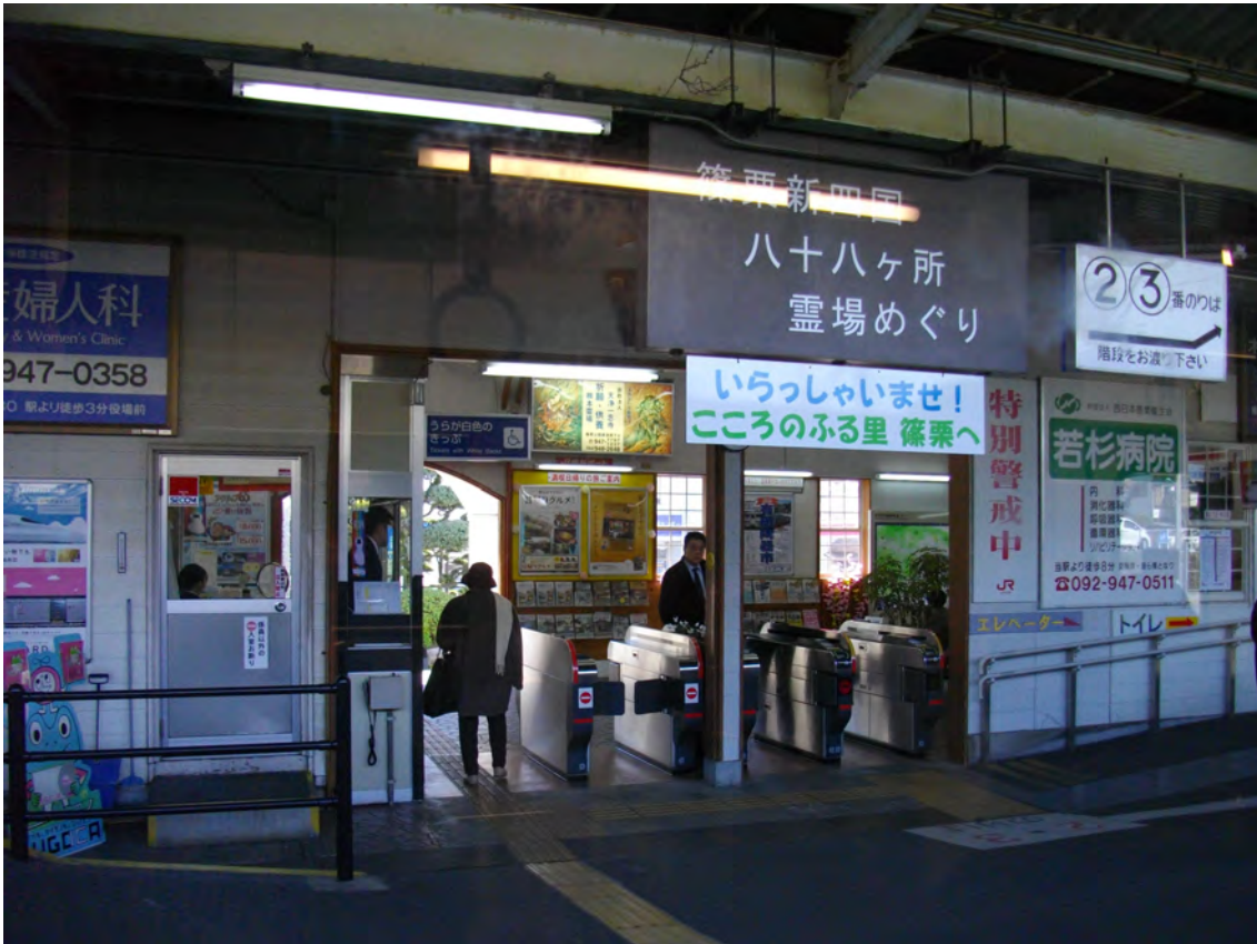
Photo 1 – Vue de la gare de Sasaguri à l’arrivée de Fukuoka par le train 1 . Le panneau au-dessus de l’entrée indique « circuit de nouveau pèlerinage aux 88 lieux saints de Shikoku à Sasaguri » et juste en dessous, sur le panneau blanc : « Bienvenue à Sasaguri, village natal de votre cœur ». Il s’agit du slogan de la commune.