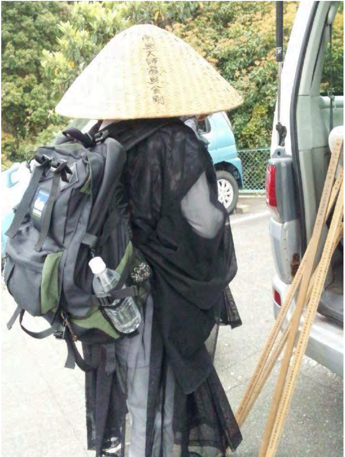
Photo 33 – Le départ : préparation du matériel pour les pèlerins du Daikoku-ji (février 2015)