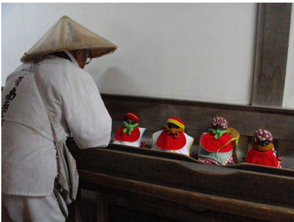
Photo 34 – Shiraishi soupesant les statues de Jizō au Nanzō-in (janvier 2014)

la repose et se concentre sur une question en décidant du positif ou du négatif selon si elle paraît plus lourde ou plus légère, avant de la soulever à nouveau. Ce procédé lui a été enseigné au temple de pèlerinage n°12, le Senkaku-ji, où existait une statue de Jizō réservée à cet usage. Le temple ayant brûlé il y a six ans, Shiraishi a dû en trouver une nouvelle. Il a porté son choix sur celle du Nanzō-in, qui compte beaucoup de statues célèbres parmi les pèlerins.