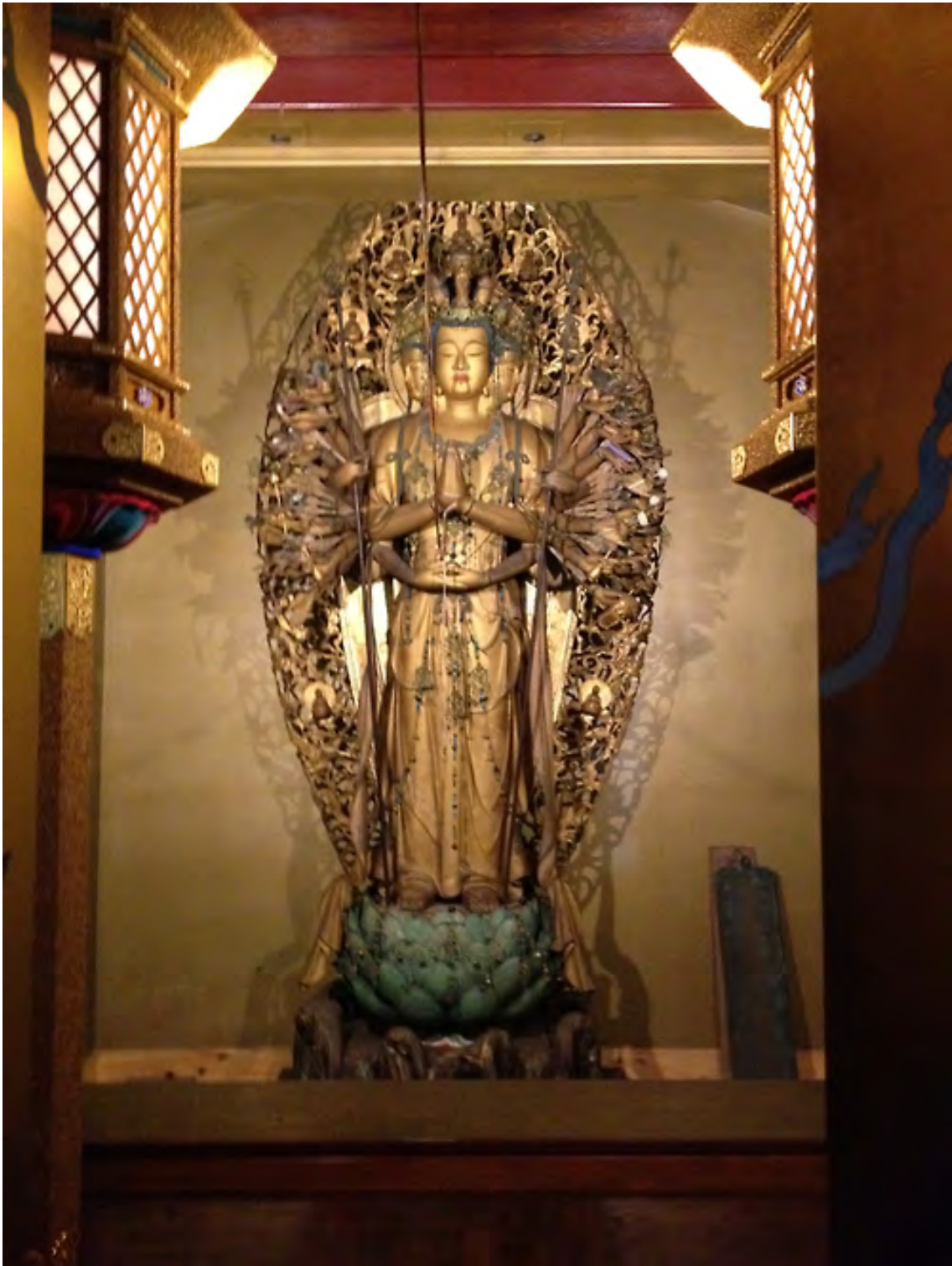
Photo 38 – Bouddha caché ( hibutsu ) du temple Kongōfuku-ji, numéro 28 du circuit de pèlerinage de Shikoku (Ashizuri misaki, mars 2014)