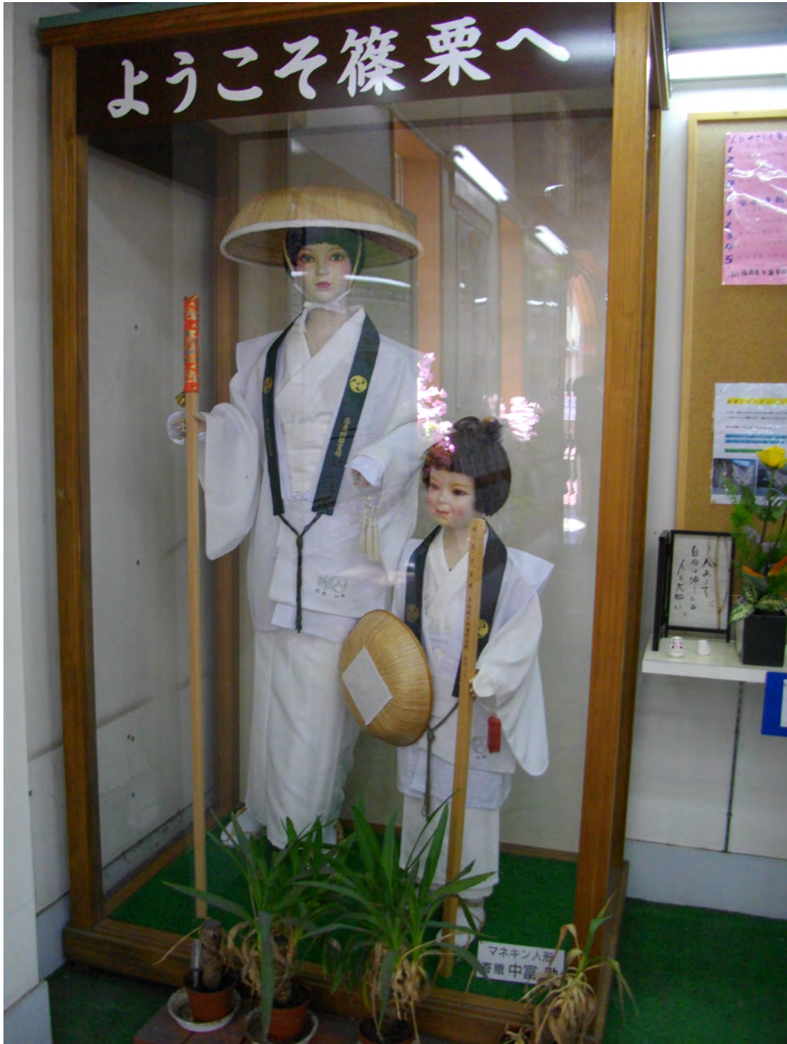
Photo 35 – Mannequins dans la salle d’attente de la gare de Sasaguri vêtus de l’habit traditionnel du pèlerin laïc