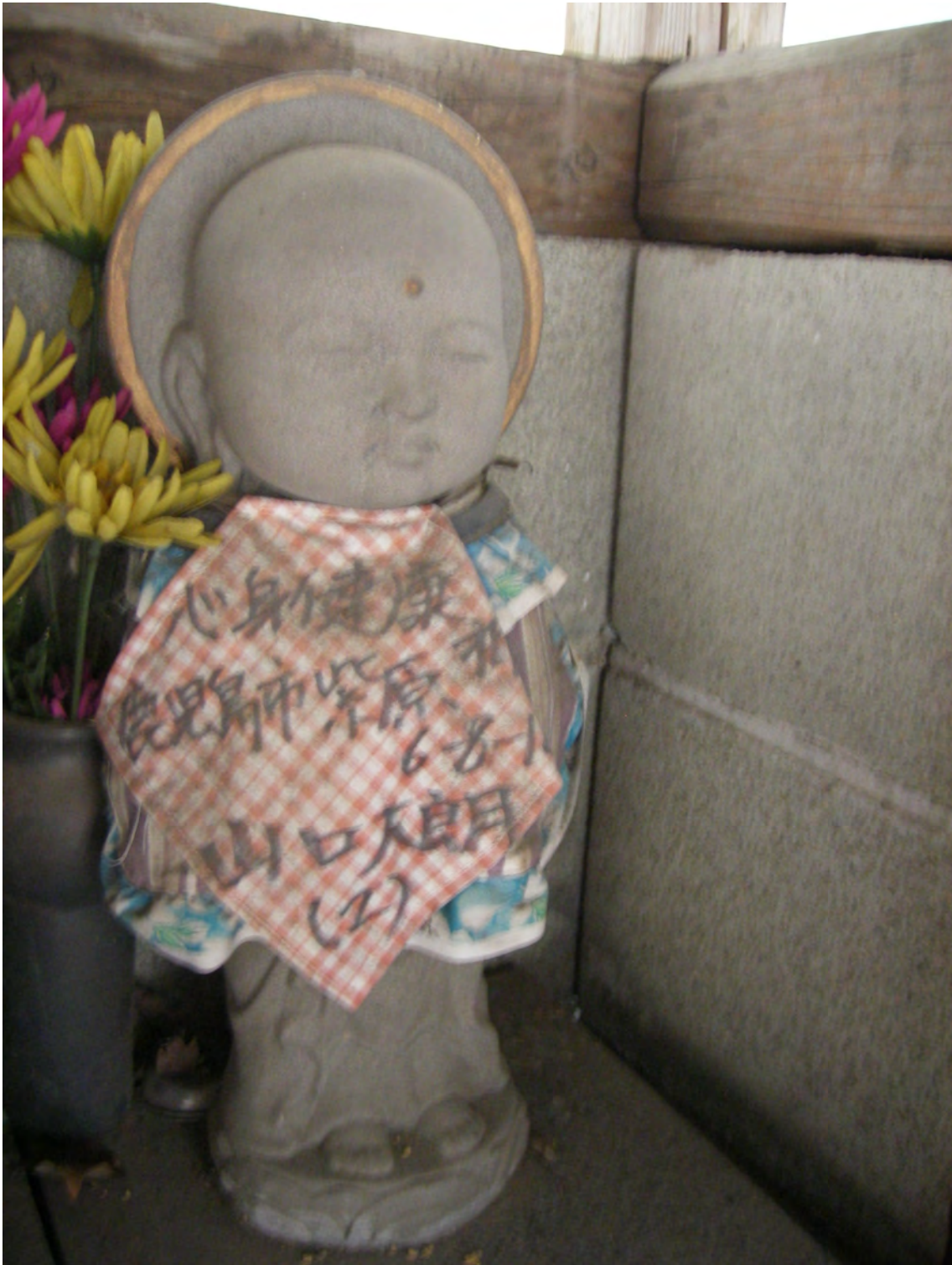
Photo 40 – Jizō vêtu d'un bavoir sur lequel est inscrit un vœu de santé pour un enfant de deux ans, portant le nom et l'adresse du donataire (mars 2008)