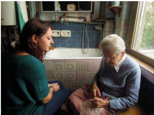
Fig.7 La segnatrice con una forbice inizia a tagliare alcuni piccoli pezzi di grasso