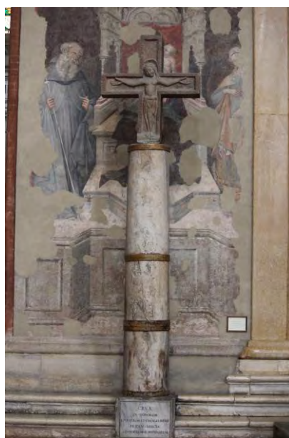
Figura 3 Una delle croci conservate all'interno della Basilica di San Petronio

Originariamente le croci si trovavano fuori delle quattro porte, le quali dovevano il loro orientamento ai punti cardinali.