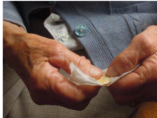
Fig. 17 La segnatrice prepara una garza che verrà fasciata intorno al braccio, di modo che il grasso possa rimanere a contatto con la pelle per qualche giorno, o ora, continuando ad agire