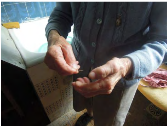
Fig. 20 Gli eczemi vengono segnati tracciando tre croci sulla pelle e una circonferenza, aperta da un lato