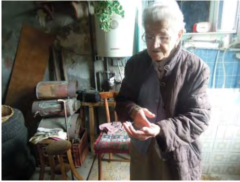
Fig. 5 La donna spiega che prima di segnare bisogna verificare se esiste una problematica a livello dei nervi, indagata attraverso una serie di pressioni sull'area dolorante