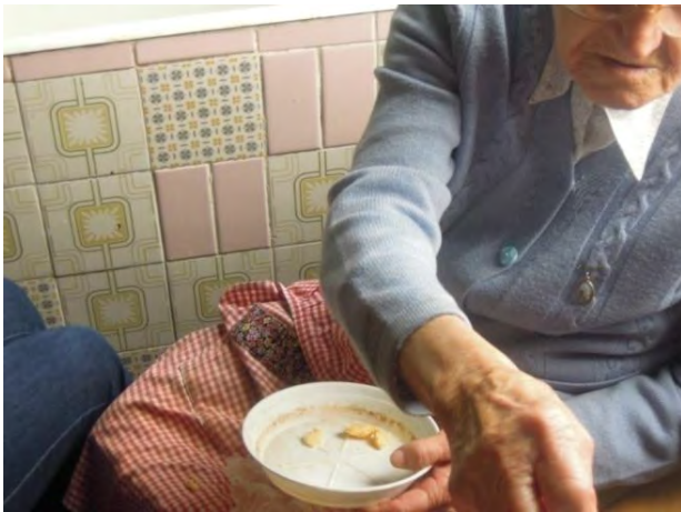
Fig. 12 I pezzi di grasso devono essere tre