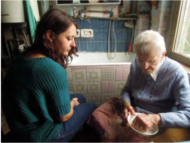
Fig. 11 Nel piatto contenente i pezzi più piccoli insieme all'acqua, la segnatrice manipola e ammorbidisce il grasso in modo da renderlo più fluido