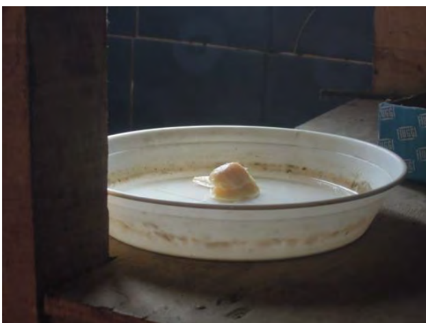
Fig.10 Il grasso viene posto in un piattino, a cui si aggiunge dell'acqua