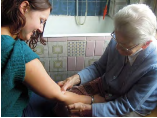
Fig. 14 La donna preme e mi chiede la conferma dei punti dove il dolore è più intenso