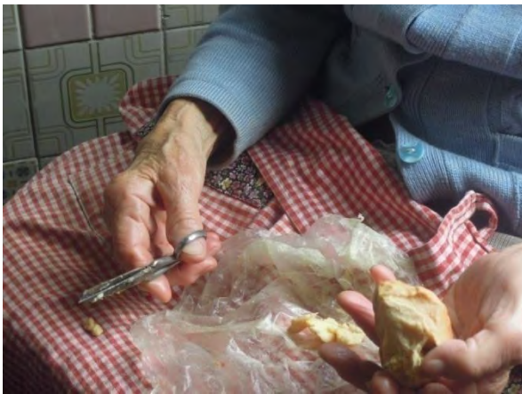
Fig. 9 La segnatrice separa dal blocco principale alcuni pezzi più piccoli di grasso, che manterrà divisi dalla parte restante