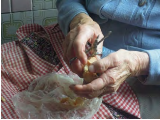
Fig. 8 Il grasso ha una consistenza corposa e un odore pungente: un tempo veniva preparato ogni anno durante il periodo autunnale, quando si uccideva il maiale per lavorarlo ottenendo i prodotti tipici di queste zone