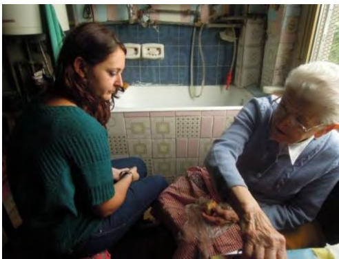
Fig. 6 Prima di segnare la segnatrice separa un pezzo di grasso da un blocco, preparato da lei stessa e utilizzato da circa quindici anni