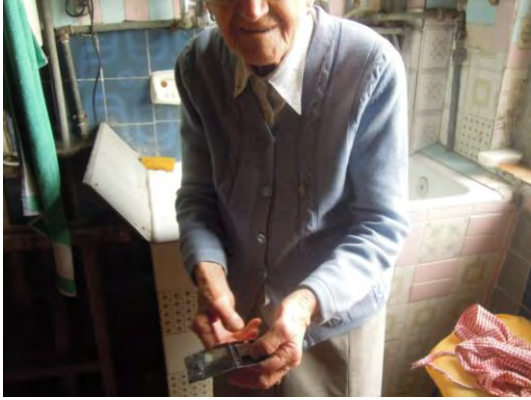
Fig. 18 La segnatrice mostra degli spilli, con i quali fin da ragazza ha imparato, dal nonno, a segnare gli eczemi