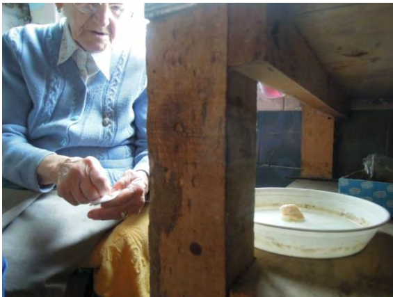
Fig. 16 Una volta terminato, la segnatrice avvolge un pezzo del grasso rimanente in una garza pulita