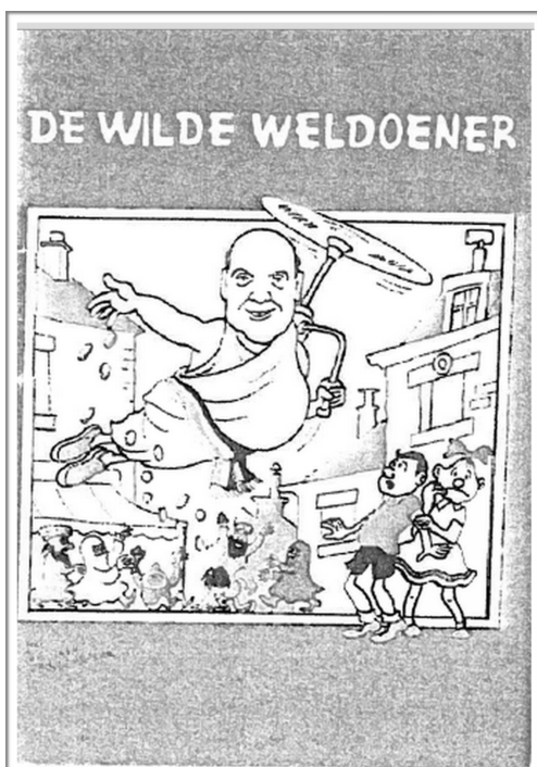
la parodia dell'originale "Suske en Wiske", raffigurante il sindaco di Ghent intento a distribuire fondi "a pioggia" agli immigrati

I fatti della causa sono legati al caso di un politico fiammingo di stampo chiaramente conservatore, il quale, per la festa organizzata l'ultimo dell'anno per i suoi sostenitori della città di Ghent fa distribuire biglietti di auguri chiaramente ispirati ad un fumetto che gode di una grandissima diffusione in Belgio ( Suske en Wiske ). Fino qui, nessun problema: il politico riproduce delle immagini al fine di farne una parodia, con il chiaro intento di offrire degli auguri di buon feste originali ai suoi commensali e sostenitori.