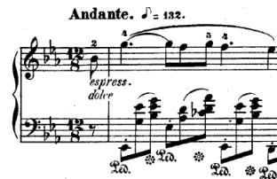
Opus 9 numéro 2, Chopin.

Merci, enfin, à celle que j'aime. Ces quelques notes exprimeront avec simplicité ce que je tairai par pudeur.