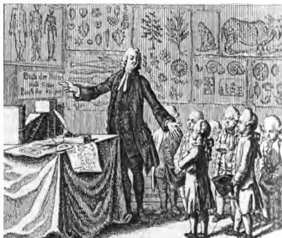
Cours dans le cabinet de curiosités. Illustration de Daniel Chodowiecki 813

Basedow est le premier à installer un cabinet d'histoire naturelle à destination des élèves à Dessau. En cela, il s'inspire du modèle de Francke à Halle, qui a ouvert, dès 1698, un cabinet de sciences naturelles à destination des élèves, repris ensuite par Semler en 1718 qui y adjoint des modèles réduits d'objets comme un moulin, un atelier de maréchal-ferrant. Dans le « Manuel Élémentaire » de Basedow, nous trouvons une illustration de celui-ci :