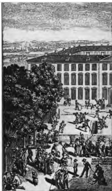
Idealentwurf des Dessauer Philanthropins, von D.N. Chodowiecki (1771) 443

manifeste que la place du latin est moins grande que dans la tradition humaniste puisque de nouvelles matières scientifiques ( Realien ) prennent le dessus. Le découpage de la journée en prévoyant l'alternance d'activités intellectuelles et physiques est en accord avec les observations de nos pédagogues sur l'énergie enfantine qu'ils avaient à canaliser et répond aux réflexions théoriques imposant un lien plus fort entre l'esprit et le corps, dont nous parlerons ultérieurement. Les activités physiques proposées sont nombreuses : jeux de balles, natation, escrime, danse, gymnastique, cerfs-volants, bataille de boules de neige, patinage, marche à pieds, comme on peut l'observer sur une gravure du dessinateur Chodowiecki qui avait imaginé, avant son ouverture, à quoi pourrait ressembler le Philanthropinum :