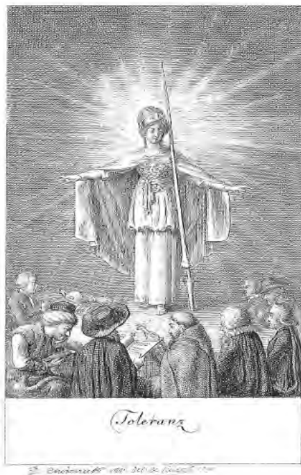
Toleranz, von D. N. Chodowiecki (1791). „Die Toleranz als behelme weibliche Gestalt mit einer Leuchtaure nimmt die Menschen aller Religionen unter ihren Schutz: Türken, Juden, Katholiken, Protestanten, Mennoniten, Quäker, Herrenbrüder, Chittosen.“

Ein jeder Lehrer oder Candidat der Pädagogie, oder Pensionist oder Famulant, oder Seminarist, ist uns also, ohne Unterschied der Kirche, gleich willkommen. 365