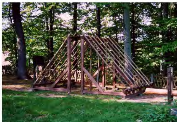
Abb. 6: Klettergerüst auf dem Schnepfenthaler Gymnastikplatz

Basedow proposait en outre certains exercices identiques à ceux pratiqués dans les académies militaires – équitation, escrime, danse, gymnastique – et la demande de parer à des dangers peut se comprendre en temps de guerre (fuir, combattre, éviter des coups). Il reste néanmoins le premier à Dessau à proposer des pratiques corporelles régulières confiées à un enseignant désigné pour l'éducation physique (Du Toit par exemple), avec des vêtements adaptés laissant le corps libre de ses mouvements, et en offrant quotidiennement des jeux imposés ou libres pendant la récréation. À Dessau furent installés par la suite balançoires, planches à bascule, jeux avec des cerceaux, jeux de tennis, de volant, de balle, de quilles. Puis, avec Du Toit, ce furent la natation, le patinage, le tir à l'arc, le jardinage, la marche, le travail sur le bois et des activités moins courantes comme celles de transporter de lourdes charges, marcher en équilibre, se suspendre à des échelles obliques.