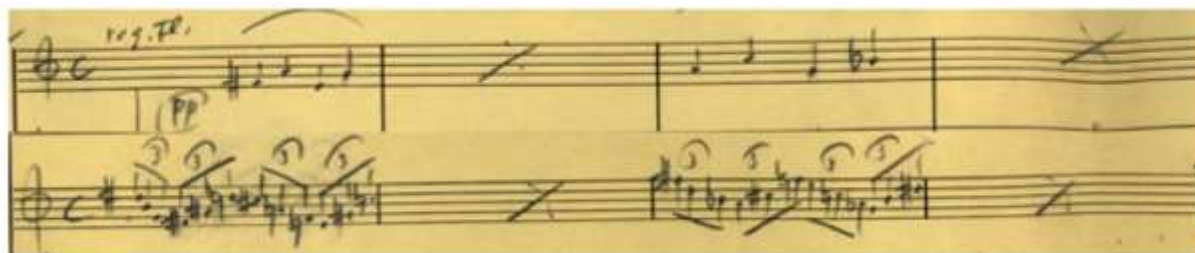
Ex. 14 Tempo de mar :

Nous constatons dans Choros n°10 du compositeur brésilien Heitor Villa-Lobos (ex. 15) une attitude compositionnelle pleine de similitudes. La manière d'organiser le modo dans