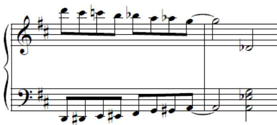
Ex. 11 :

Dans ce passage, la position éparpillée est représentée dans la distribution suivante des voix : les violoncelles sont doublés avec les contrebasses. A partir de la sixième mesure, les flûtes sont ajoutées dans un renversement de tierces, qui sont suivies à leur tour par un renversement dans la section des cordes, avec les violons. L'introduction se termine avec, dans le fond sonore, une texture dense de caractère de musique de chambre. Là aussi, ex. 12, nous allons connecter ce passage au langage compositionnel de Villa-Lobos. Son influence a été majeure sur l'œuvre de Jobim, car lui-même a plusieurs fois assumé une telle interférence dans sa création.