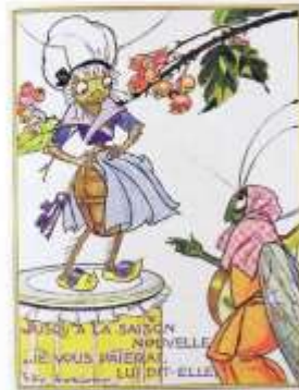
La Cigale et la Fourmi, Esor.

Pendant l'hiver, leur blé étant humide, les fourmis le faisaient sécher. La cigale, mourant de faim, leur demanda de la nourriture. Les fourmis lui répondirent : « Pourquoi en été n'amassais-tu pas de quoi manger ? – Je n'étais pas inactive 1 , dit celle-ci, mais je chantais mélodieusement 2 . » Les fourmis se mirent à rire. « Eh bien, si en été tu chantais, maintenant que c'est l'hiver, danse. » Cette fable montre qu'il ne faut pas être négligent 3 en quoi que ce soit, si l'on veut éviter le chagrin et les dangers.