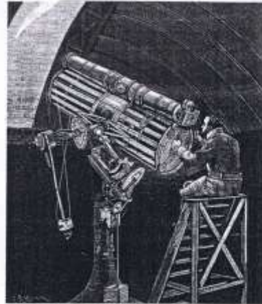
Astronome, gravure, 1882.