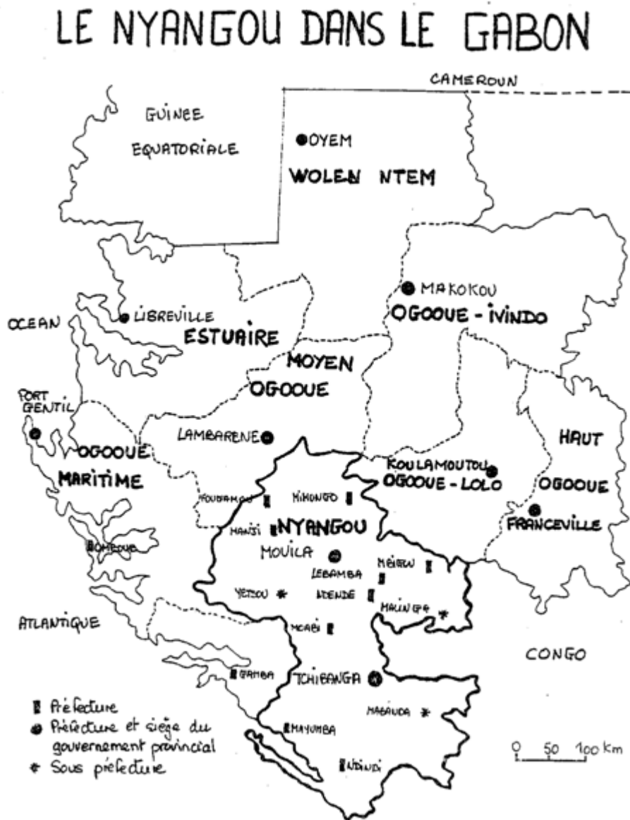
Carte 1 le Nyangou dans le Gabon

En somme, nous souhaitons par cette brève présentation du pays punu montrer le cadre dans lequel s'inscrivent nos devises. La carte ci-dessous présente le "Nyangou" dans le Gabon. Elle est réalisée par Kwenzi-Mickala dans sa thèse de doctorat.