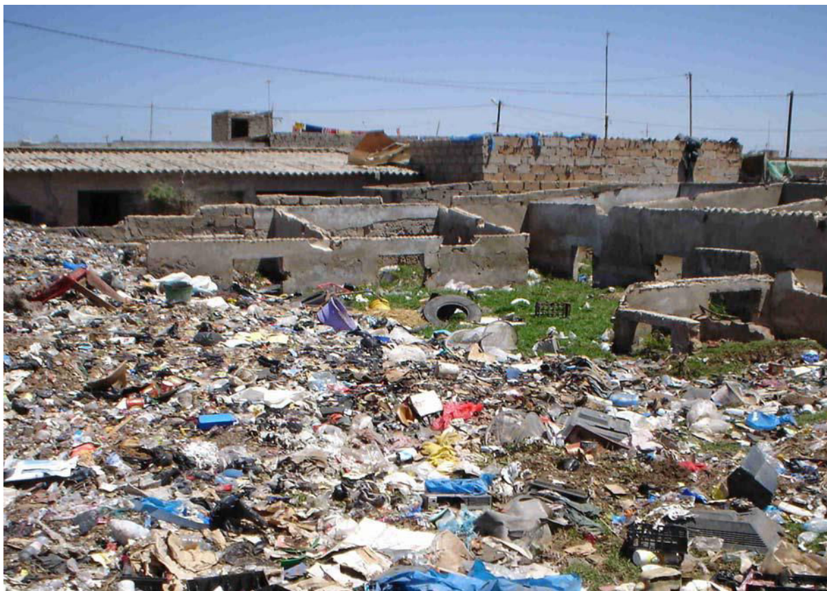
Photo : Agence française de développement (version provisoire) (2005), Profil environnemental des villes de Pikine et Guédiawaye . Programme d'Accra (2008), Forum à haut niveau , Dakar, République du Sénégal, la Coopération belge au développement, IAGU, UN-Habitat, http://www.afd.fr .