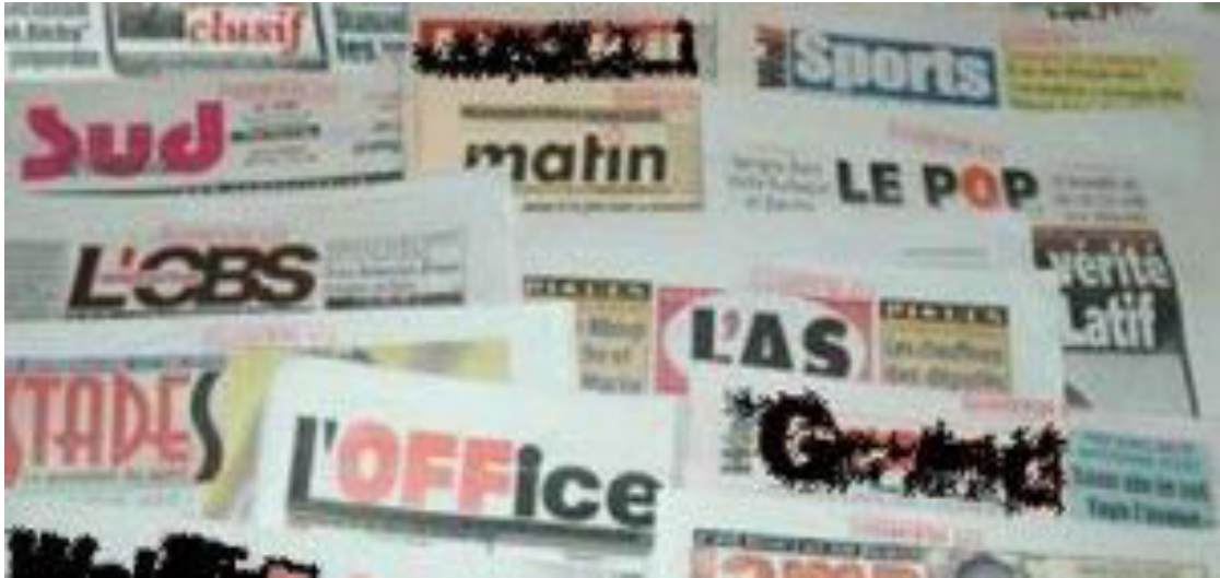
le 11 septembre 2006