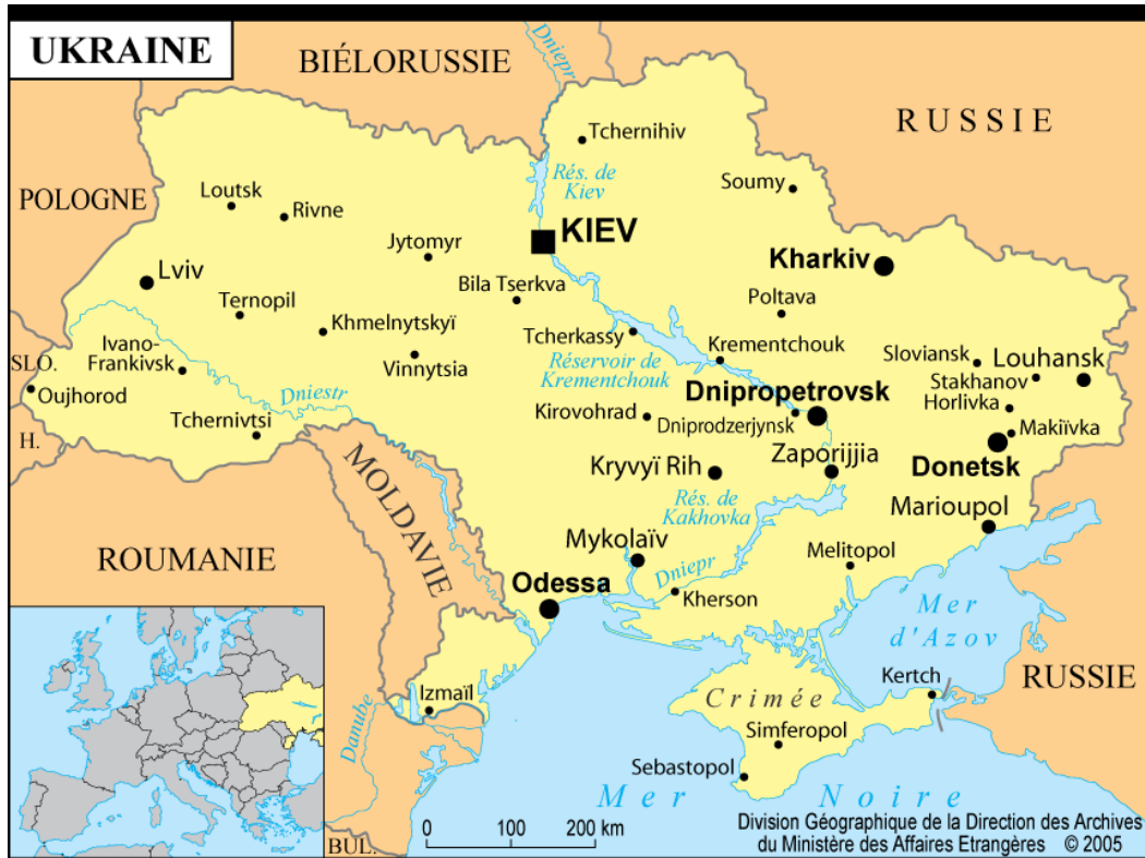
Figure 3. La carte des régions historiques de l'Ukraine 1 .