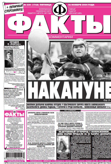
Figure 11. La Une de Fakty i kommentarii

Fakty i kommentarii (en français, Faits et commentaires) est le plus grand quotidien national édité en russe depuis 1997 par l'agence d'information Fakty qui fait partie d' Interpipe group dont le propriétaire est Viktor Pintchouk 14 .