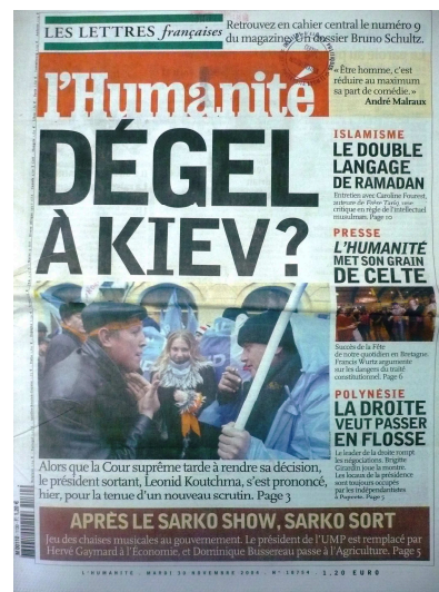
Figure 7. La Une de L'Humanité

Fondé en 1904 par Jean Jaurès, L'Humanité a été d'abord un quotidien politique socialiste. De 1920 à 1994 L'Humanité a été l'organe central du Parti communiste français. Dans une société capitaliste, le quotidien communiste a été édité depuis sa création par une société anonyme par actions. Celles-ci ont été attribuées par le parti à des détenteurs qui le représentaient. Le directeur politique du journal était nommé par le Comité central du PC en accord avec le directeur politique et les rédacteurs.