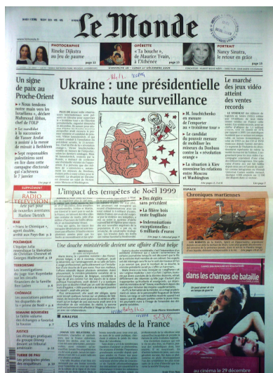
Figure 8. La Une du Monde

Le Monde a été fondé à la Libération en 1944 dans le contexte de la fermeture des journaux accusés de collaboration et celui de la nécessité d'une publication sérieuse et crédible à l'étranger, exprimée par Charles de Gaulle 7 . Le Monde a repris le format, les anciens locaux et un grand nombre des anciens journalistes du quotidien Le Temps , fermé car compromis sous le régime de Vichy. Le fondateur du Monde et son directeur jusqu'à 1969 a été Hubert Beuve-Méry, ancien correspondant à Prague du journal Le Temps , qui avait démissionné à l'époque de la conférence de Munich.