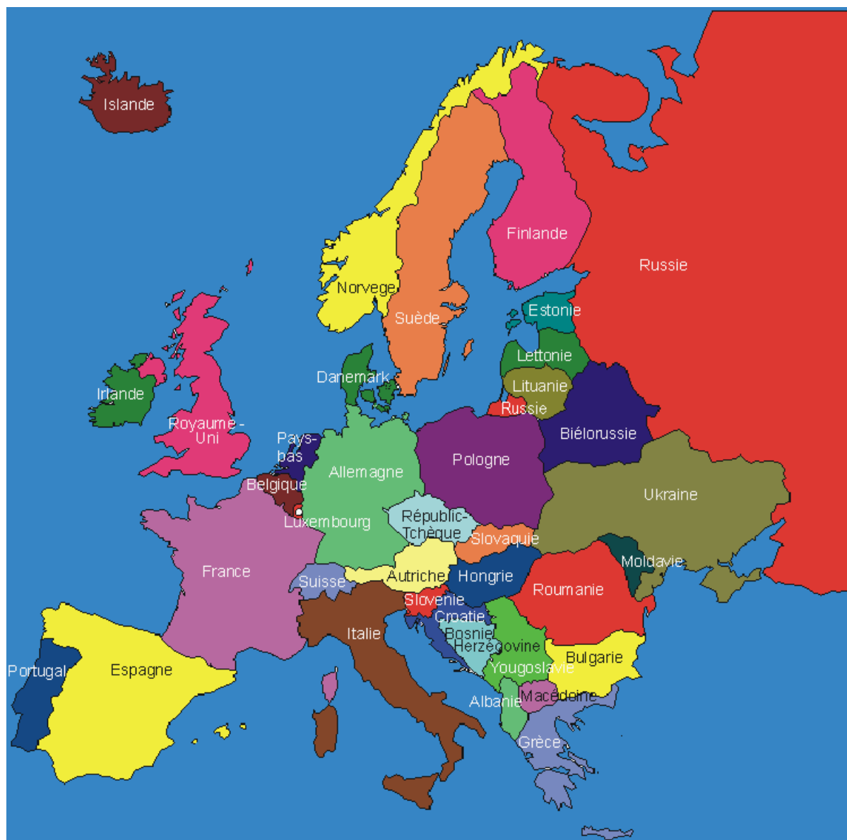
Figure 1. La carte de l'Europe