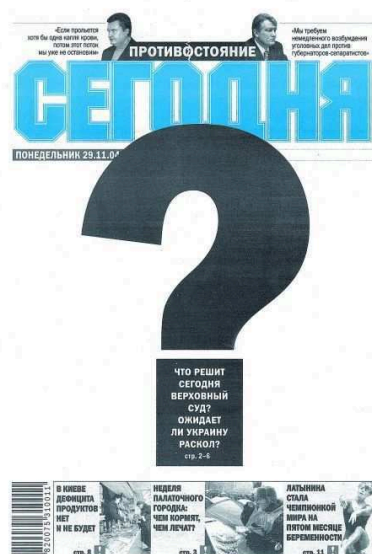
Figure 12. La Une de Segodnya

Segodnya (en français, Aujourd'hui) est un quotidien national d'information générale, publié en langue russe depuis 1997 par le groupe d'édition Segodnya Multimedia 16 qui fait partie de la société SCM Limited . 90% des actions de SCM Limited sont détenues par l'oligarque Rinat Akhmetov 17 et 10% par son épouse.