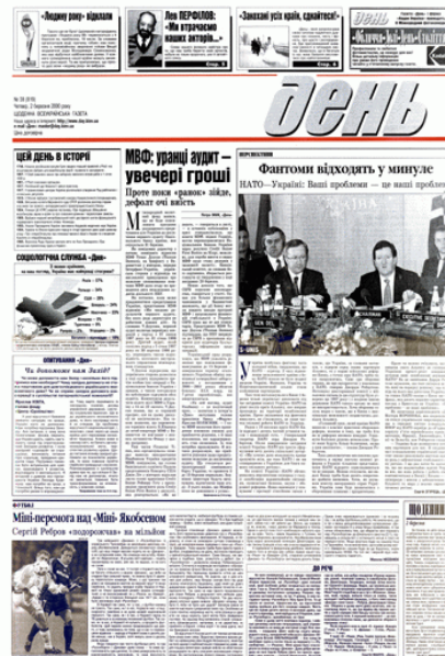
Figure 10. La Une de Den

Reconnu comme le meilleur journal de l'année 1997 dans le cadre du programme national « L'homme de l'année », il se veut le fer de lance de la nouvelle presse ukrainienne, plus professionnelle et plus critique. Le quotidien propose des nouvelles politiques, économiques, des débats de société, des analyses et des commentaires par des experts et scientifiques renommés. Den accorde une attention particulière à l'histoire. Il publie une collection des ouvrages historiques Bibliothèque du journal Den : Ukraine Incognita et Deux Rus' . Les illustrations occupent également une place importante dans ce journal qui depuis 1999 organise des concours internationaux de photographie. L. Ivshyna 12 , fondatrice et rédactrice en chef du quotidien voit son journal comme le moyen de sensibilisation de la population à l'histoire, la culture, aux normes démocratiques et libérales de l'organisation de la société : « Il me semble que nous sommes passionnés par une idée noble et importante : forger un peuple à partir d'une population disparate...Il faut dire aux gens la vérité. Celle-ci consiste dans le fait que nous n'avons pas respecté des « règles de conduite » élémentaires...Et les