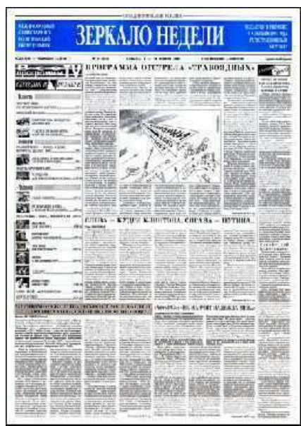
Figure 13. La Une de Zerkalo nedeli