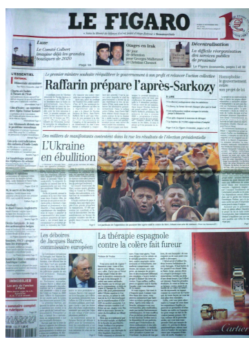
Figure 6. La Une du Figaro

Le Figaro est le plus ancien des quotidiens français d'aujourd'hui 6 . Plusieurs journaux intitulé Figaro (avec ou sans article) paraissait de manière irrégulière entre 1826 et 1854. En 1854, Hyppolyte de Villemessant a repris le titre et en a fait un quotidien politique. Le premier numéro du Figaro a apparu le 16 novembre 1866. Dès 1880, Le Figaro s'est rallié à la République et a attiré les grandes plumes de l'époque comme Zola, Daudet, Mallarmé, Renard ou Maupassant. Pourtant, l'affaire Dreyfus a porté un rude coup au journal dont le lectorat traditionnel n'acceptait pas le soutien que Le Figaro apportait au capitaine : le nombre des abonnements a chuté. Racheté par le parfumeur milliardaire François Coty en 1922, le journal a pris des positions fascisantes qui ont considérablement diminué son lectorat. La direction confiée à Pierre Brisson depuis 1934 a permis au Figaro de retrouver une certaine splendeur et d'attirer des intellectuels de renom comme François Mauriac, Thierry Maulnier et bien d'autres. Le journal a cessé de paraître en 1942. Sans cela il n'aurait pas pu réapparaître en 1944, à la Libération. Depuis 1944, le Figaro a connu une série d'évolutions, fusions, et alliances. Il est aujourd'hui une filiale de la Socpresse, fondée par R. Hersant, dont le propriétaire est l'industriel Serge Dassault.