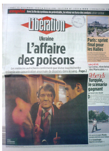
Figure 9. La Une de Libération

Né en partie du mouvement maoïste La Gauche prolétarienne en 1973, le quotidien Libération a été précédé d'une Agence de presse Libération (1971), soutenue par Jean-Paul Sartre et Maurice Clavel. Dans ses débuts le journal était « libéral-libertaire », selon la formule de Serge July, qui entendait être une source d'information alternative, provenant des militants et des citoyens, un lieu de débat de société et de débats de politique internationale. Des tensions au sein de la rédaction du journal dans la première décennie de son existence se sont terminées par le lancement d'une nouvelle version du journal en 1981, trois jours après l'élection de François Mitterrand comme président de la République. Libération , devenu plus culturel et sociétal et moins militant s'est ouvert à la publicité et au capital des industries. Il a connu à l'époque une forte croissance. En 1994, une nouvelle version du journal a été lancée pour concurrencer Le Monde , remédier à la baisse des ventes et renouveler le lectorat. Cependant, elle n'a pas eu de succès. En 2005, le banquier Edouard de Rothschild est devenu l'actionnaire de référence de l'ancien quotidien maoïste. Sous la pression des actionnaires, Serge July, directeur de Libération depuis sa fondation, ainsi que plusieurs figures historiques du journal ont quitté la rédaction en 2006.