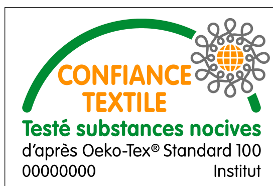
Standard OEKO-TEX 100

OEKO-TEX est une marque internationale protégée légalement, d'où son caractère privé. C'est pourquoi tout prétendant à la certification, doit observer nécessairement les prescriptions de bases formelles de OEKO-TEX Standard 100. Des certifications sont possibles à tous les niveaux de la filière textile. Des certificats à des stades préliminaires sont aussi reconnus au même titre que le certificat final, c'est à dire toutes les composantes, y compris les accessoires comme les rivets, les boutons, les fermetures, doublures, doivent remplir les critères de contrôles requis par le label. Un contrôle de certification satisfaisant permet alors aux firmes d'utiliser le label OEKO TEX 100 pendant une période donnée. Au-delà de cette période des nouveaux contrôles de certification sont obligatoires en vue de la prolongation du label OEKO-TEX 100.