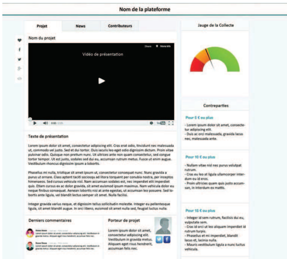
FIGURE 1 – Maquette synthétique des pages de projets.

Comme on peut le voir dans l'exemple reconstitué dans la Figure 1, la page du projet permet aux internautes d'avoir le maximum d'informations possibles sur le projet (vidéo et texte de présentation), sur celui qui le porte et sur le déroulement du projet lui-même. Les présences sur le web du porteur de projet (compte sur les réseaux sociaux ou adresse mèl par exemple) ainsi que son historique sur la plateforme (autres projets proposés ou soutenus) sont ainsi accessibles à l'internaute. De même, les « pages projet » permettent à l'internaute de voir le stade de la collecte (jauge de la collecte) mais également de se rendre compte de l'investissement d'autres internautes. Une section permet ainsi aux personnes ayant contribué de laisser un commentaire et l'ensemble des sites permet de voir combien de personnes ont opté pour chaque contrepartie.