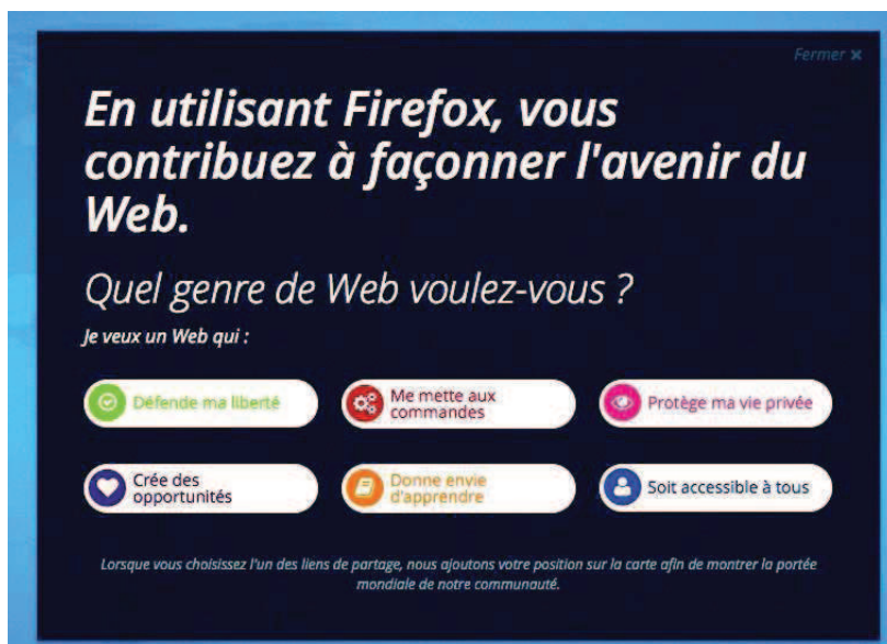
FIGURE 2.1 – Capture d'écran Mozilla

réalisée depuis le site : https://webwewant.mozilla.org/fr/?icn=tabz , 14 juillet 2014.