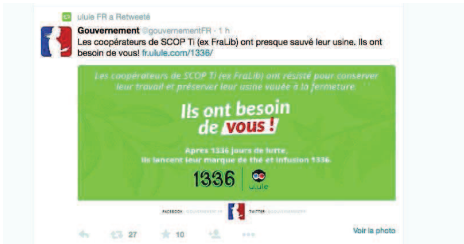
FIGURE 5.2 – Message court, 22 juillet 2015.

le compte officiel du gouvernement français sur un réseau social (Figure 5.2).