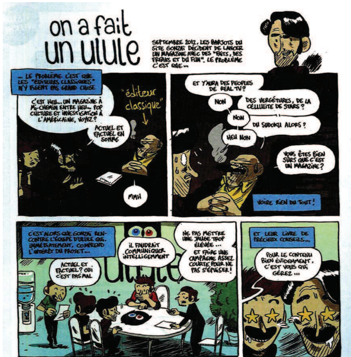
FIGURE 4.1 – « On a fait un Ulule »