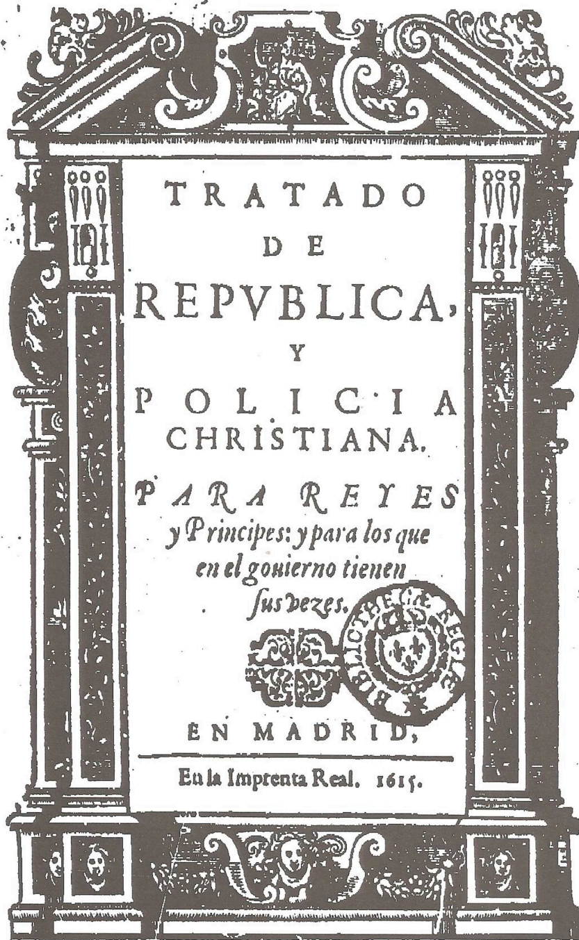
Page de titre de M 1615.