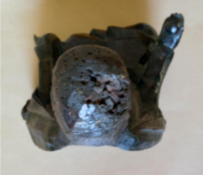
Fig. 24a Virgen con Niño. Navarra. Siglo XIII. MNAD. Cat. N° 6. Perspectiva superior.