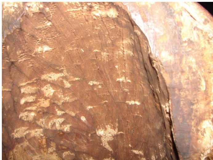
Fig. 3. Virgen y Niño. Álava. MNBA. Detalle de la oradación del dorso.