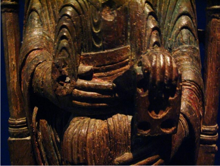
Fig. 1a Virgen y Niño. Auvernia. MNBA. Detalle