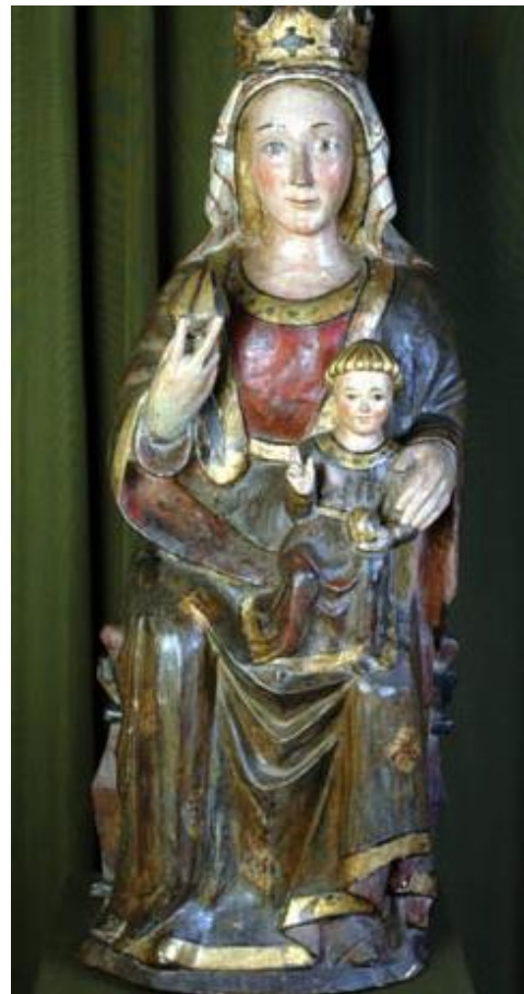
Fig. 34. Virgen y Niño. Museo de Arte Español Enrique Larreta.