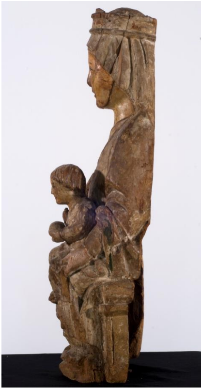
Fig. 8. Virgen y Niño. Burgos. MNBA. Vista del lateral izquierdo.