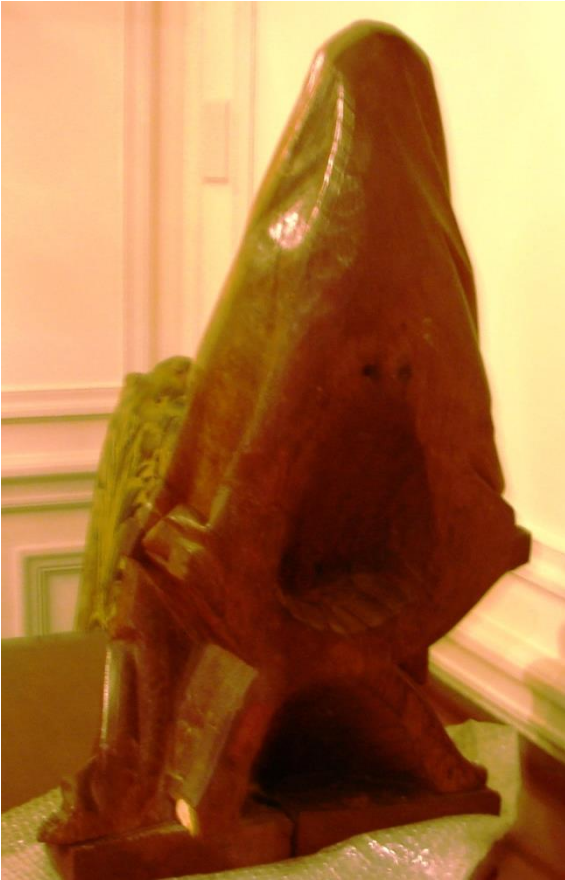
Fig. 6. Virgen y Niño. Flandes. Vista del dorso.