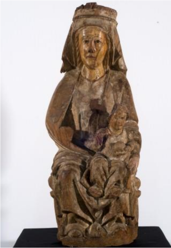
Fig. 30. Virgen y Niño. MNBA