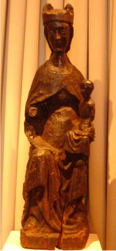
Fig. 37. Virgen y Niño. Museo de Arte Español Enrique Larreta.