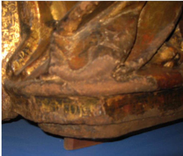
Fi. 9 Virgen y Niño, Álava, MNBA. Detalle de la inscripción.