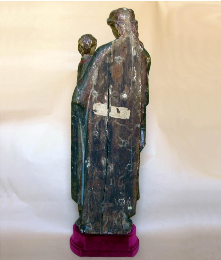
Fig. 2. Virgen y Niño. MNAD. Vista del dorso.