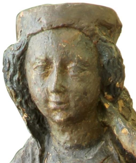
Fig. 56. Virgen y Niño. Casa Museo Quinquela Martín. Detalle.