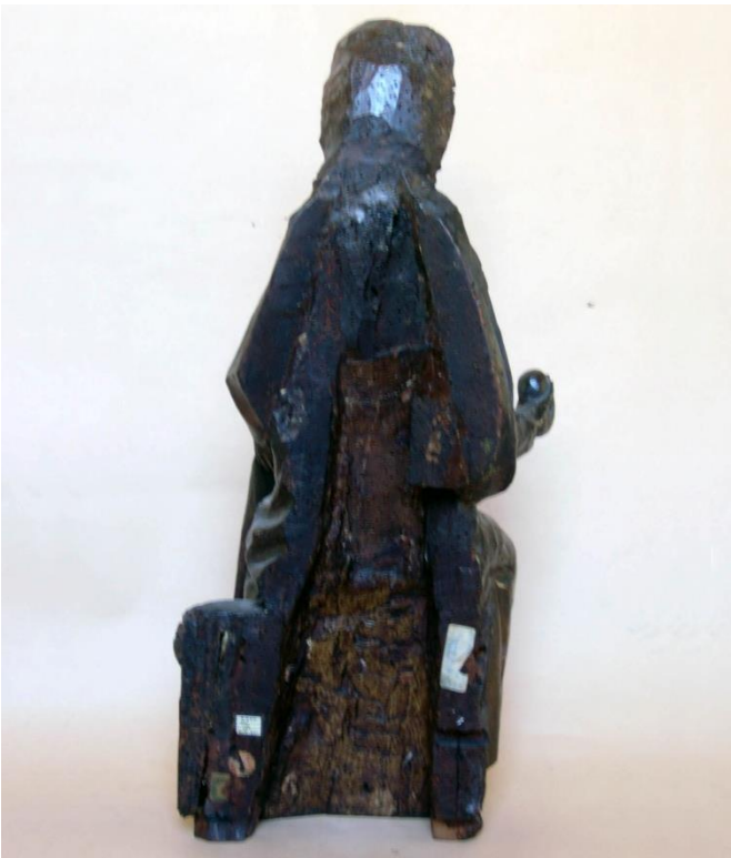
Fig. 5. Virgen y Niño. Navarra. MNAD. Vista del dorso.