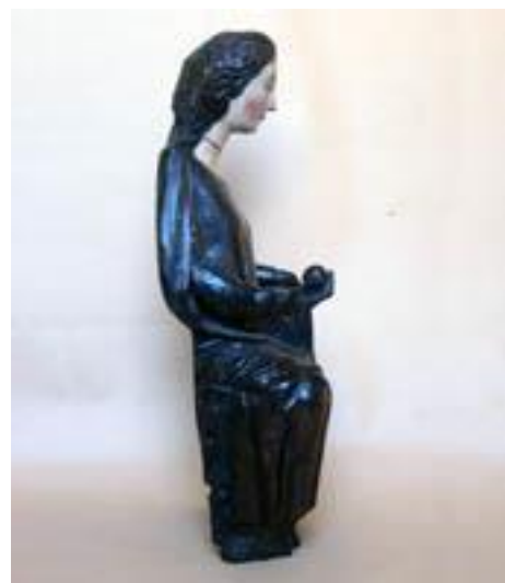
Fig. 7. Virgen y Niño. Navarra, MNAD. Vista del lateral derecho.