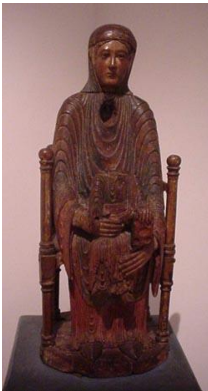
Fig. 1. Virgen y Niño, Auvernia, MNBA. Cat. N°1 .Fotografía de Clelia Pizerchia.