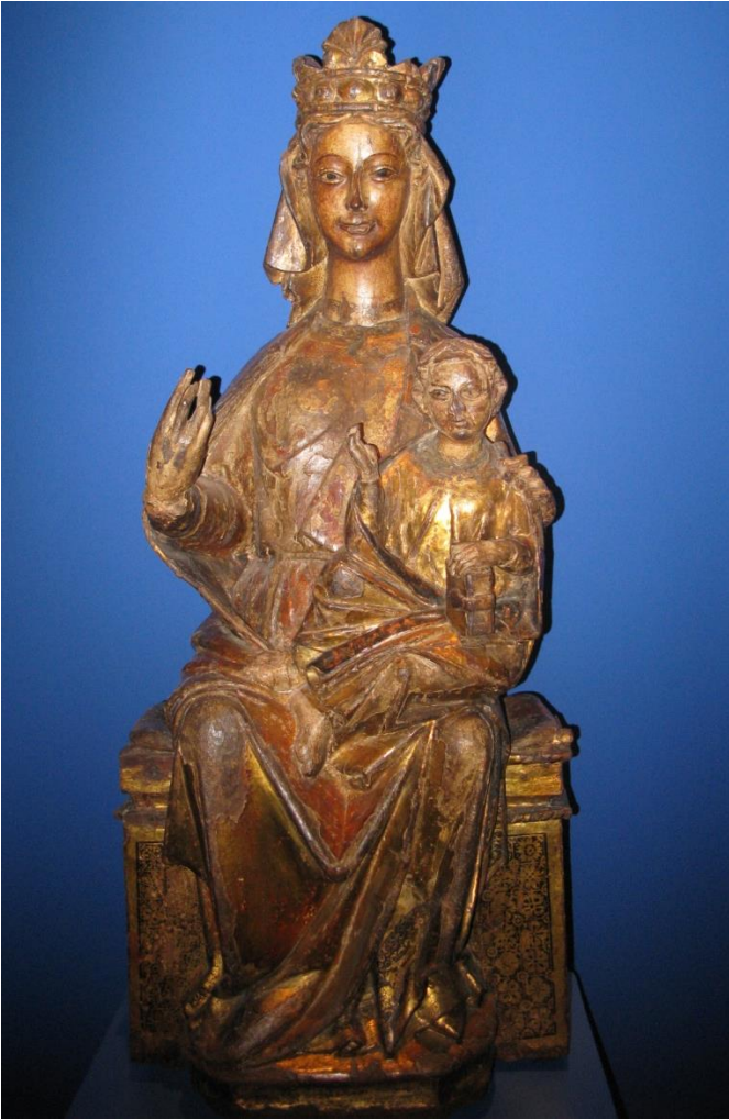
Fig. 25. Virgen y Niño. MNBA