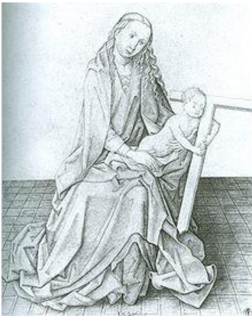
Fig. 49. La Madonna sentada y el Niño llevando la cruz. Maestro I. A. M. de Zwolle. Museo de Arte de Cincinnati.