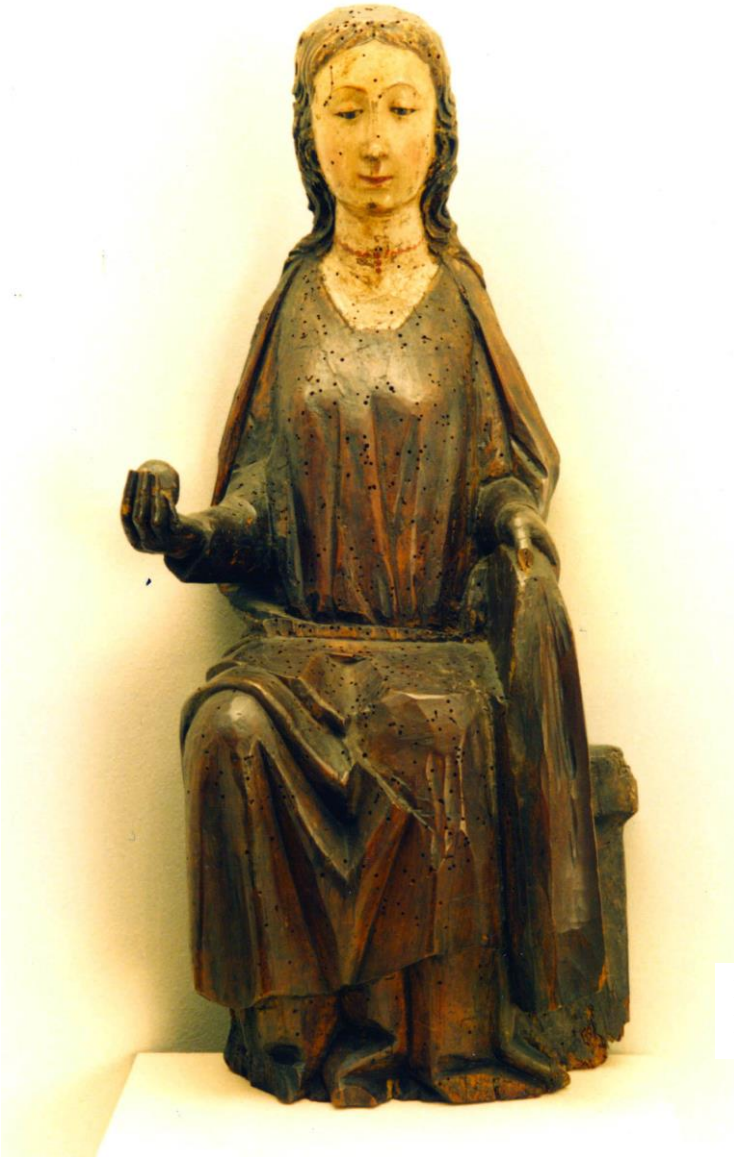
Fig. 21 Virgen y Niño. MNAD.