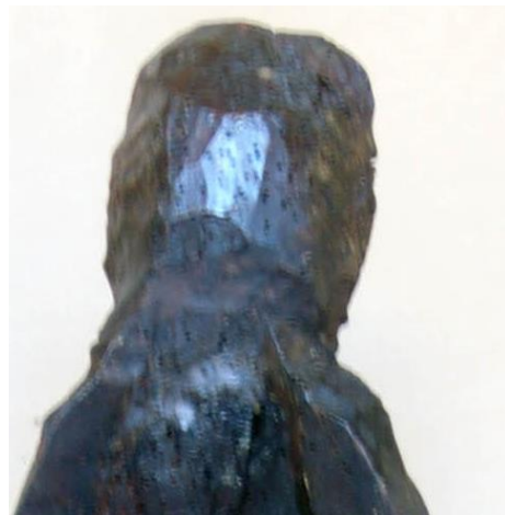
Fig. 24c. Vista posterior. Detalle.