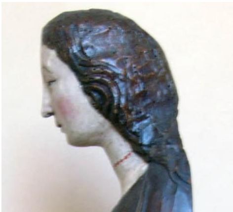
Fig. 24b. Vista del lateral izquierdo. Detalle.