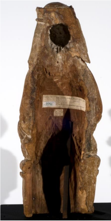
Fig. 4. Virgen y Niño. Burgos. MNBA. Vista del dorso.