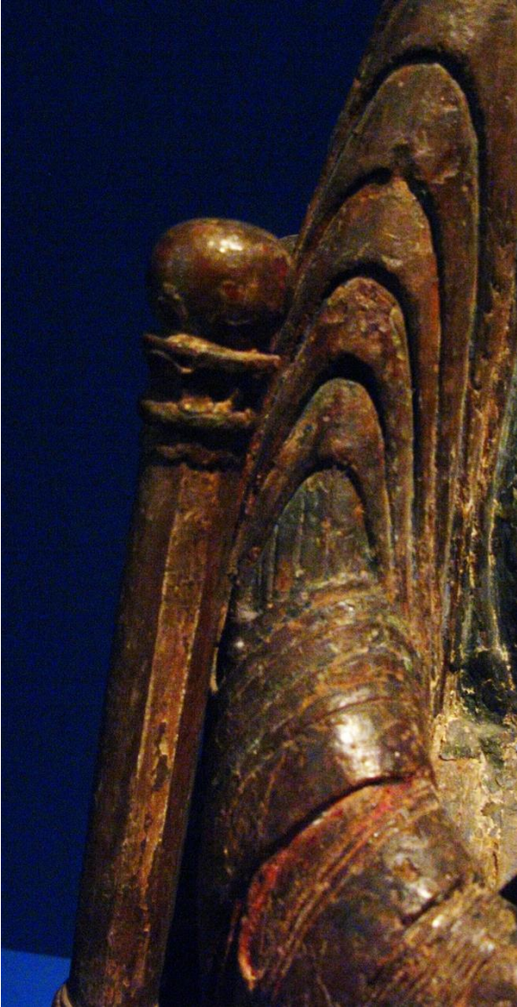
Fig. 5. Madonna del MNBA. Detalle del trono