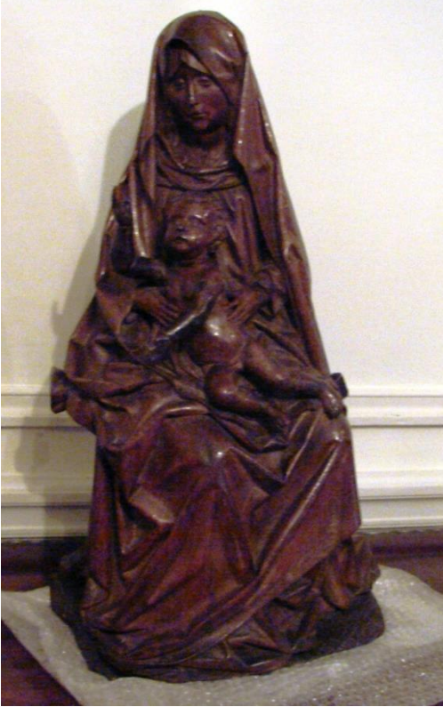
Fig. 47. Virgen y Niño. MNAD