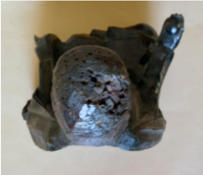
Fig. 24a Virgen con Niño. Navarra. Siglo XIII. MNAD. Cat. N° 6. Perspectiva superior.