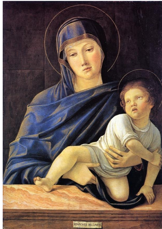
Fig. 48. Virgen y Niño. Giovanni Bellini, Accademia de Carrara, Bérghamo.