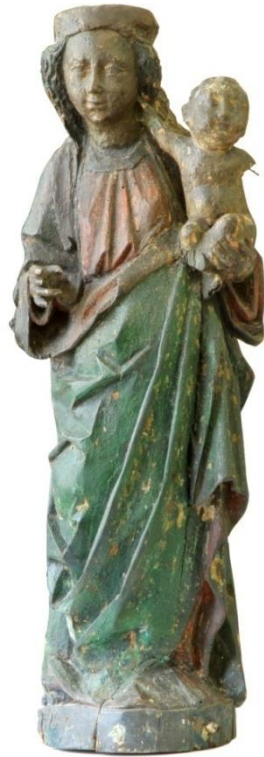
Fig. 50. Virgen y Niño. Casa Museo Quinquela Martin.