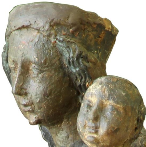
Fig. 53. Virgen y Niño. Casa Museo Quinquela Martin. Detalle.