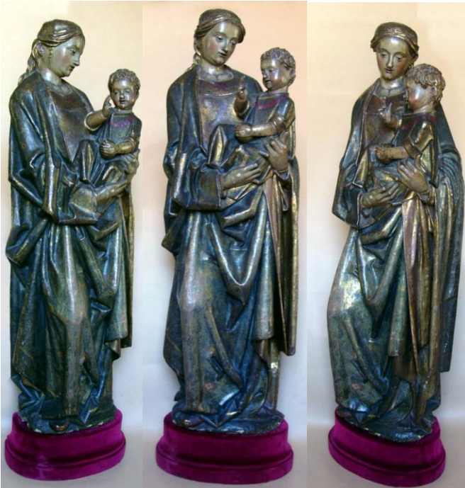
Fig. 40. Virgen y Niño. MNAD. Vista de tres cuartos lado izquierdo, frontal y tres cuartos del lado derecho.