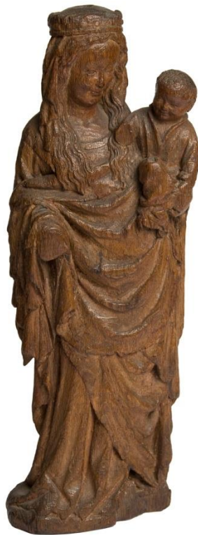
Fig. 41. Virgen y Niño. MNAD