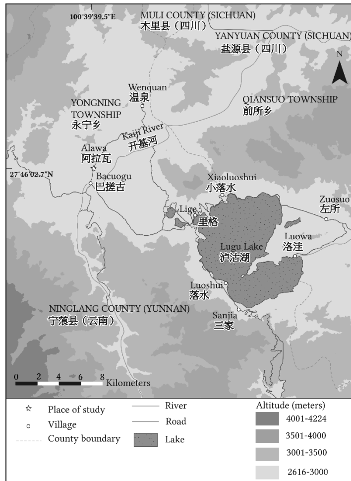
Carte de Yongning, réalisée pour la monographie à paraître en 2017.

Après de courtes enquêtes aux villages naxi de Wenhua (visité en 2002), Guifeng et Fengke (visités en 2004), je me suis rendu en 2006 au village de Yongning, lieu plus excentré que la tradition linguistique chinoise inclut à l'intérieur du domaine de la langue « naxi » au sens large (Hé & Jiāng 1985). L'idée était d'obtenir une meilleure vue d'ensemble de la diversité dialectale du naxi et des langues qui sont ses plus proches parentes, en élargissant l'enquête à des dialectes qui n'ont pas été en contact régulier avec la langue naxi de la ville de Lijiang, centre administratif et politique de la région naxi depuis au moins sept siècles. Comme le montre la carte ci-dessous, la plaine de Yongning est située en haute altitude (au-dessus de 2 600 mètres ; la localité d'enquête est située à une altitude de 3 000 mètres), et est particulièrement enclavée.