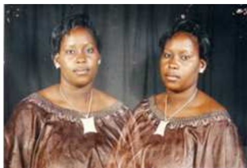
104. Sans titre, 1999, double exposition couleur, 10 x 15 cm, coll. de l'auteur