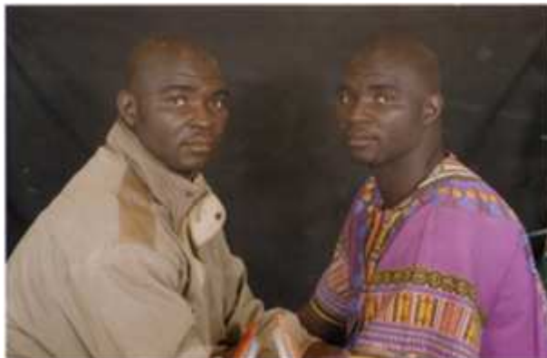
172. Sans titre, 2003, double exposition couleur, 10 x 15 cm, coll. de l'auteur