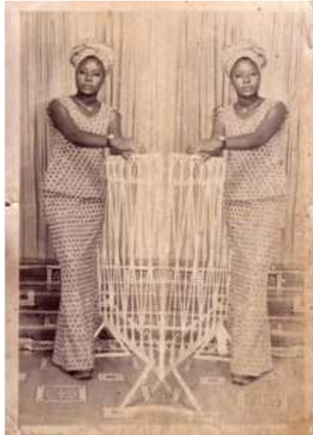
193. Foto venavi , 1974, double exposition argentique, 10,5 x 14,5 cm, coll. de l'auteur