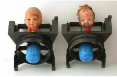
175) Ernest Dükü ( date de naissance inconnue), Amatafrika " Will be Back ", 2003, , technique mixte, 152 x 80 cm coll. de l'artiste