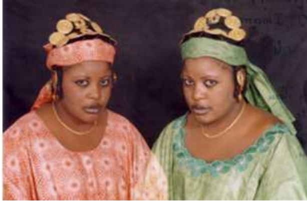
173. Sans titre, 1974, double exposition couleur, 9 x 14 cm, coll. de l'auteur