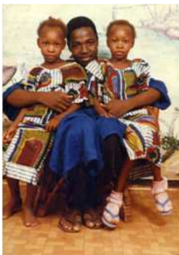
98. Sans titre, 2001, tirage couleur, 10 x 15 cm, coll. de l'auteur