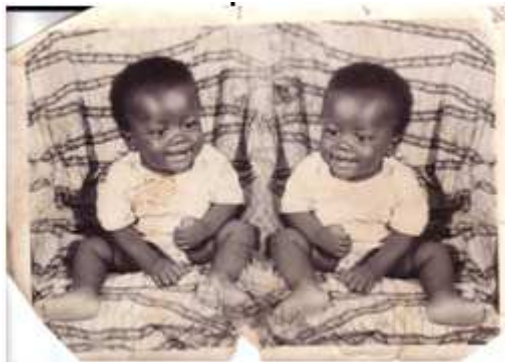
55. Flani foto , 1978, photomontage argentique 18 x 24 cm, coll. de l'auteur