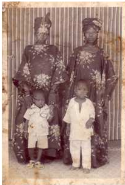
97. Sans titre, 2001, tirage couleur, 10 x 15 cm, coll. de l'auteur