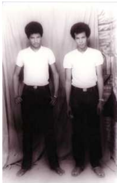
176. Sans titre, 1974, tirage noir et blanc, 9 x 14 cm, coll. de l'auteur