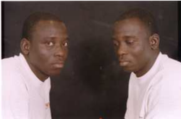
171. Sans titre, 1974, double exposition couleur, 9 x 14 cm, coll. de l'auteur