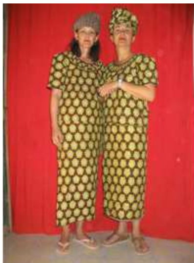
31) Cache en demi-lune du photographe Baté Dembélé pour la réalisation de doubles expositions, posé sur son double autoportrait, 2003, Ségou