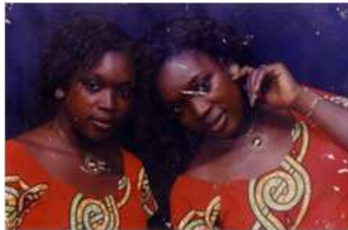
103. Sans titre, 2002, double exposition couleur, 10 x 15 cm, coll. de l'auteur