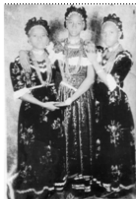
13) Moutaga Dembele, Sans titre , 1935, Bamako, dimensions et tirage inconnus, (in Anthologie de la photographie africaine , p. 107.)

Les doubles portraits: présentation des portraits doubles et des portraits doublés