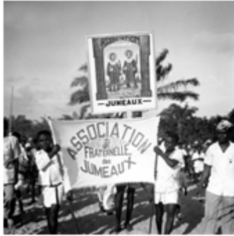
86) Folly Koumoughan, Cérémonies des Ghin , Togo, 2003, dimensions variables, tirage couleur, coll de l'artiste