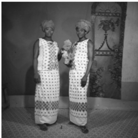
82. Tabaski , 1984, négatif 6x6 noir et blanc scanné