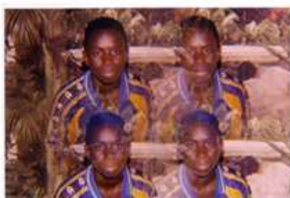
33) Moussa Coulibaly, Sans titre, 2003, Mopti, photomontage couleur, 10 x 15 cm., coll. de l'auteur