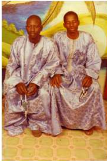
95. Sans titre, 1997, tirage couleur, 10 x 15 cm, coll. de l'auteur