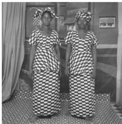
73. Sans titre, 1975, négatif 6x6 noir et blanc scanné