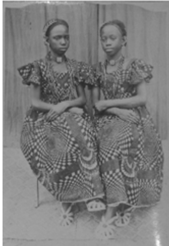
15) Samuel Fosso, Le chef (série Tati) , 1997, tirage couleur, dimensions inconnues, coll. Privée, (in Bonetti , 2004, p.147)