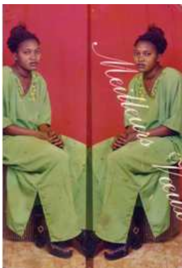
Bakary Emmanuel Daou Studio "Photo-nature"

100. Sans titre, 2000, reproduction numérique d'un tirage couleur, 10 x 15 cm, coll. de l'artiste