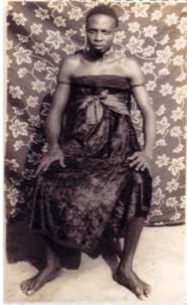
22) Zinsu Cosme Dosa, Photo mortuaire d'une vieille femme , 1997, Porto Novo, tirage argentique, 10,5 x 17,5 cm, coll. de l'auteur