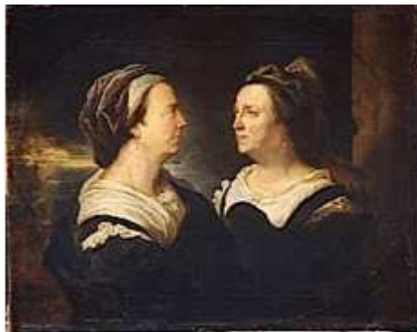
38) Inconnu, Les Tétrarques , IVe siècle, porphyre rouge, dimensions inconnues, Piazza San Marco, Venise