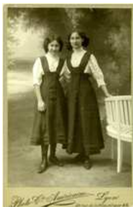
123) F. L. Huff, sans titre, circa , 1900, Newark, N.J., tirage au bromure, 11 x 16,5 cm, coll. de l'auteur