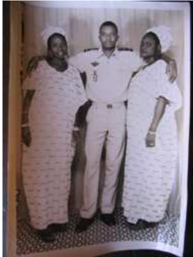
68. Sans titre, 1980, négatif 6x6 noir et blanc scanné, coll. Sory