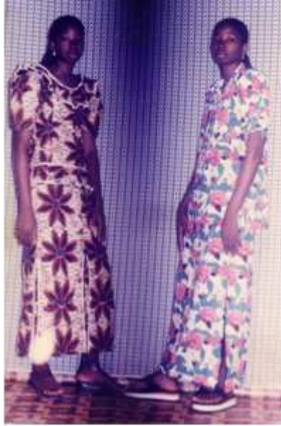
Guy Roland Fingers Photo

49. Autoportrait , 2000, double exposition couleur, 12,5 x 8 cm, coll. de l'auteur