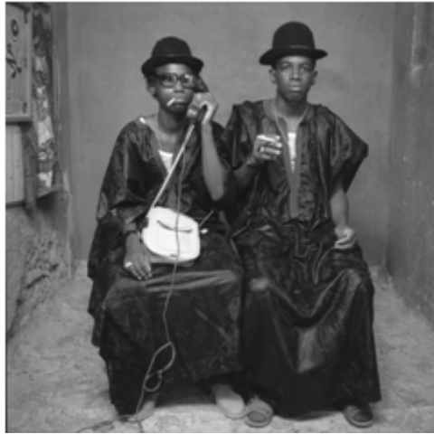
135. Coépouses , 1979, négatif 6x6 noir et blanc scanné, coll. Shitou