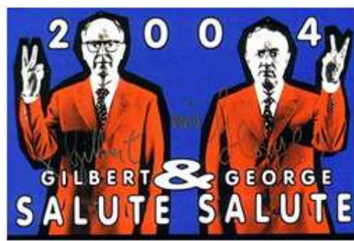
53) Jean-Luc Godard (né en 1930), Le Mépris , 1963, photographie numérique d'un écran vidéo