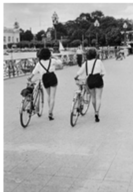
50) Henri Cartier-Bresson (1908-2004), Athènes , 1953, tirage argentique, 27,2 x 39,7 cm, coll. FCB