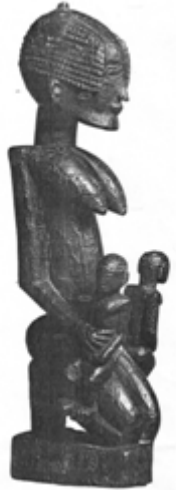
99) Statue tellem, Dogon, Mali , bois recouvert d'une épaisse patine sacrificielle croûteuse, h. 20 cm, coll. particulière (in Leloup, 1994, planche n° 63)