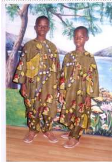
9. Sans titre, 1979, tirage argentique, 9 x 14 cm, coll. de l'auteur