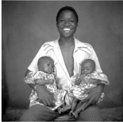
146. Sans titre, 1975, négatif 6x6 noir et blanc scanné