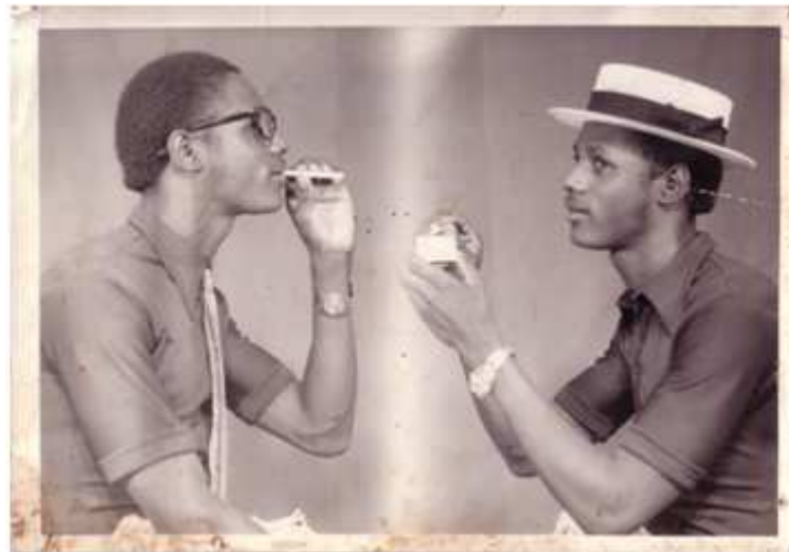
64. Sans titre, 1977, tirage argentique, 12,7 x 17,7 cm, coll. de l'auteur