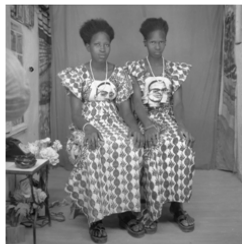
151. Tabaski , 1987, négatif 6x6 noir et blanc scanné, coll. Shitou