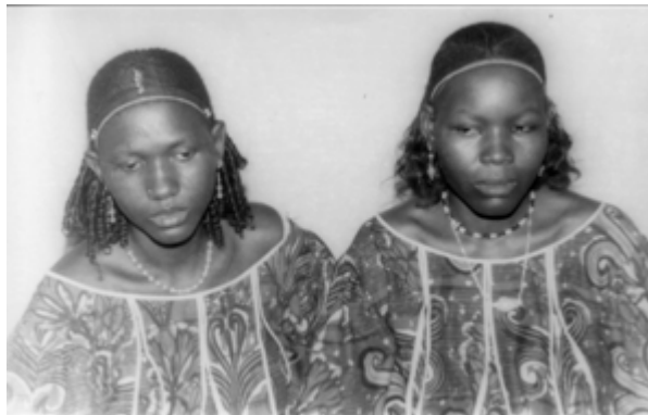
178. Sans titre, 1974, tirage noir et blanc, 9 x 14 cm, coll. de l'auteur