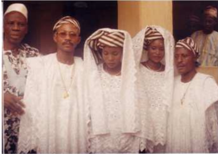
35. Les jumeaux , 1994, tirage couleur, 13 x 8,5 cm, coll. de l'auteur