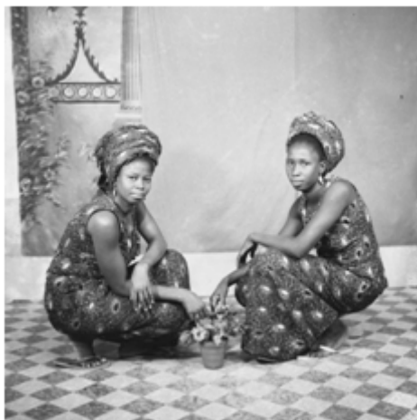
70. Deux tendres amies , 1970, négatif 6x6 noir et blanc scanné, coll. Sory