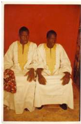
154. Sans titre , 1993, tirage couleur, 10 x 15 cm, coll. de l'auteur