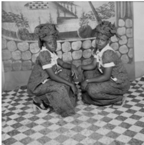
72. Coépouses , 1984, négatif 6x6 noir et blanc scanné, coll. Sory