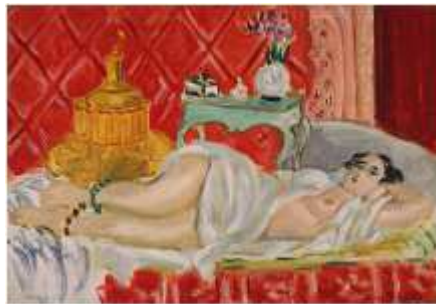
143) Henri Matisse (1869-1954), Odalisque au coffret rouge , 1926, huile sur toile, 50 x 65 cm, Musée matisse Nice