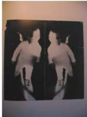
61) Dennis Adams (né en 1948), The Archive, Washington DC , 1990, photo couleur, infographie, éclairage fluorescent, plexiglas, duratrans, 610 x 724 x 1095 cm, Hirschhorn Museum Washington.