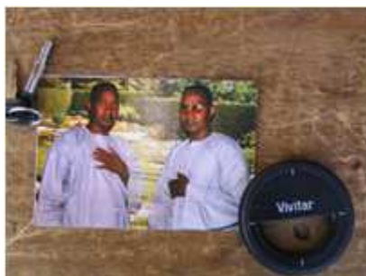
32) Souleymane Goïta, sans titre, 2002, tirage couleur, 10 x 15 cm, coll. de l'auteur.