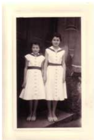
125) Inconnu, French Twin Sisters , circa 1894, tirage sur papier albuminé, 6 x 10 cm, coll. de l'auteur