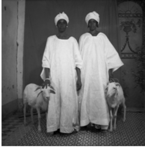
80. Deux camarades , 1974, négatif 6x6 noir et blanc scanné, coll. Sory