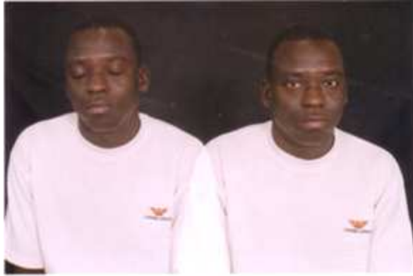
170. Sans titre, 2003, double exposition couleur, 10 x 15 cm, coll. de l'auteur