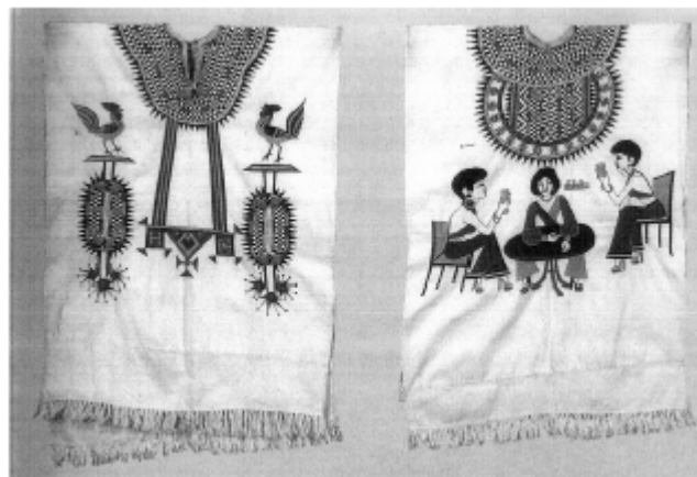
168) Hocine Zaourar, Massacres de Bentalha ou La Madone de Bentalha , 1997, tirage couleur argentique, 34,8 x 51,8 cm, coll. de l'artiste