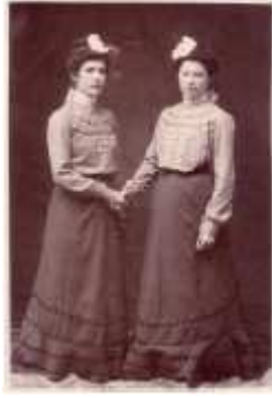
141) Inconnu, sans titre, circa 1920-1930, Budapest, tirage au bromure, 9 x 14 cm, coll. de l'auteur