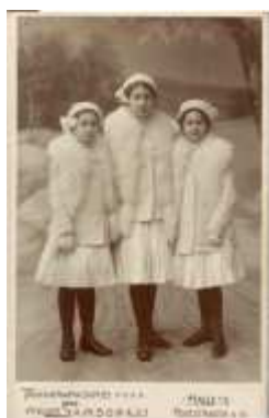
140) Inconnu, sans titre, circa 1900, tirage au bromure, 9,7 x 14 cm, coll. de l'auteur