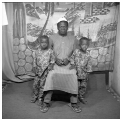
85. Sans titre , 1981, négatif 6x6 noir et blanc scanné, coll. Sory