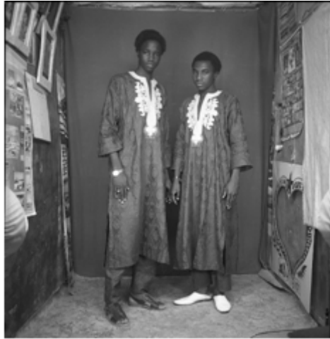
152. Deux amis , 1982, négatif 6x6 noir et blanc scanné