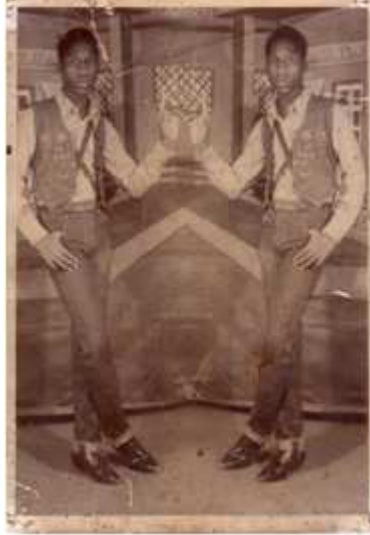
56. Sans titre, 1977, photomontage argentique, 9 x 14 cm, coll. de l'auteur