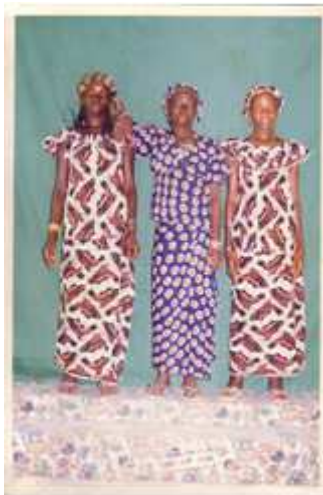
120. Sans titre, 1991, tirage couleur, 10 x 15 cm, coll. de l'auteur