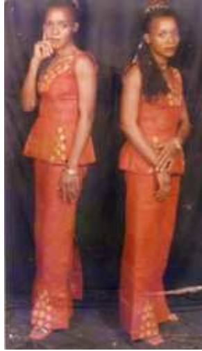
117. Sans titre, tirage couleur, 9 x 14 cm, coll. de l'auteur