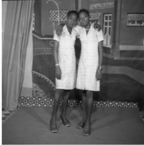
77. Sans titre, 1985, négatif 6x6 noir et blanc scanné, coll. Sory