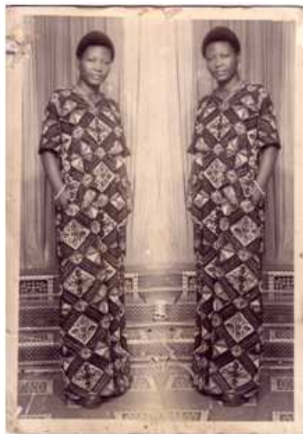
194. Sans titre , 1977, tirage argentique, 10 x 14 cm, coll. de l'auteur