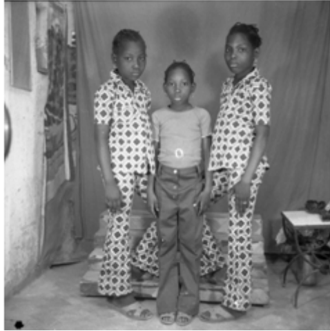
149. Les sœurs , 1981, négatif 6x6 noir et blanc scanné, coll. Shitou