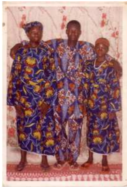
27. Sans titre, double exposition couleur, 12,5 x 8,8 cm