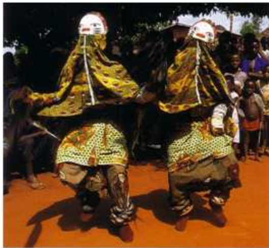
95) Statue d'une mère avec ses jumeaux, Nago-Yoruba, Nigeria Bénin, bois, h. 220 cm, Abomey, Bénin, 2006