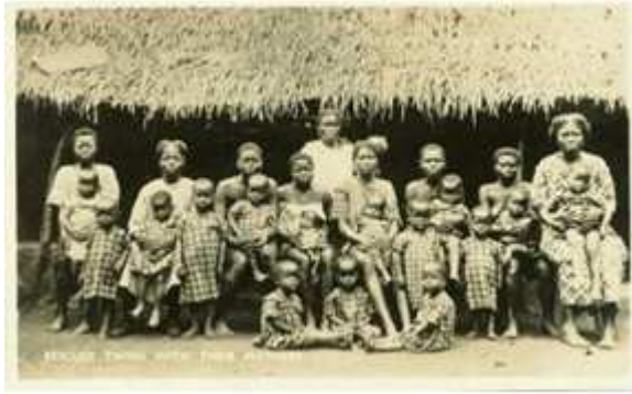
77) Étal d'une marchande de canari , au premier plan à droite canari double de gémellité, terre cuite, Bobo Dioulasso, 2006