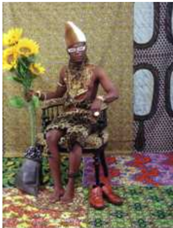
16) Sare B. Warren, L'envers du décor , 2007, tirage couleur, dimensions inconnues, coll. de l'artiste, (exposé par l'Association Contraste, adresse du site Internet: http://www.photo-contraste.com/ )