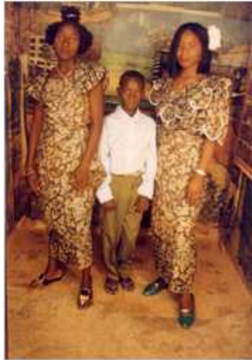
155. Sans titre, 1993, tirage couleur, 10 x 15 cm, coll. de l'auteur