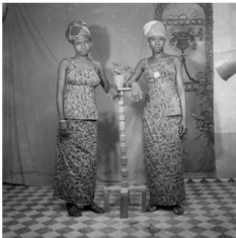
79. Tabaski , 1974, négatif 6x6 noir et blanc scanné, coll. Sory