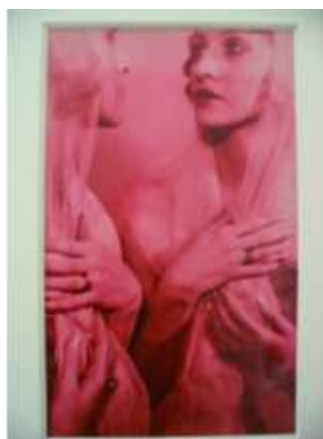
59) Cecil Beaton (1904-1980), Gertrude Lawrence, 1930, bromure, 24,3 x 19,2 cm, National Portrait Gallery, Londres