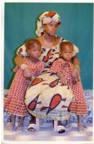
119. Sans titre, 1991, tirage couleur, 10 x 15 cm, coll. de l'auteur