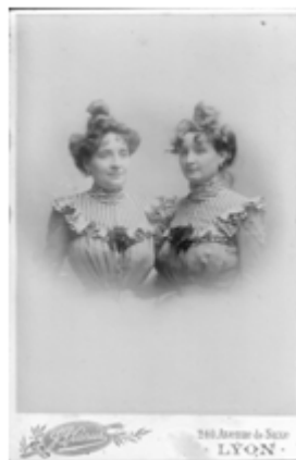
122) Cie Américaine, sans titre, 1915, Lyon, tirage au bromure, 10,5 x 16,5 cm, coll. de l'auteur