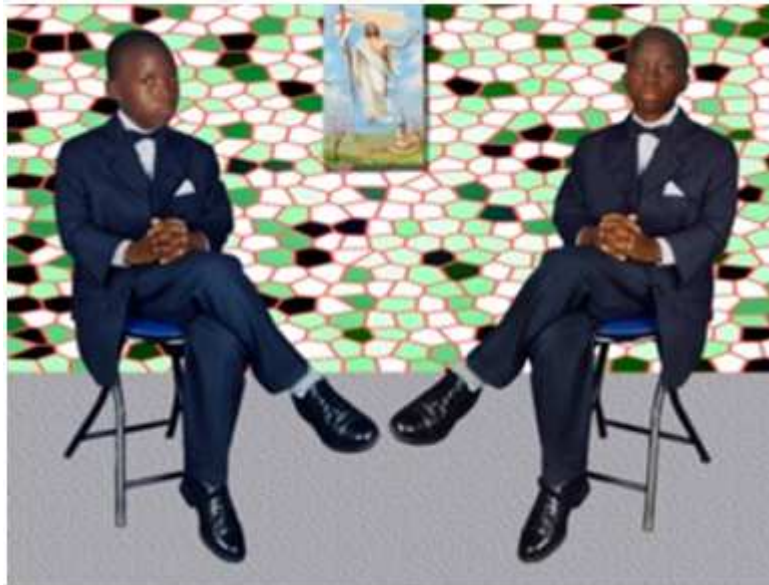
15. Autoportrait , 2003, photomontage numérique sur ordinateur, dimensions variables, coll. de l'auteur