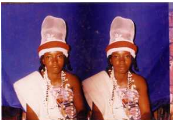
52. Sans titre, 2001, photomontage couleur, 9 x 14 cm, coll. de l'auteur