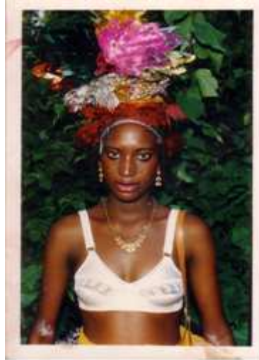
24) Ibrahim Sanou, Femme touareg , 2004, Bobo Dioulasso, tirage couleur, 10 x 15 cm, coll. de l'auteur.