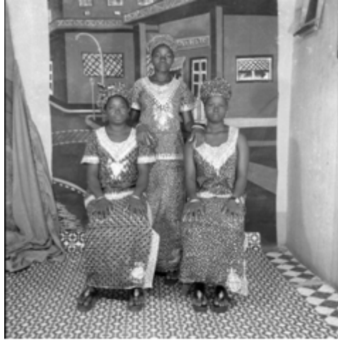
86. Le groupe de musiciens 1979, négatif 6x6 noir et blanc scanné, coll. Sory