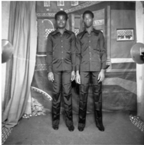
78. Sans titre, 1972, négatif 6x6 noir et blanc scanné