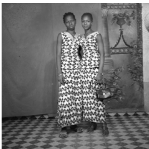
76. Deux sœurs , 1987, négatif 6x6 noir et blanc scanné