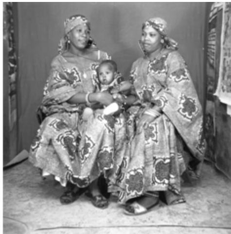
144. Mère et jumelles peul , circa 1977-78, négatif 6x6 noir et blanc scanné