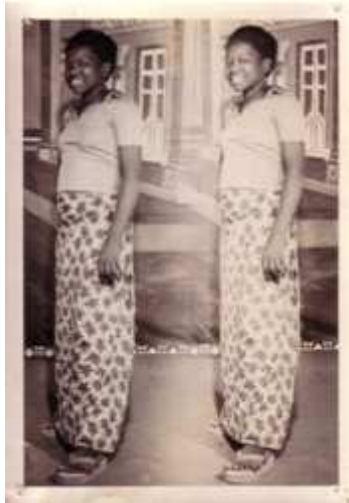
58. Foto Woin , 1985, photomontage argentique, 18 x 24 cm, coll. de l'auteur