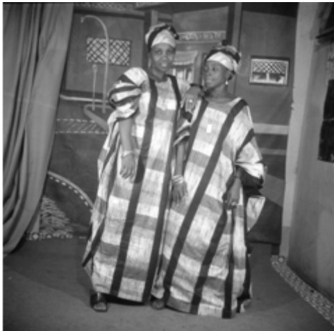
84. Père et ses jumeaux , 1977, négatif 6x6 noir et blanc scanné