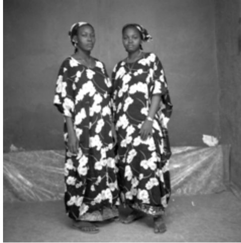
127. Sans titre, 1987, négatif 6x6 noir et blanc scanné