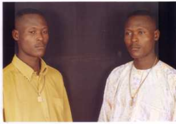
13. Sans titre, 2001, double exposition couleur, 15 x 10 cm, coll. de l'auteur