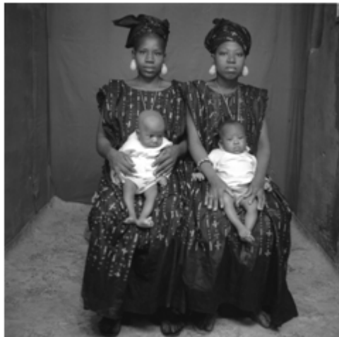
136. Deux sœurs , 1976, négatif 6x6 noir et blanc scanné