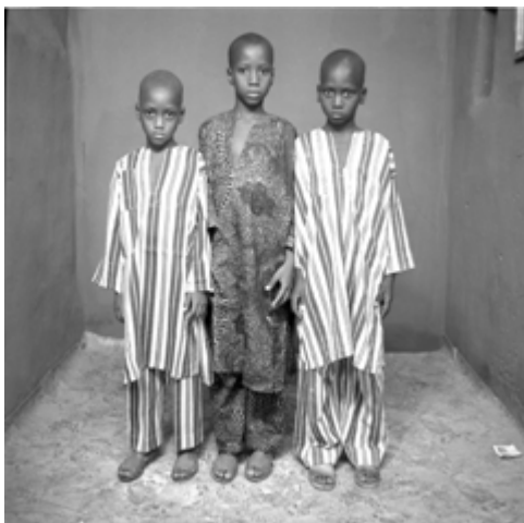
148. Sans titre, 1977, négatif 6x6 noir et blanc scanné