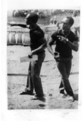
63. Sans titre, 1978, double exposition argentique, 18 x 12,5 cm, coll. de l'auteur