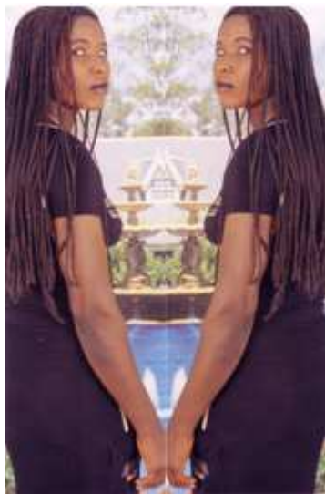
111. Flani foto , 2002, photomontage couleur, 10,3 x 15 cm, coll. de l'auteur