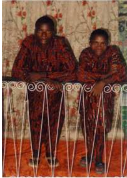
24. Sans titre, 2005, tirage couleur, 8,8 x 12,5 cm, coll. de l'auteur