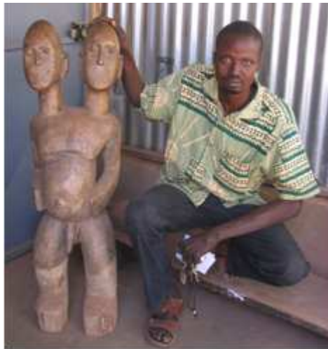
81) Statuettes venavi , autel familial de Atsu Atsufe (et Ata), frère et sœur jumeaux de l'épouse de Germain Edo Dekougdo, Village de Ahoundjjo près de Kpalimé,Togo, 2006, photographie numérique de l'auteur