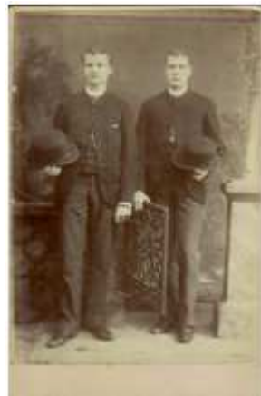
121) J. Planus, sans titre, circa 1890, Lyon, tirage au bromure, 10,5 x 16 cm., oll. de l'auteur