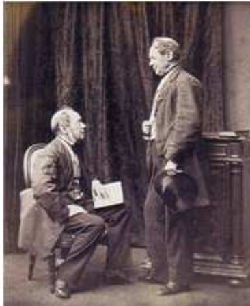
111) E. R. Curtiss, sans titre, Madison Wisc., circa fin XIXe siècle, double exposition épreuve sur papier albuminé, 6 x 10 cm, coll. de l'auteur