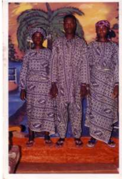
26. Sans titre, 2001, tirage couleur, 8,8 x 12,5 cm, coll. de l'auteur