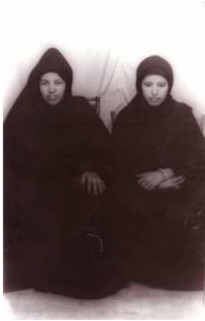
175. Sans titre, 1994, tirage noir et blanc 9 x 14 cm, coll. de l'auteur