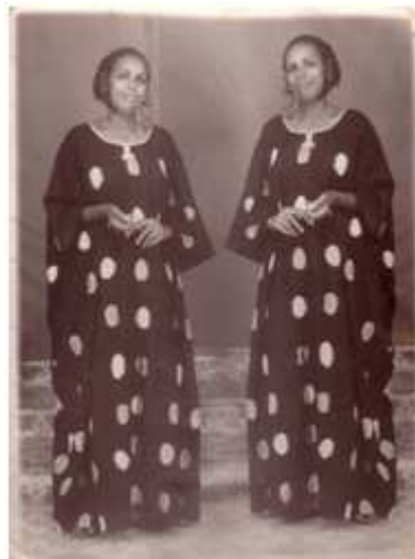
59. Sans titre, 1994, reproduction numérique d'un photomontage argentique, 10 x 15 cm, coll. de l'auteur