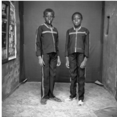
138. Deux amis peul , 1979, négatif 6x6 noir et blanc scanné