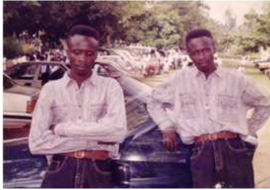
191. Sans titre, 2003, double exposition couleur, 15 x 10 cm, coll. de l'auteur