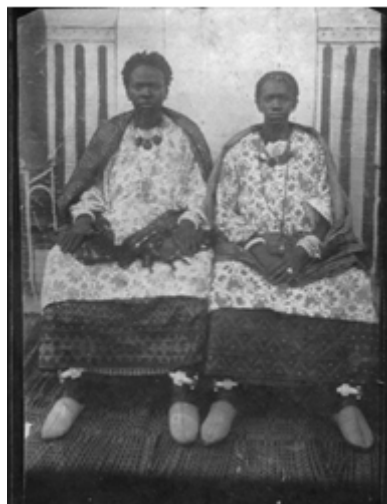
9) Khalilou, Ogooué lambaréné , Jeunes filles , circa 1900-15, carte postale, 9 x 14 cm, You look beautiful like that , p.17