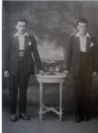
120) C. F. Steinebach, sans titre, circa 1905, Berlin, tirage au bromure, 11 x 16 cm, oll. de l'auteur