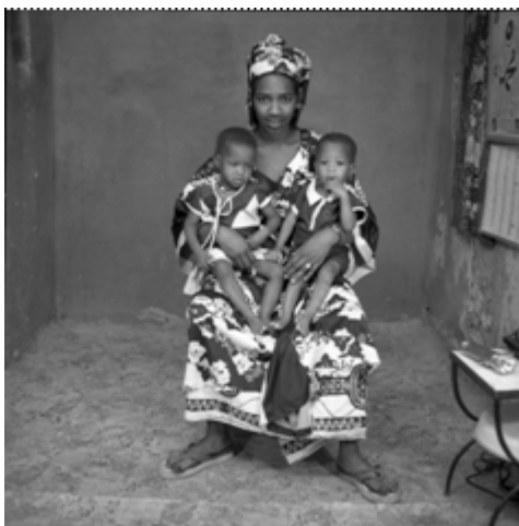
145. Père et jumelles , 1974, négatif 6x6 noir et blanc scanné