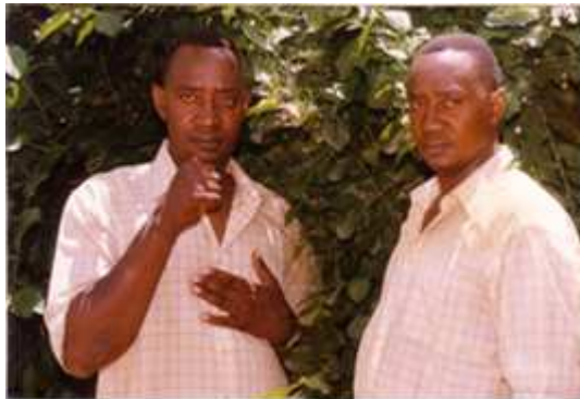
163. Sans titre , 2003, double exposition couleur, 10 x 15 cm, coll. de l'auteur