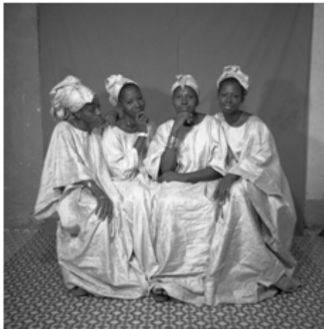
69. Sans titre, 1971, négatif 6x6 noir et blanc scanné