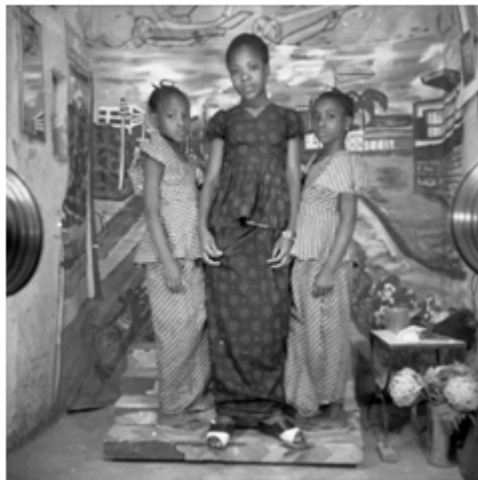
150. Deux amies , circa 1977-78, négatif 6x6 noir et blanc scanné, coll. Shitou