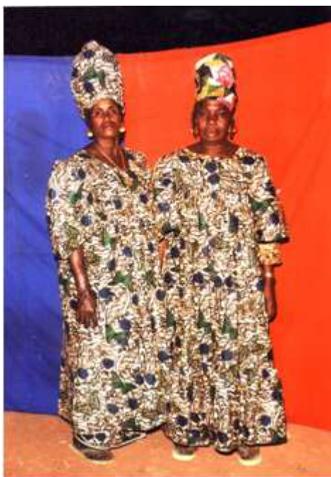
51. Sans titre, 2000, photomontage couleur, 12,7 x 9cm, coll. de l'auteur