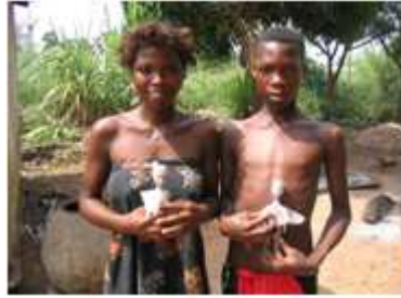
83) Autel des jumeaux hohovi à l'étal d'une marchande de fruits, Ouidah, Bénin, 2005