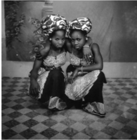
71. Sans titre, 1975, négatif 6x6 noir et blanc scanné, coll. Sory