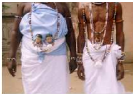
87) Le roi des Abron de la Côte d'Ivoire , Nana Kofi Yeboa, tirage couleur, 1986, coll. Barbier-Müller, ( in Pierre-Alain Ferrazzini, Or d'Afrique , Paris, Hazan, 1990 p. 10)