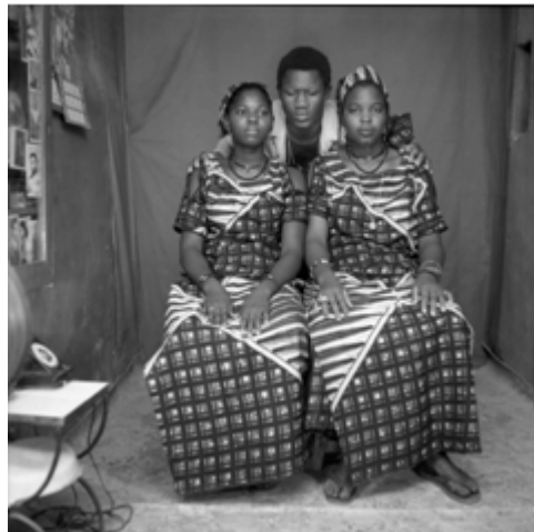
147. Sans titre, 1985, négatif 6x6 noir et blanc scanné, coll. Shitou