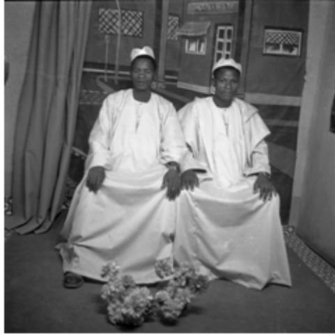
83. Deux amies bobo , 1988, négatif 6x6 noir et blanc scanné