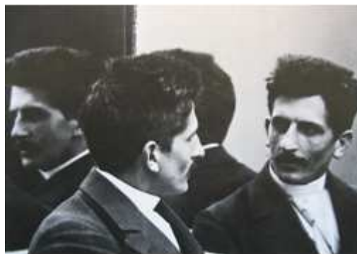
56) Portraits multiples, de Marcel Duchamp (1887-1968), réalisé par un forain au Luna Park de Coney Island, Etats Unis.1917, tirage argentique, 8,7 x 14 cm, coll. privée