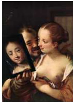
41) Édouard Manet (1832-1883), Devant le miroir , 1876, huile sur toile, 92,1 x 71,4 cm Solomon R. Guggenheim Museum, New York