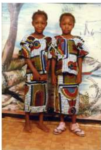
99. Meilleurs vœux , 2000, photomontage couleur, 10 x 15 cm, coll. de l'auteur