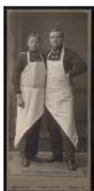
139) Atelier Samson and Co., sans titre, circa 1920, Frankfurt am M., tirage au bromure, 10,5 x 16, 5 cm, coll. de l'auteur