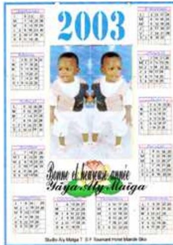
110. Sans titre, 2003, photomontage couleur, 10 x 15cm, coll. de l'auteur