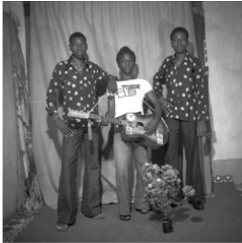
87. Sans titre , 1975, négatif 6x6 noir et blanc scanné, coll. Sory