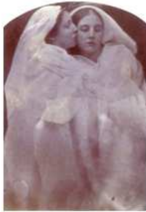
48) André Kertész, Place de la Concorde , 1928, tirage argentique, 35.6 x 27.9 cm, Bruce Silverstein collection