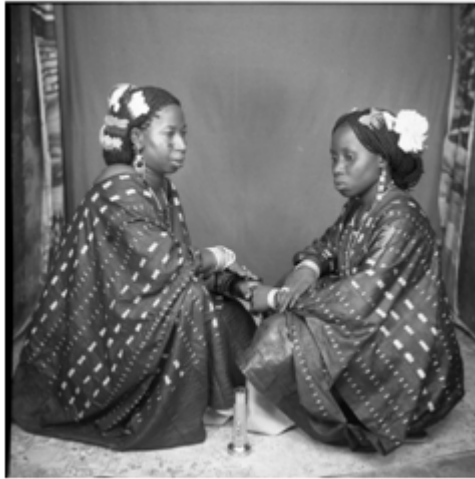
143. Deux sœurs , 1987, négatif 6x6 noir et blanc scanné