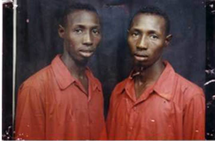
102. Sans titre, 2001, double exposition couleur, 10 x 15 cm, coll. de l'auteur