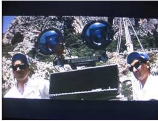
54) Pier-Paolo Pasolini (1922-1975), Medea , 1970, photographie numérique d'un écran vidéo