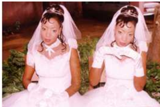
164. Sans titre , 2002, double exposition couleur, 10 x 15 cm, coll. de l'auteur