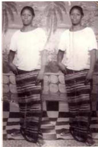
57. Foto Woin , 1990, photomontage argentique, 9 x 12,5 cm., coll. de l'auteur