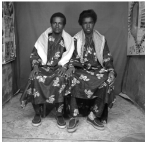
139. Deux sœurs , 1982, négatif 6x6 noir et blanc scanné