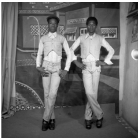
75. Deux sœurs ou deux amies ? , 1979, négatif 6x6 noir et blanc scanné, coll. Sory