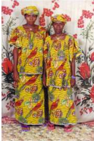
94. Sans titre, 2005, tirage couleur, 10 x 15 cm, coll. de l'auteur