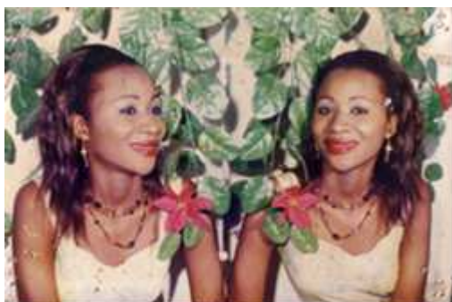
105. Sans titre, 2001, double exposition couleur, 10 x 15 cm, coll. de l'auteur