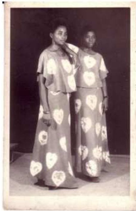
41. Sans titre, 1979, tirage argentique, 8,5 x 13,5 cm, coll. de l'auteur