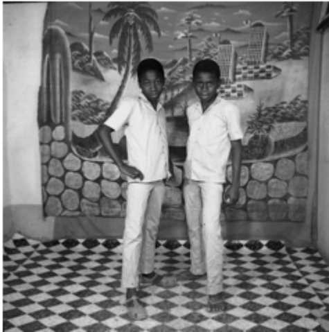
81. Sœurs ou jumelles au bouquet , 1974, négatif 6x6 noir et blanc scanné