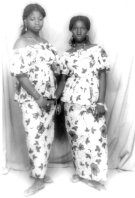
177. Sans titre, 1974, tirage noir et blanc, 9 x 14 cm, coll. de l'auteur