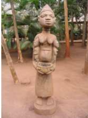
96) Mère et jumeaux, Fante, Akan, Ghana, XIXe-XXe siècle, terre cuite, 46,3 cm, Seattle Art Museum