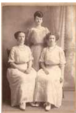
138) Offenbach, Atelier Samson and Co., sans titre, circa 1910-1920, Frankfurt am M., tirage au bromure, 7,5 x 16, 5 cm, coll. de l'auteur