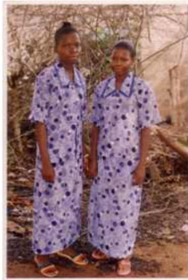
25. Sans titre, 2002, tirage couleur, 8,8 x 12,5 cm, coll. de l'auteur