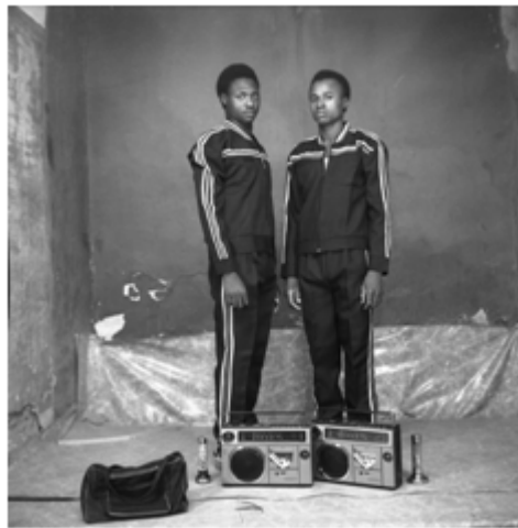
128. Sans titre, 1970, tirage argentique, 9 x 14 cm