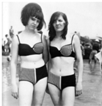
52) Gilbert & George (nés en 1943 Italie et 1942 Grande Bretagne), Magazine sculpture , dimensions inconnues, oeuvre créée pour Le Monde 2, 2004.