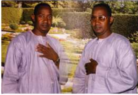
162. Autoportrait , 2003, double exposition couleur, 10 x 15 cm, coll. de l'auteur