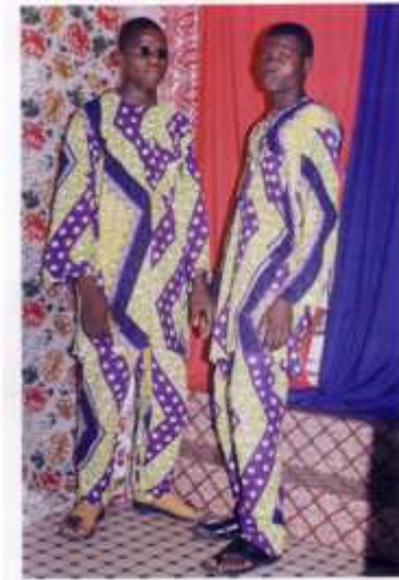
45. Sans titre, 2000, tirage couleur, 12,5 x 8,5 cm, coll. de l'auteur