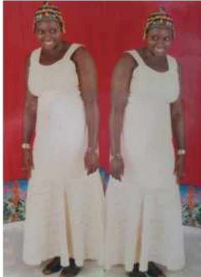
115. Sans titre, 2001, tirage couleur, 10 x 15 cm, coll. de l'auteur