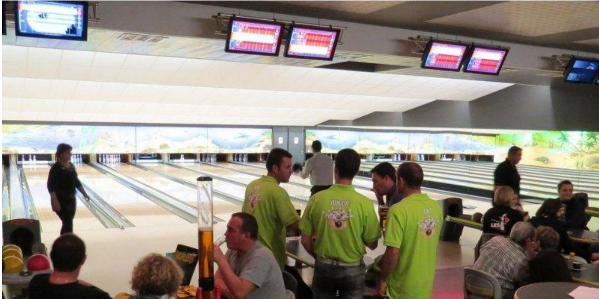
Photos de l'entreprise Saintes Bowling