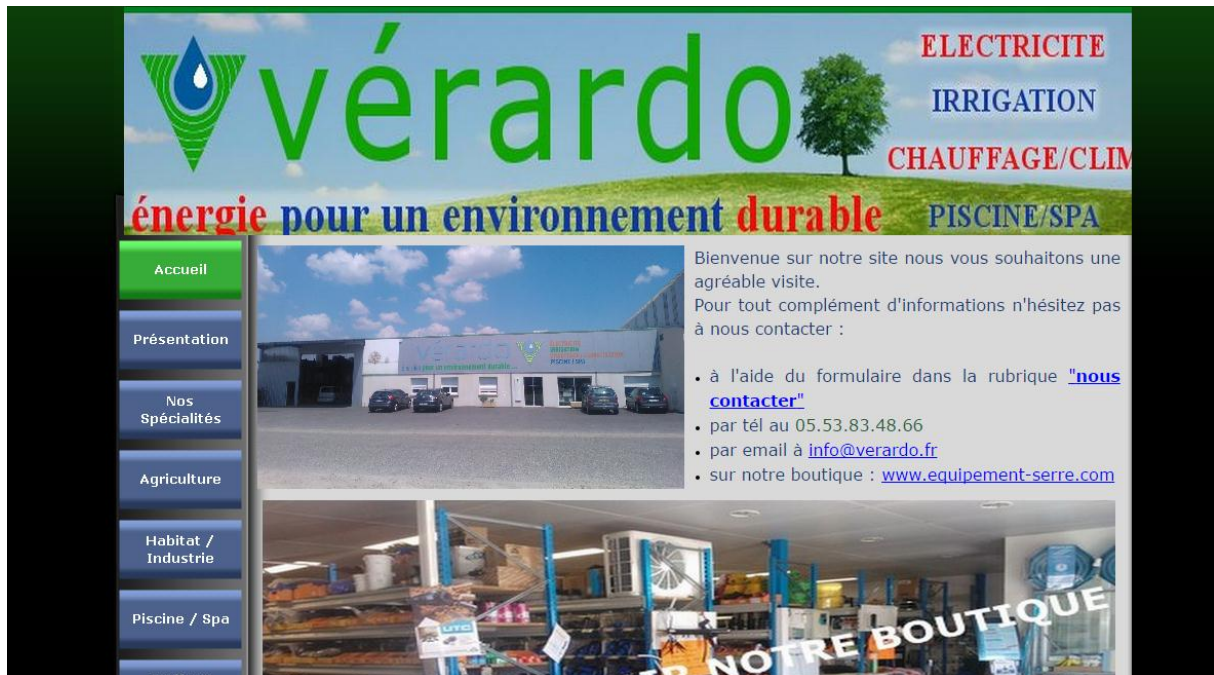
Capture d'écran du site internet de l'entreprise