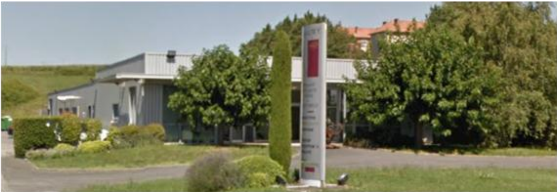
Façade de l'entreprise Maumy