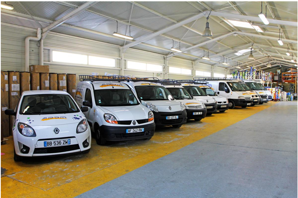
Les véhicules et leur logo