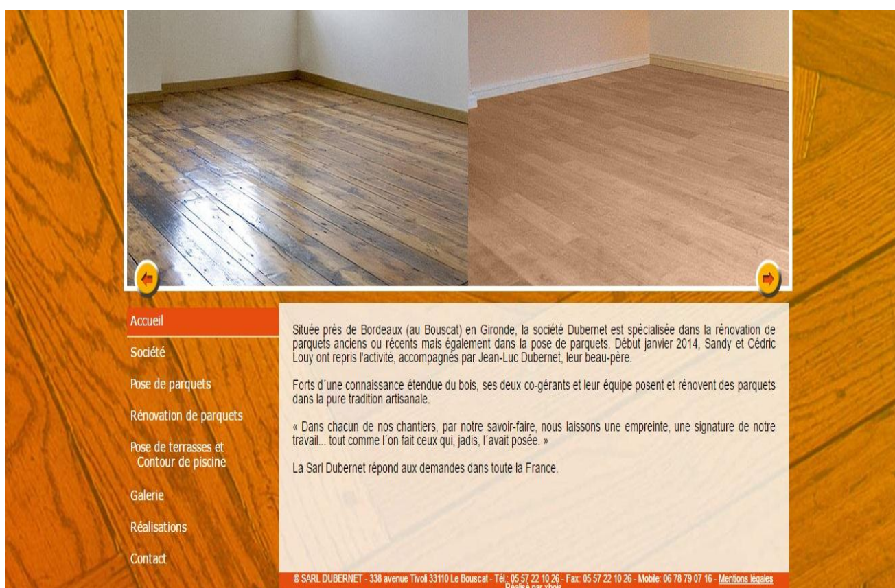
Capture d'écran du site internet de l'entreprise