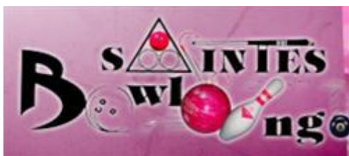
Logo de l'entreprise Saintes Bowling