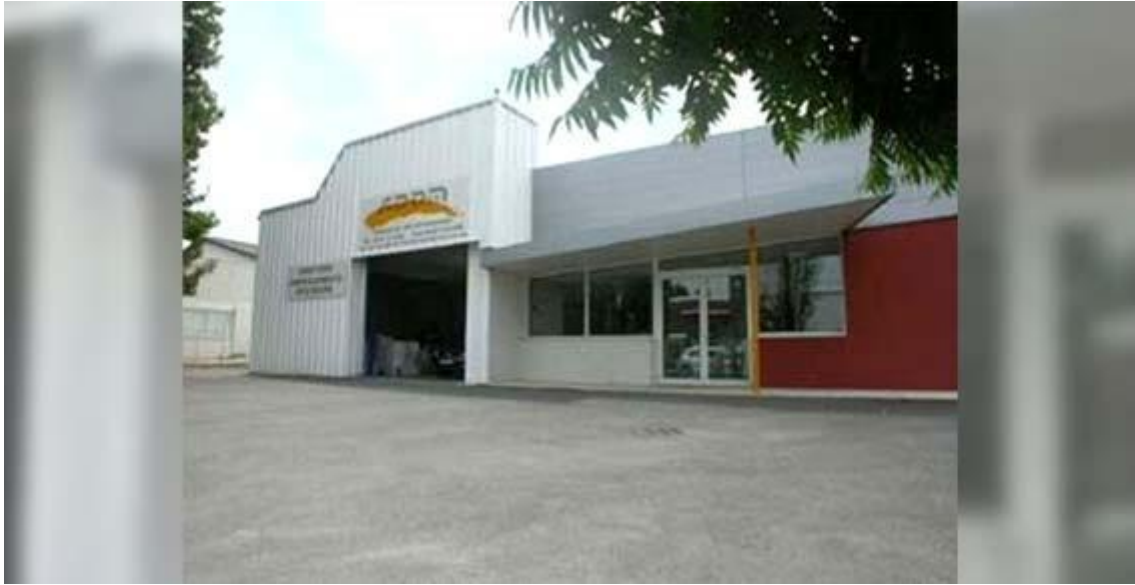
Photo de la façade de l'entreprise EPRM