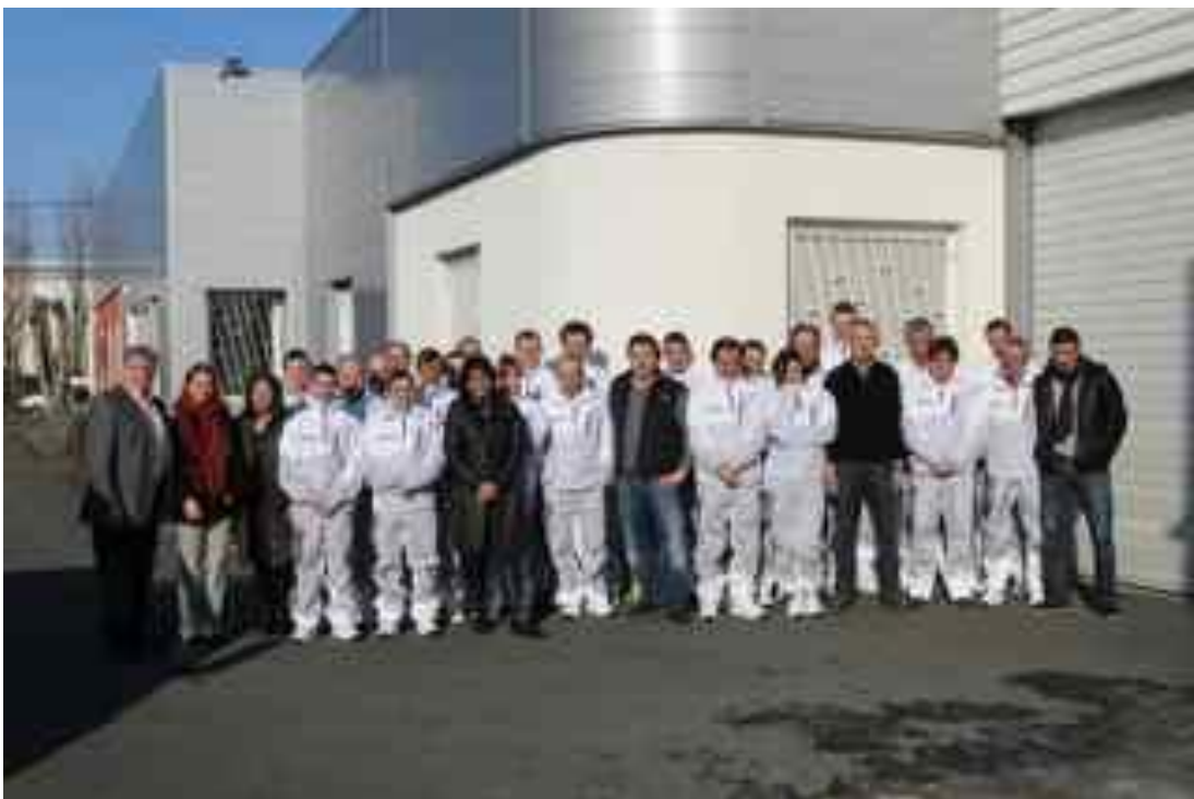
Les employés et l'équipe dirigeante