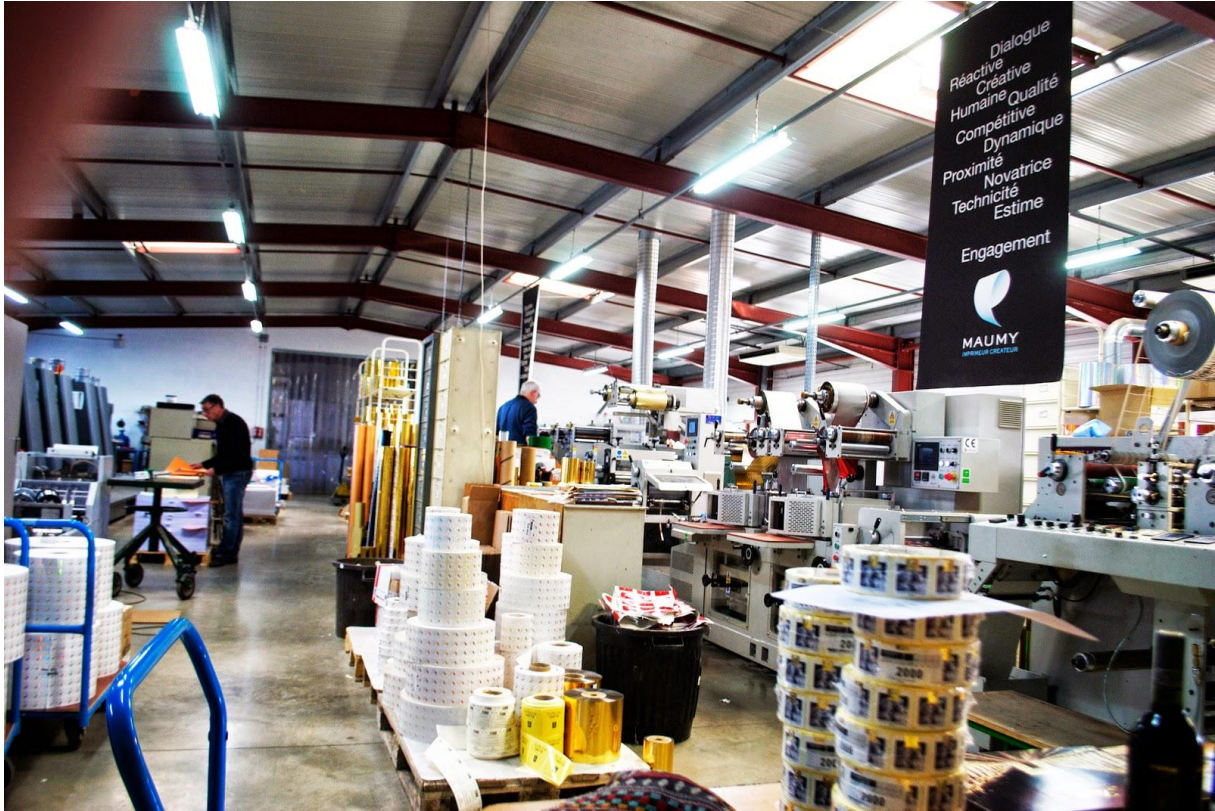
Entreprise Maumy vue de l'intérieur