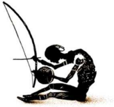
Illustration d'un joueur de hungu (ou mbulumbumba).

<mbulumbumba> = nom kimbundu d'un instrument de musique traditionnel utilisé dans la capoeira, appelé hungu au Brésil et au Portugal :