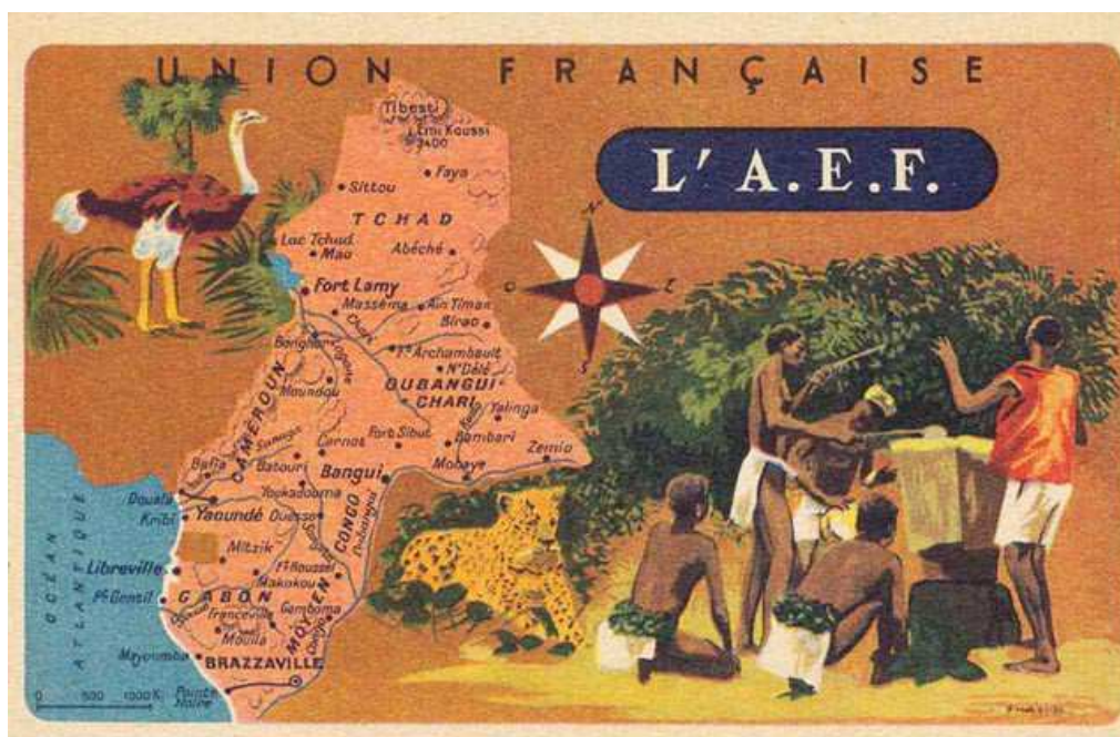
Carte de l'Afrique Equatoriale Française