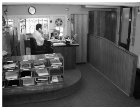
Recepción del PIIE (en la casa central)