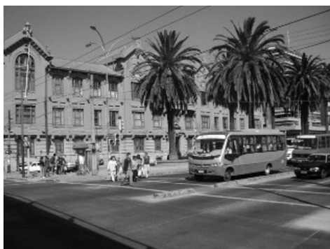
Casa central PUCV