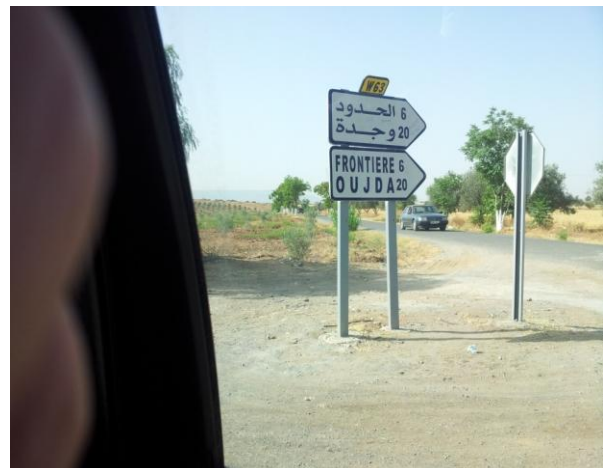
Panneau d'indication côté algérien