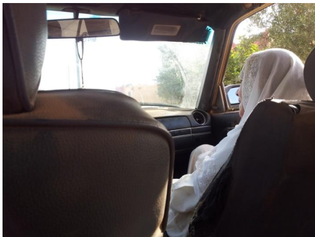
Passagère vêtue de blanc évoquée dans le récit de la traversée