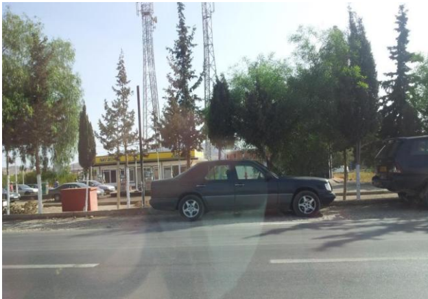
File de moqatilat devant une station essence du côté algérien de la frontière