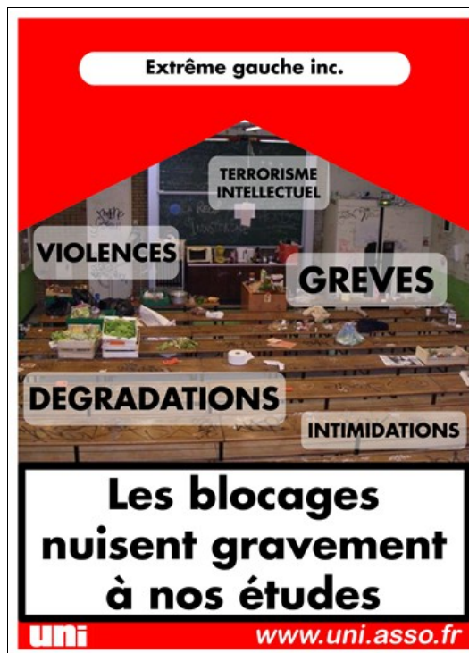
Affiche publiée en mars 2009