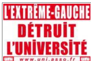
Affiche publiée en avril 2009