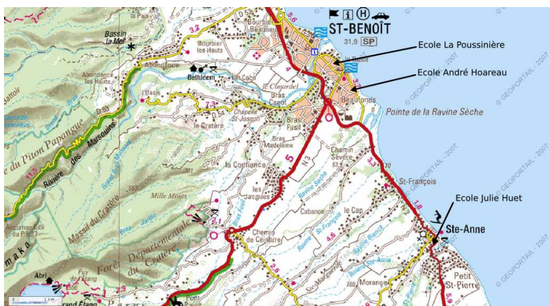
FIGURE 5.2 – Les trois écoles bénédictines.

Elle se situe dans un zone d'habitation tranquille composée en majorité de maisons individuelles de plein pied, dont les habitants ont des CSP diversifiés. Il s'agit d'une école primaire, on y comptait 139 enfants inscrits en pré-élémentaire. On peut la situer, au sud de Saint-Benoît, sur la carte répertoriant l'emplacement des trois écoles où nous sommes intervenue (cf. figure 5.2).