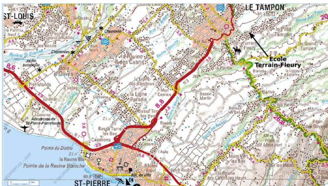
FIGURE 5.3 – L'école tamponnaise.

Pour Le Tampon, nous avons choisi une école maternelle dont l'école élémentaire attenante avait des résultats moyens en français aux Evaluations nationales, selon les mêmes paramètres, pour la circonscription concernée. Notre choix s'est porté sur l'École Terrain-Fleury (cf. figure 5.3).