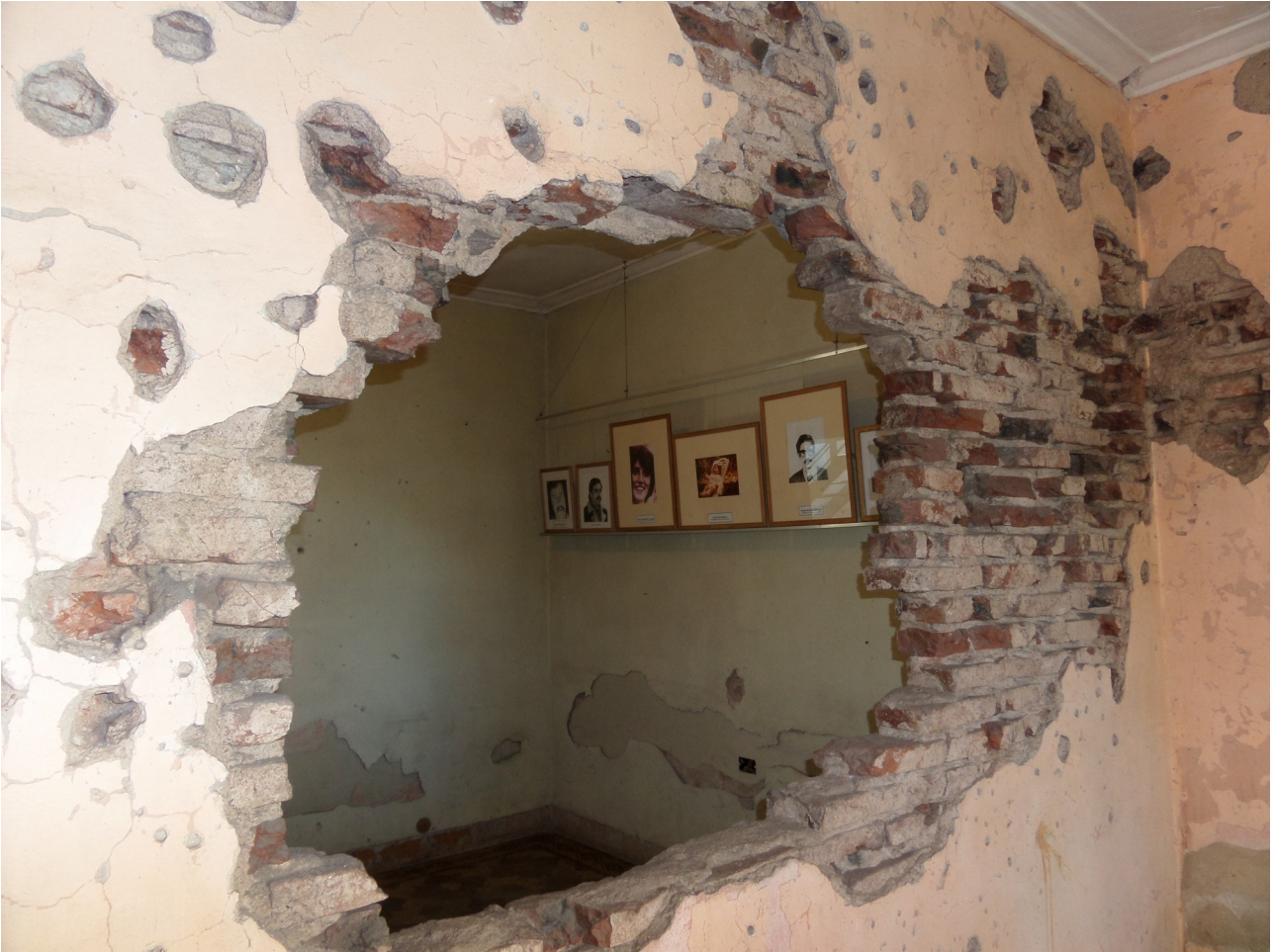
Casa Mariani-Teruggi , photo personnelle, 6 septembre 2014.