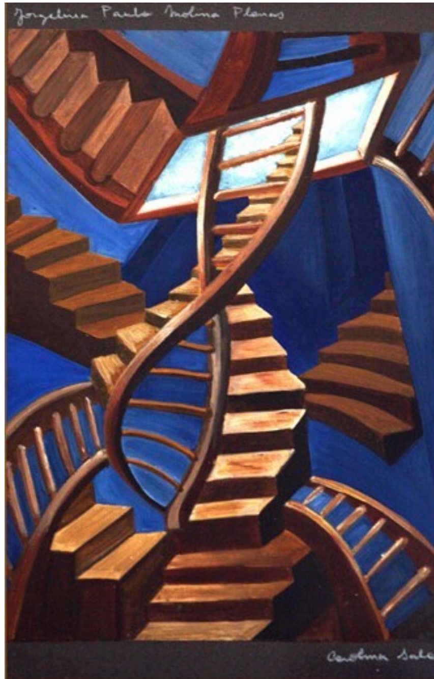
Laberinto II (Série Verdadero o falso ), Acrylique sur toile, 1994, 26 x 33 cm, Buenos Aires

Les tableaux de la série Verdadero o falso incluent en particulier des représentations de labyrinthes. Là encore, l'artiste a souhaité mettre en avant ses propres sensations et sentiments : les labyrinthes sans issue, les escaliers interminables et tortueux ou les espaces ouverts sur de grands vides sont une métaphore de la recherche de ses origines.