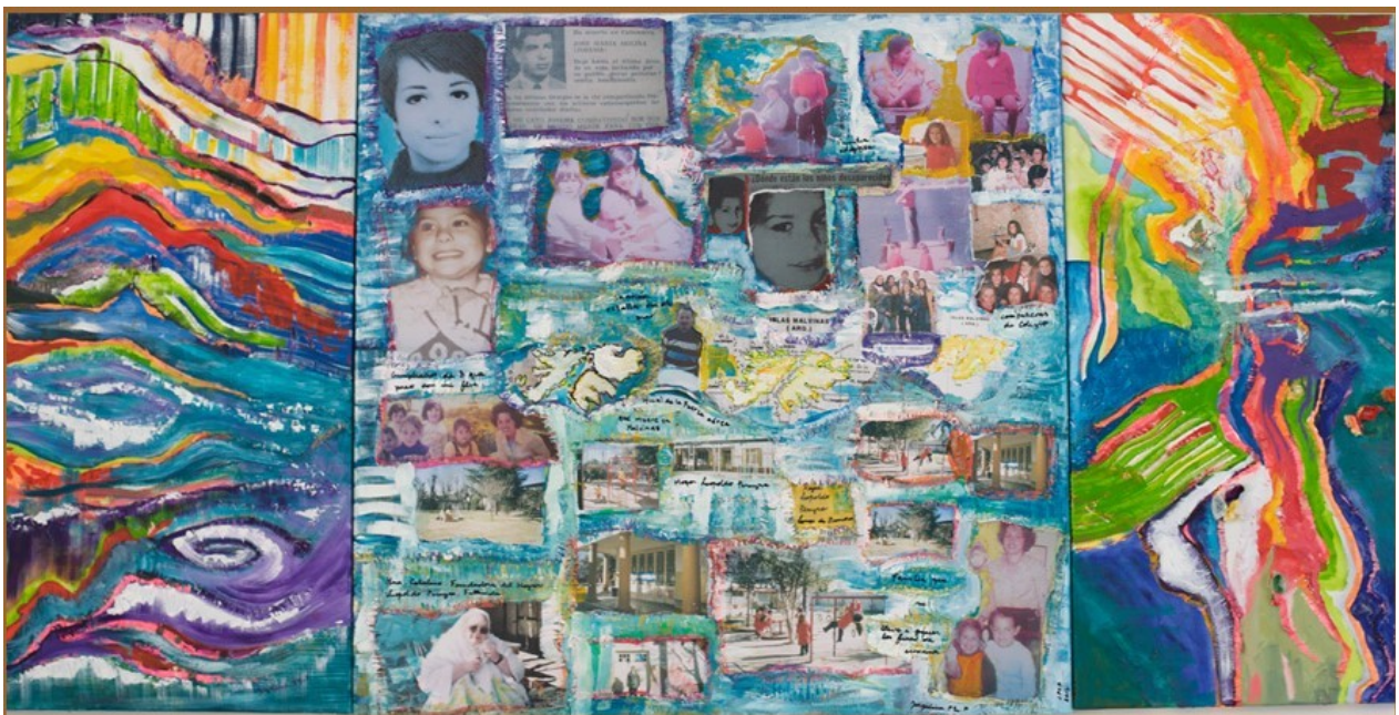
Como un mar , technique mixte sur toile, 2010, 70 x 110 cm, Buenos Aires

Ce tableau est pour elle la représentation d'une histoire véritable à laquelle elle ne peut avoir accès et qui reste dissimulée par une autre : « toute une histoire cachée derrière une apparence 1 », nous dira l'artiste en commentant son œuvre en novembre 2012. 2