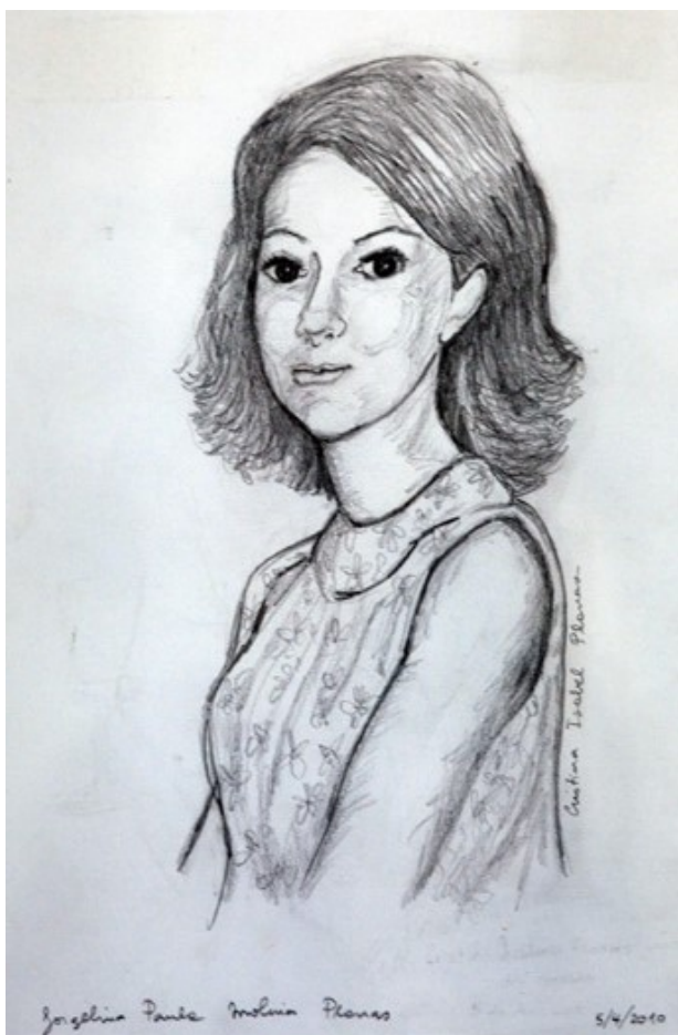
Mi mamá , crayon noir sur papier, 2010, 35 x 45 cm, Buenos Aires