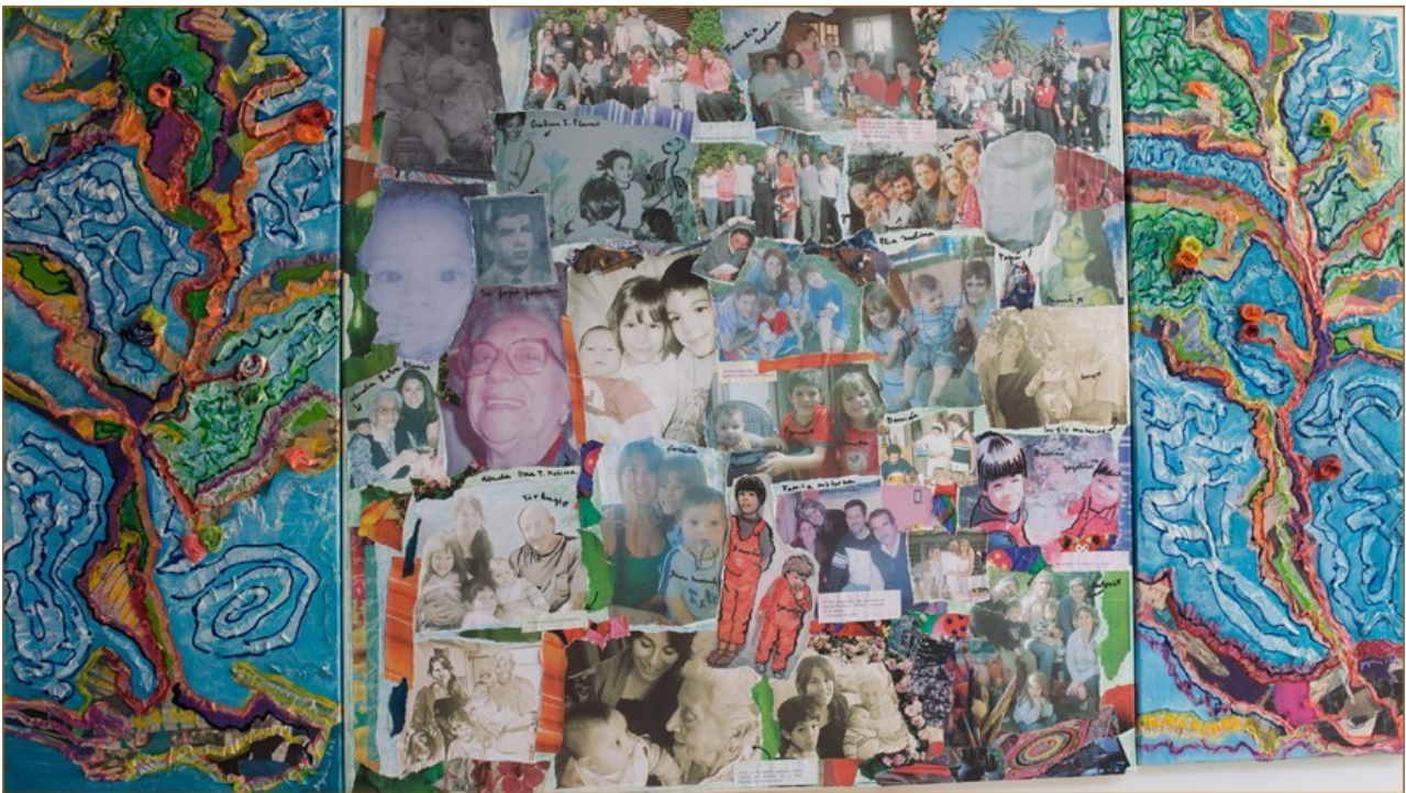
Árbol genealógico , technique mixte sur toile, 70 x100 cm, Buenos Aires

L'artiste a souhaité unir symboliquement les membres de sa famille biologique qui avait volé en éclats à cause du terrorisme d'État. Unir dans un tableau les êtres humains d'une même famille qui n'avaient jamais pu se rencontrer ou vivre ensemble.