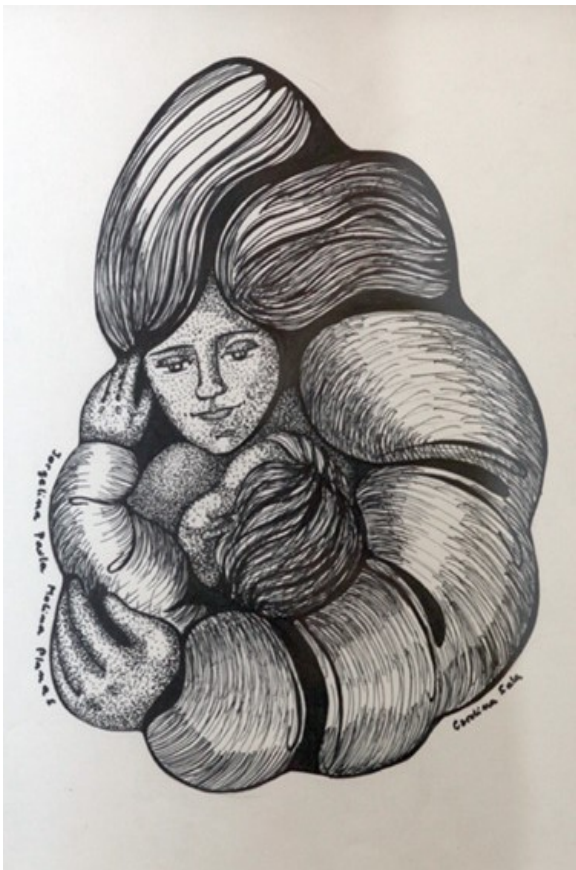
Maternidad , rotting sur papier, 1993, 30 x 42,5 cm, Buenos Aires