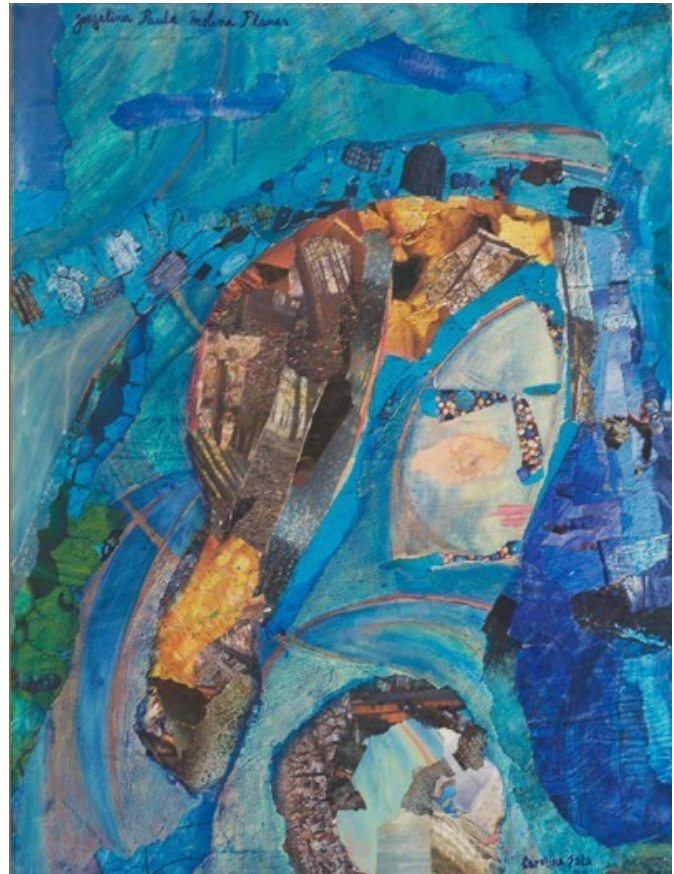
Madre e hija , technique mixte sur toile, 2010, 70 x 90 cm, Buenos Aires