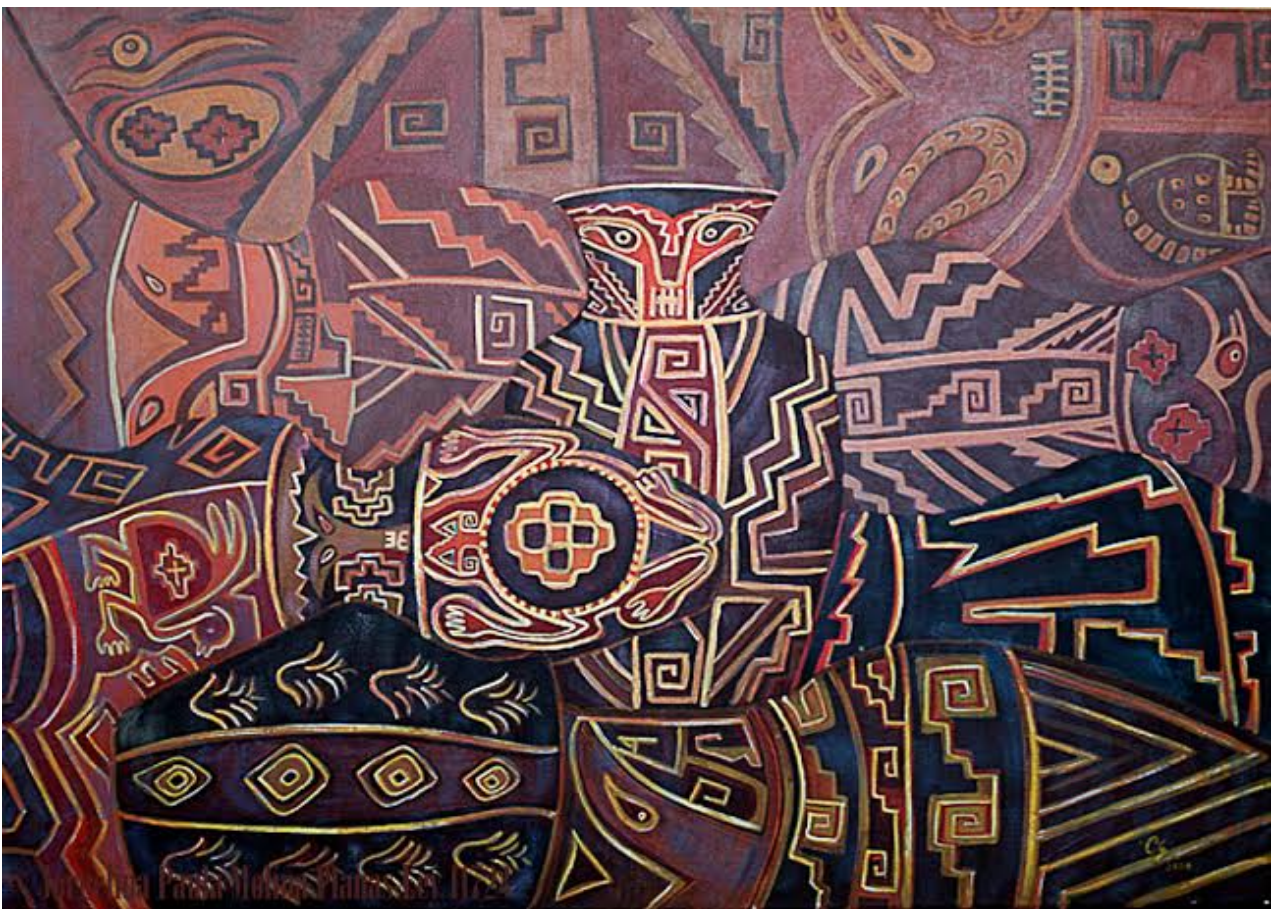
Paisaje de Catamarca , Acrylique sur toile, 2006, 70 x 90 cm, Buenos Aires