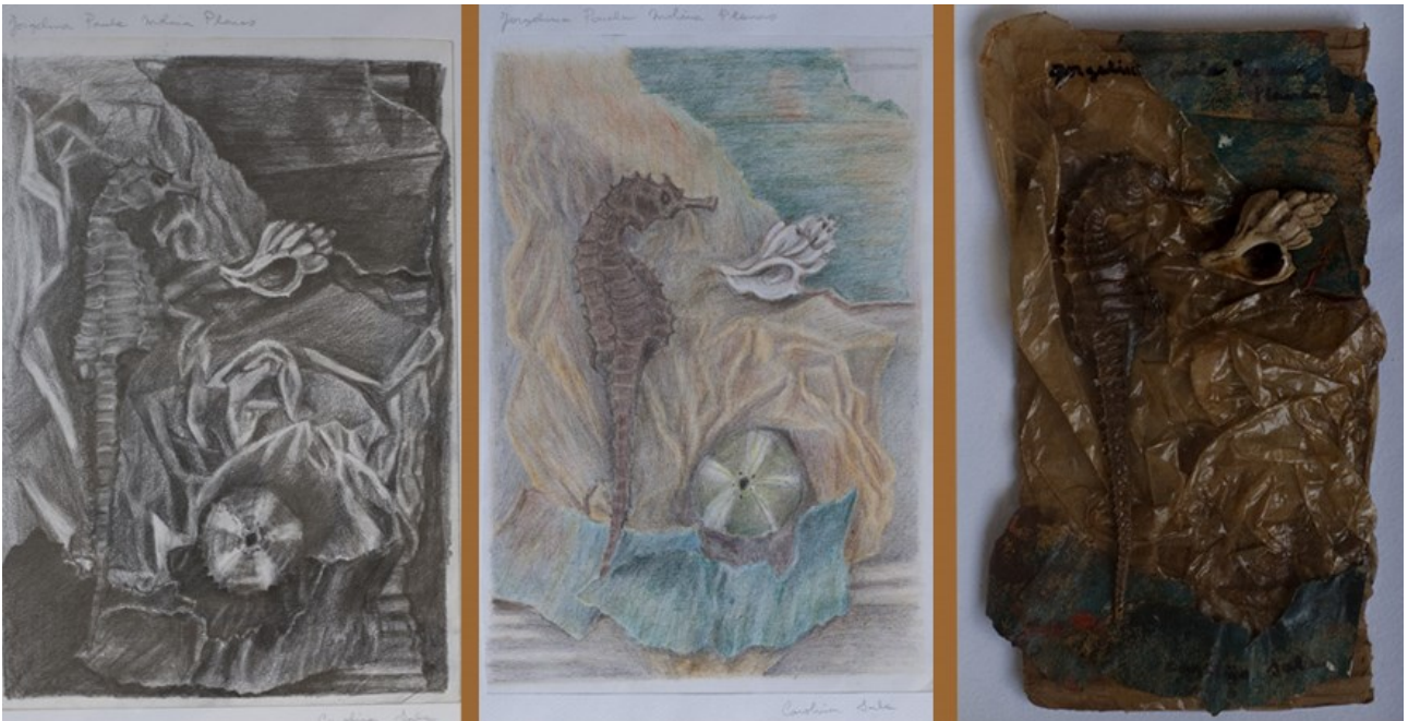
Caballito de mar encontrado en la montaña , Collage, 1994, 23 x 29 cm, Buenos Aires

L'œuvre intitulée Caballito de mar encontrado en la montaña peut elle aussi mériter une analyse en ce sens : ce tableau est, du point de vue de l'artiste, sa métaphore visuelle du vol d'enfant en Argentine. En effet, en représentant « un hippocampe retrouvé en montagne » (comme le suggère le titre), elle fait allusion aux enfants volés de l'Argentine : arrachés à leur « monde », à leurs « racines » et à leur vraie famille, pour être placés dans un milieu auquel ils n'appartiennent pas, dans un environnement le plus souvent caractérisé par le mensonge, opposé à celui auquel ils appartiennent réellement.