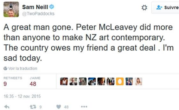
Illustration - 1. Tweet de l'acteur Néozélandais, Sam Neill partageant la nouvelle du décès de son ami Peter McLeavey sur le réseau Twitter .

septembre 2012, pour services rendus aux arts, McLeavey est celui au moyen de qui de nombreux artistes ont pu vivre de leur art 651 .