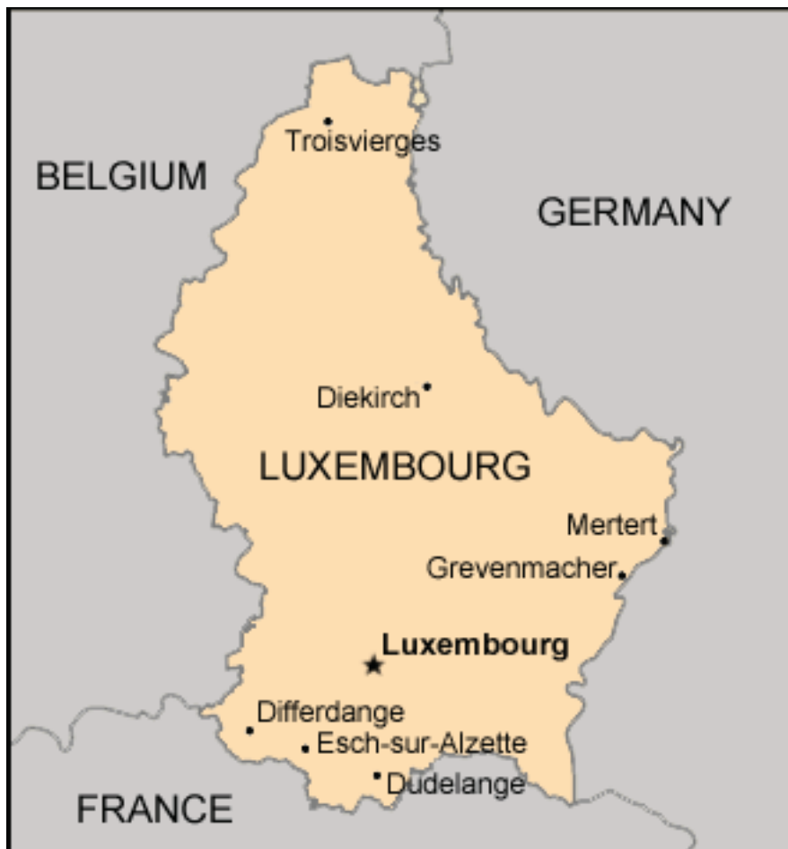
Figure 1 : localisation géographique du Luxembourg