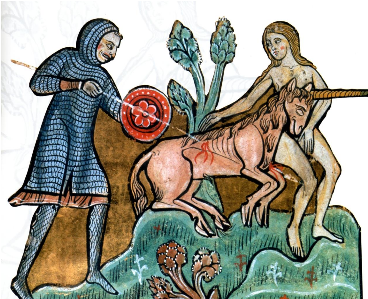
Une illustration de la légende selon laquelle on peut capturer la Licorne (animal symbolisant la pureté) seulement à l'aide d'une Vierge, Bestiaire , manuscrit enluminé, 1225, British Library.

Dans Il nome della rosa les visions d'Adso se produisaient aussi seulement sur un fond de pénombre, de lumière douce, diffuse. On serait tentés de croire que toutes ces apparitions surnaturelles ne sont qu'imagination et mensonge d'un garçon feignant, « più busiardo di giuda 1 » qui invente des histoires « per non fare gnente 2 », c'est-à-dire pour se soustraire aux labeurs quotidiens. Ce qui était en grande partie vrai. Mais, ces visions surviennent uniquement quand l'astre du jour est sur le point d'aller se coucher et quand le brouillard se fait épais et grisant. En d'autres termes, elles se manifestent une fois que les conditions préalables à l'état de voyance sont accomplies. L'enfant raconte qu'un soir d'avril,