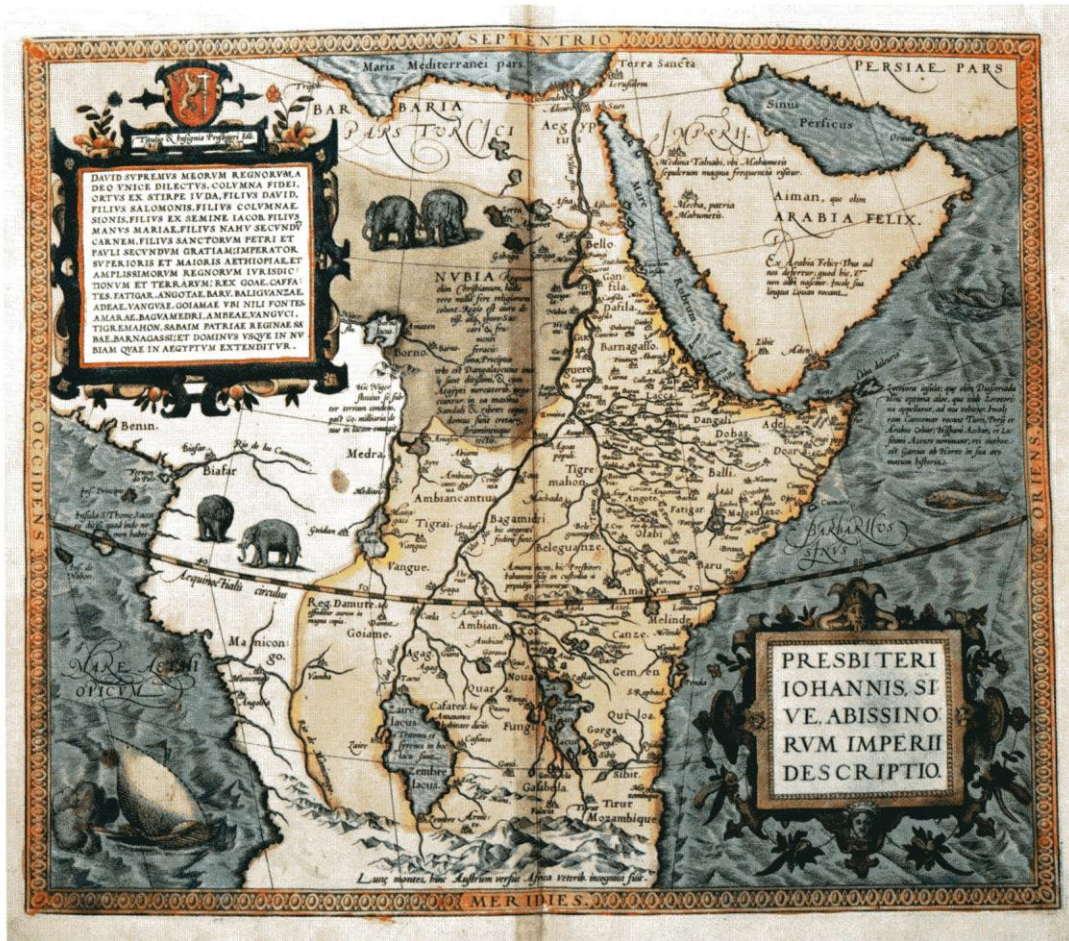
Abraham Ortelius, L'Empire du Prêtre Jean , in Theatrum Orbis Terrarum (Le Théâtre du monde, 1564, détail) , Bibliothèque de l'Université de Bâle

« ... tutti i mostri del profondo del mare, l'alba et la sera, le moltitudini che vivono nell' Ultima Thule, una ragnatela di fili color dell'aluna al centro di una piramide nera, i fiocchi di una sostanza bianca e fredda che cadono dal cielo sull'Africa Perusta nel mese d'agosto, tutti i deserti di questo universo, ogni lettera di ogni foglio di ogni libro, tramonti color di rosa sopra il Sambatyon, il tabernacolo del mundo posto tra due lastre lucenti che lo riproducono all'infinito, distese d'acqua come laghi senza rive, tori, tempeste, tutte le formiche che esistono sulla terra, una sfera che riproduce il moto delle stelle, il segreto palpitare del proprio cuore e delle proprie viscere, e il volto di ciascuno di noi quando saremo transfigurati dalla morte... 1 ».