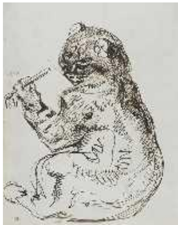
Delacroix, « Chat écrivant au pinceau », croquis, 1831

Donc, encore une fois, on ne peut affirmer qu'il y a eu des influences réciproques entre les écrits d'Eco et cet essai sur le sonnet de Baudelaire. Alors pourquoi un chat et non pas un chien ou n'importe quel autre animal ? C'est parce que les idées circulent librement et que, sans le vouloir, parfois elles s'entrecroisent. Comme nous allons le voir plus loin dans notre étude, à cette époque l'« ouverture » était un phénomène qui embrassait tous les domaines de la science et de l'art. Cet air du temps pourrait expliquer, en quelque sorte, toute une série de coïncidences.