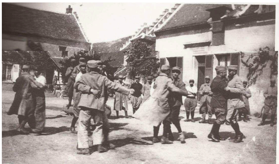
Dans la cours d'une ferme, une fête entre hommes [No pátio de uma fazenda, uma festa entre homens]. 1915.

No entanto, as proibições oficiais não impedem a organização de bailes clandestinos, inclusive entre os militares, como mostra uma fotografia de um baile entre os soldados. Esta imagem é notável pois representa exclusivamente homens que dançam entre si. Os militares encontram assim um meio, na ausência de mulheres, de criar um dispositivo original de baile. Embora proibida durante a guerra, a dança continua a existir também entre os civis e ganha um status de “prazer proibido”.