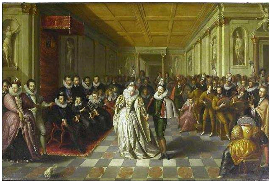
Bal des noces du duc de Joyeuse [Baile de núpcias do duque de Joyeuse]

Joyeuse e sua esposa, Marguerite de Vaudémont, dançam com elegância, diante da família real e do clã de Lorraine.