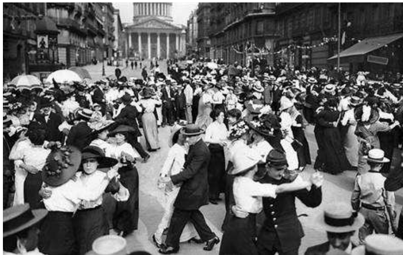
Um baile popular organizado em frente ao Panteão, em Paris. 1912.

Na foto abaixo, de Maurice Branger, vemos um baile de 14 Julho em frente ao Panthéon de Paris , em 1912, imortalizando uma imagem emblemática destas festividades nacionais.